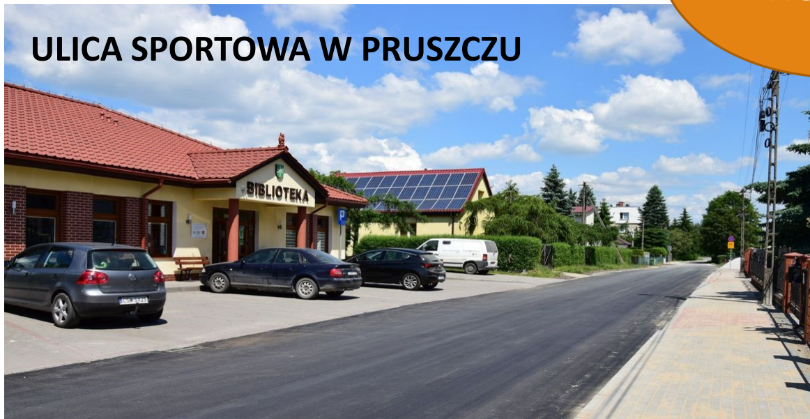
ULICA SPORTOWA W PRUSZCZU