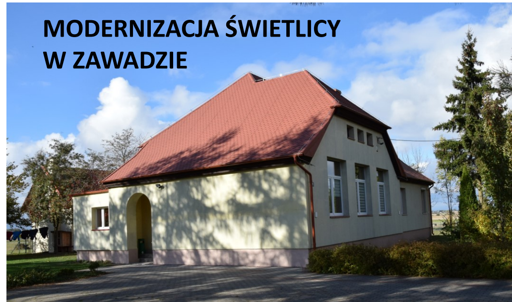
MODERNIZACJA ŚWIETLICY W ZAWADZIE