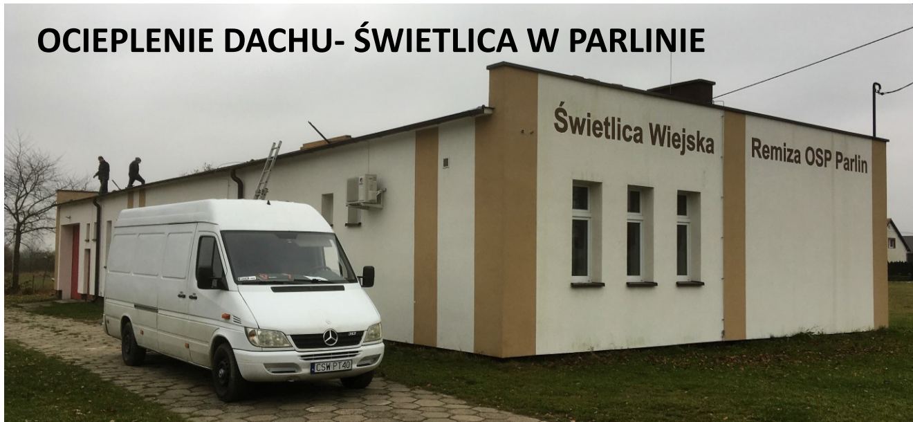
OCIEPLENIE DACHU- ŚWIETLICA W PARLINIE