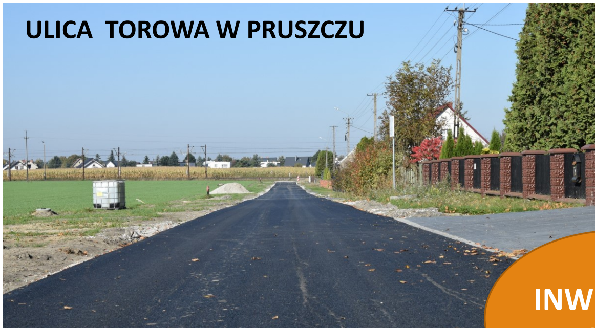
ULICA TOROWA W PRUSZCZU