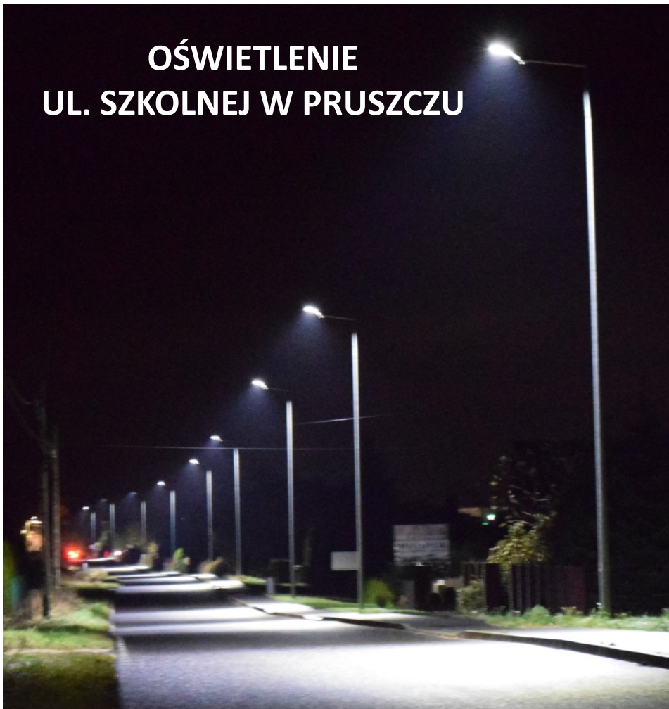
OŚWIETLENIE UL. SZKOLNEJ W PRUSZCZU