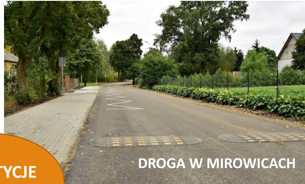
DROGA W MIROWICACH