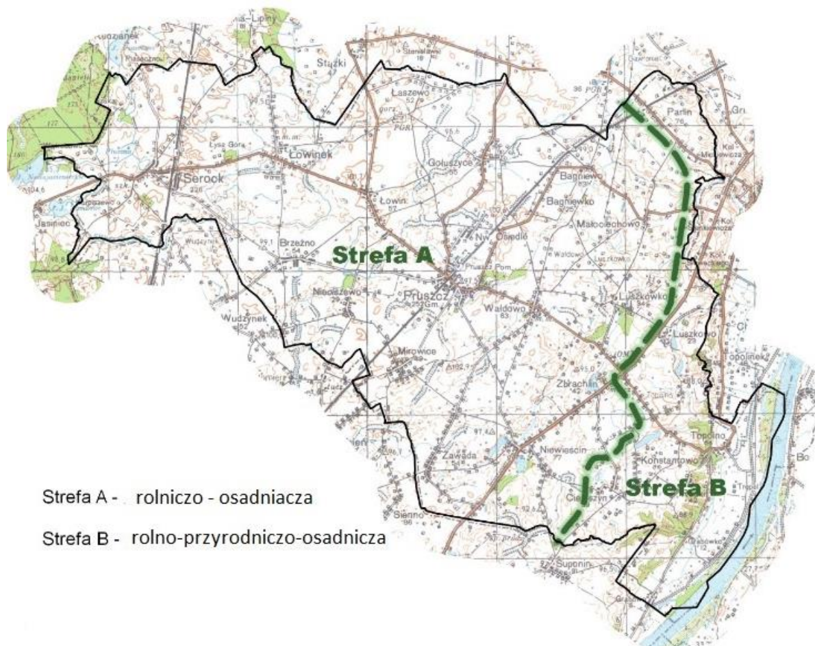
Rysunek 1. Podział gminy Pruszcz na strefy funkcjonalno-przestrzenne.