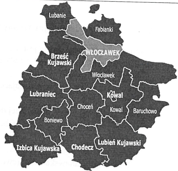
Rysunek 2. Położenie gminy Chocień w powiecie włocławskim