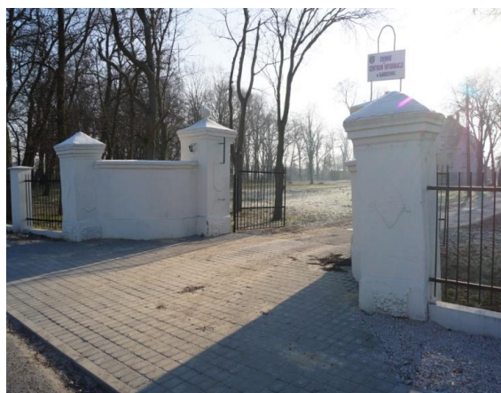
Fot.8. Brama wjazdowa