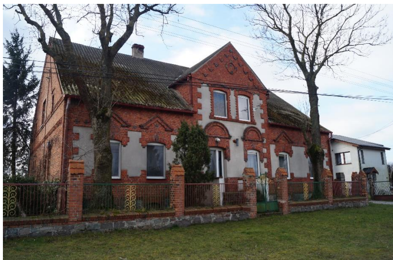
Fot. 3. Budynek dawnego dworu