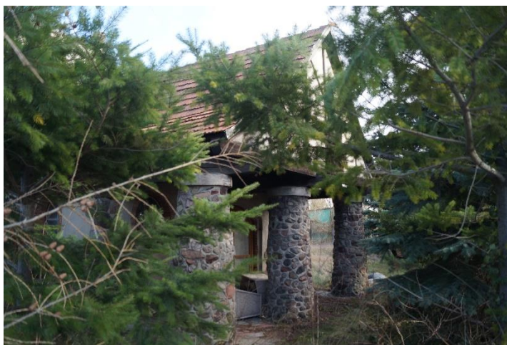
Fot. 10. Dom z kuźnią