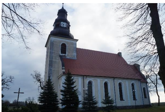
Fot. 1. Kościół pw. NMP Królowej Polski