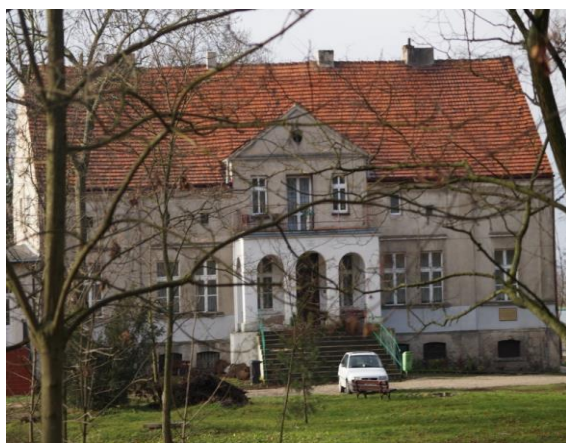
Fot. 7. Dwór w Ślaboszewku