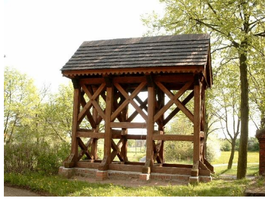
Fot. 5. Zabytkowa dzwonnica