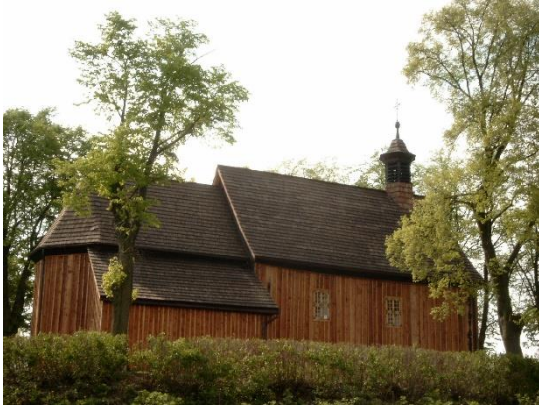
Fot. 4. Kościół p.w. Św. Wawrzyńca