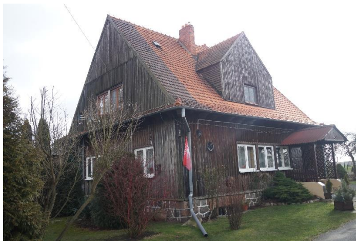
Fot. 12. Leśniczówka