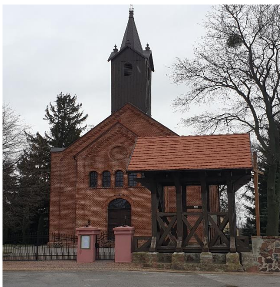
Fot. 11. Kościół p.w. Św. Bartłomieja