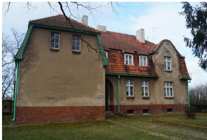
Fot. 6. Dawna szkoła