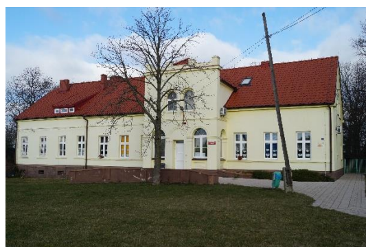
Fot. 2. Budynek dawnego dworu