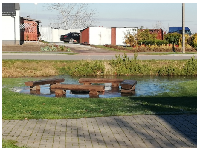
Ławeczki na terenie rekreacyjnym