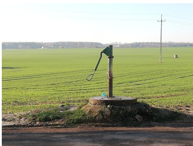
Pompa do wody