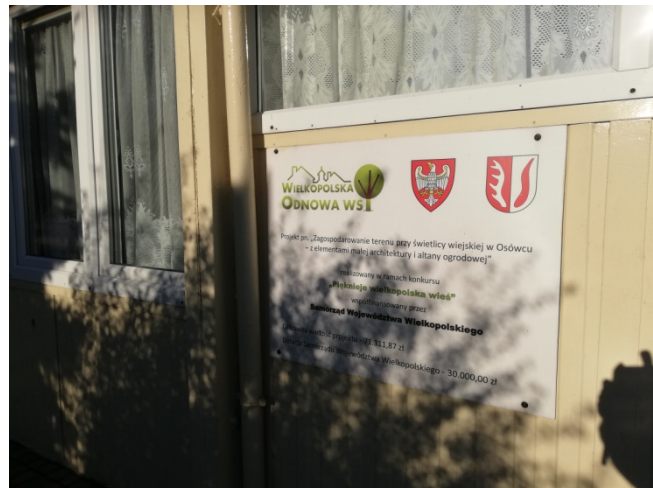
Budynek świetlicy wiejskiej