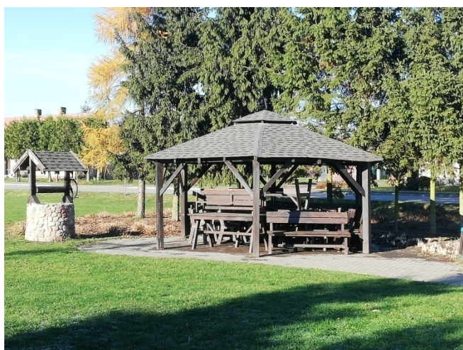
Altana na placu rekreacyjnym