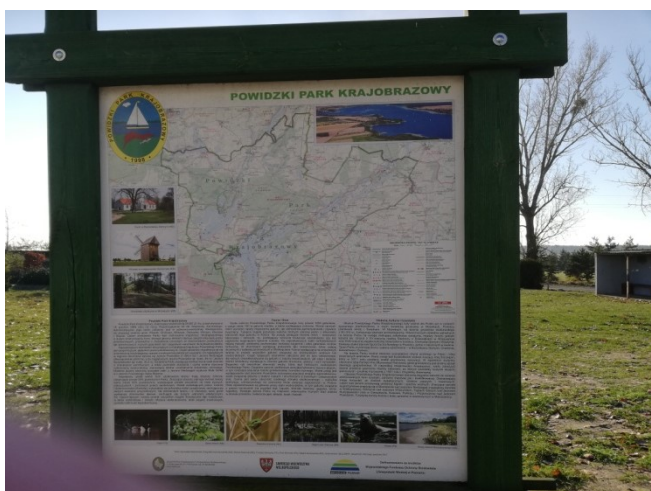
Mapa Powidzkiego Parku Krajobrazowego