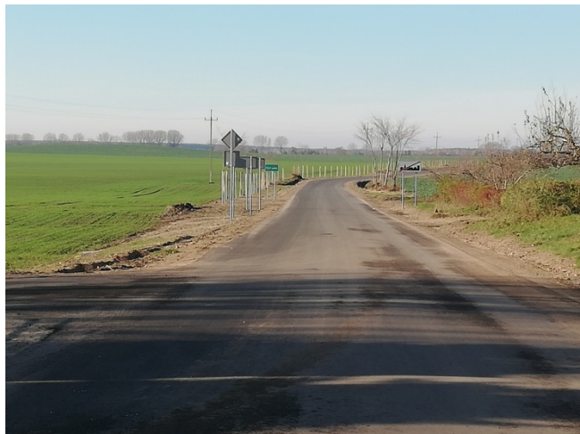
Droga dojazdowa do miejscowości