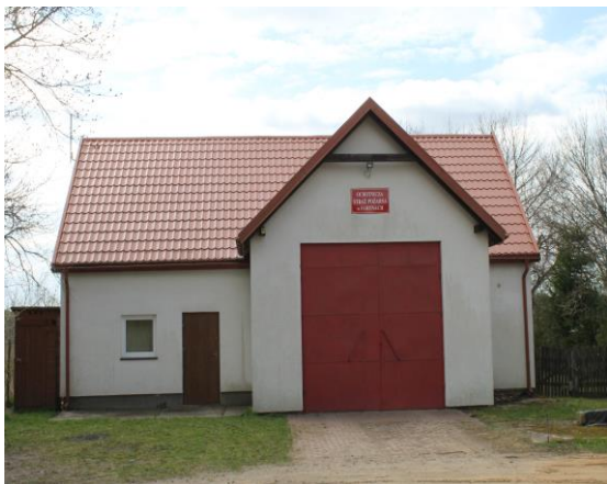
Remiza Ochotniczej Straży Pożarnej