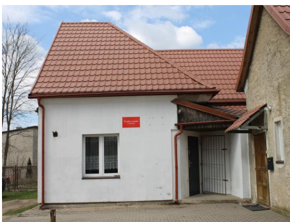
Budynek świetlicy wiejskiej