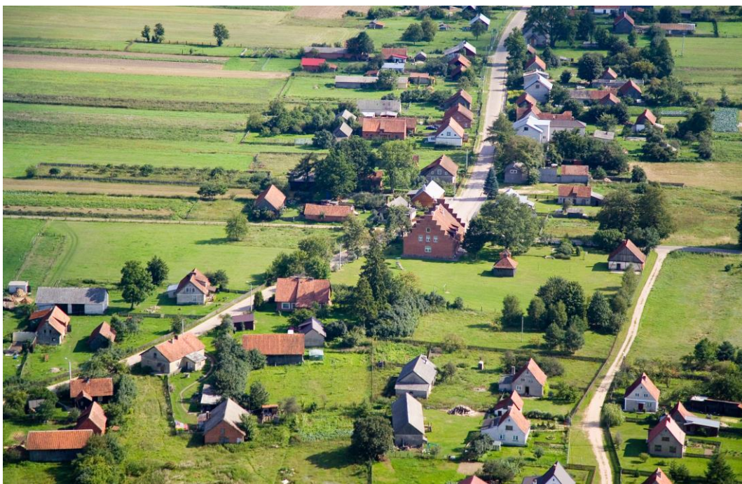
Panorama miejscowości Faryny

Miejscowość Faryny leży w północnej części gminy Rozogi, w powiecie szczycieńskim. Posiada wysokie walory przyrodnicze, otoczone ekosystemami leśnymi Puszczy Piskiej. W niewielkiej odległości na północny – wschód od tej miejscowości przebiega granica obszaru Natura 2000 Ostoja Piska (kod obszaru PLH 280048).