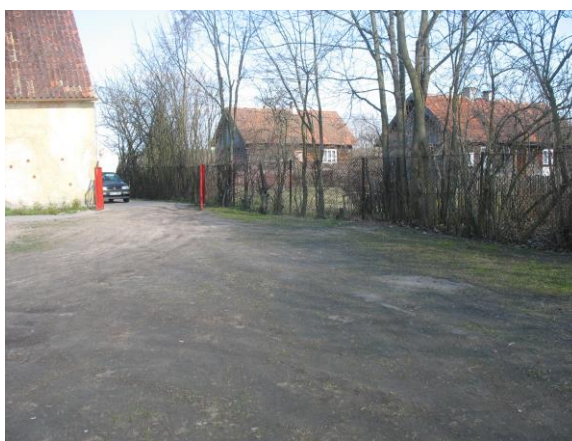
Posesja przed świetlicą i remizą