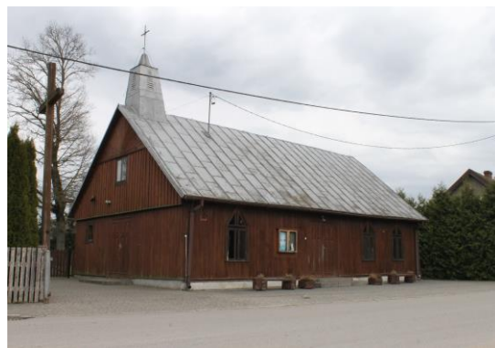
Kościół pw. NMP Królowej Polski