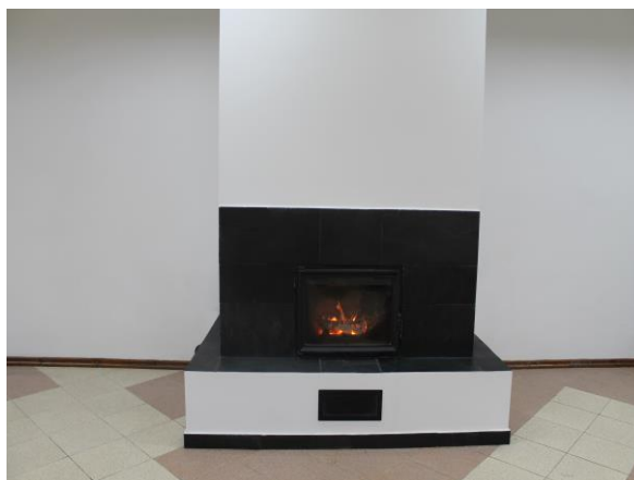
Wnętrze świetlicy wiejskiej