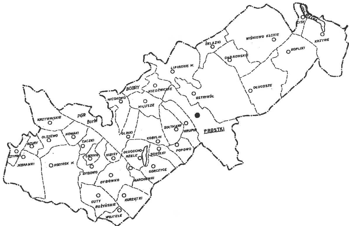
Mapa nr 3 Gmina Prostki

Ludność gminy (jej liczba na dzień 31.12.2004 r. wynosiła 7 812) mieszka w 44 wsiach. Największą miejscowością, pełniącą rolę ośrodka gminnego są Prostki (o liczbie mieszkańców 2508 osób, co stanowi 32% populacji gminy). Wiśniowo Elckie (11% populacji gminy), Bobry, Bogusze, Krupin to następne co do znaczenia miejscowości gminy. Ponadto występuje 17 wsi o liczbie mieszkańców w przedziale 100-200 osób, 10 w przedziale 50-100 oraz 12 miejscowości, w których liczba mieszkańców nie przekracza 50 osób.