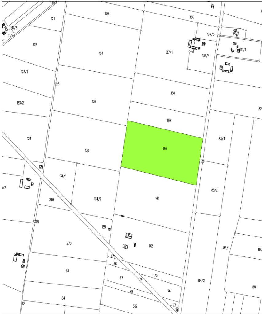
Załącznik nr ... "Targowisko" w Nowym Przybojewie, działka nr 140

Przewodniczący Rady Gminy w Czerwińsku nad Wisłą