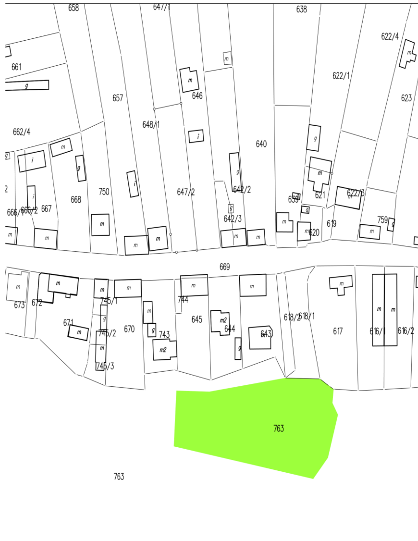
Załącznik nr ... "Bulwar Wiślany" w Czerwińsku nad Wisłą, część działki nr 763

Przewodniczący Rady Gminy W Czerwińsku nad Wisłą Dariusz Szurmak