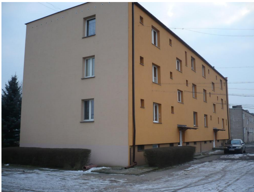
Wielorodzinny budynek mieszkalny – termoizolacja