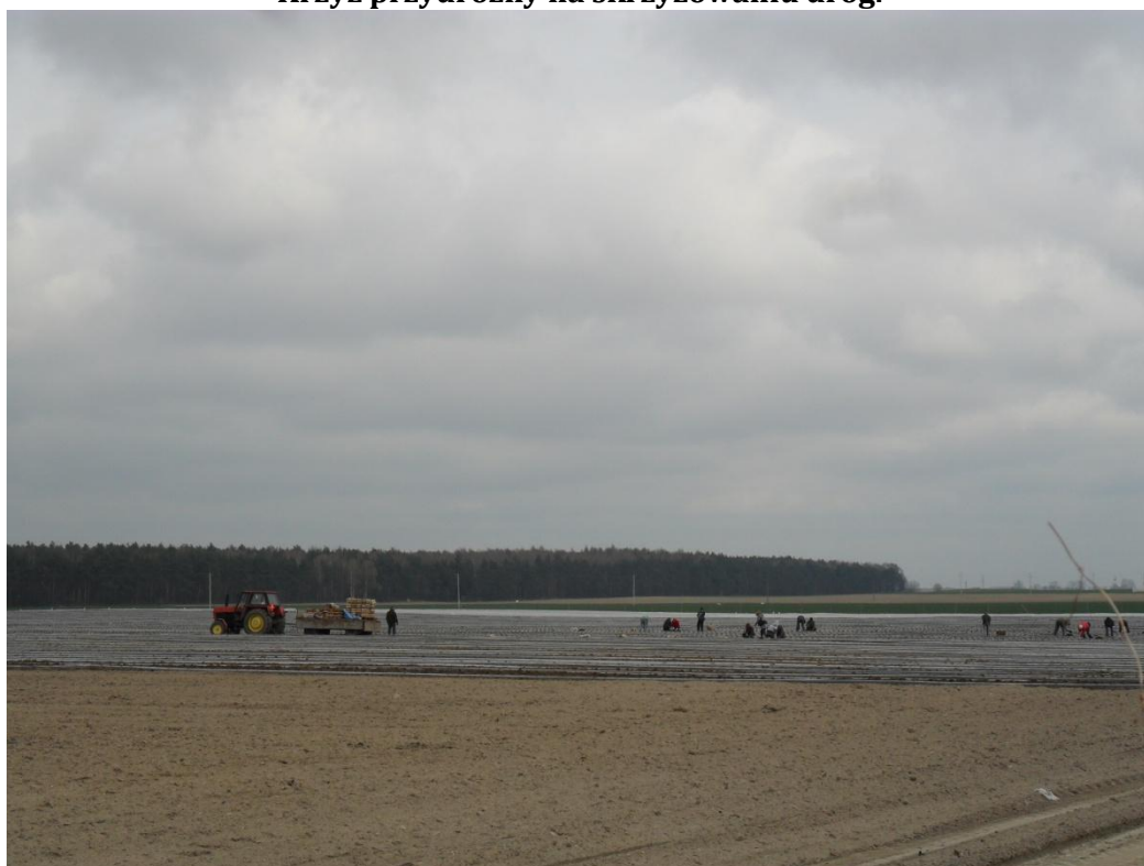
Plantacja truskawek porą wiosenną.