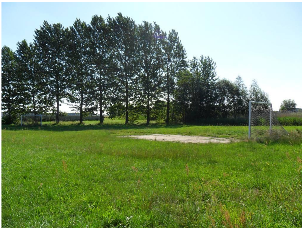
Boisko sportowe położone na gruncie Skarbu Państwa.