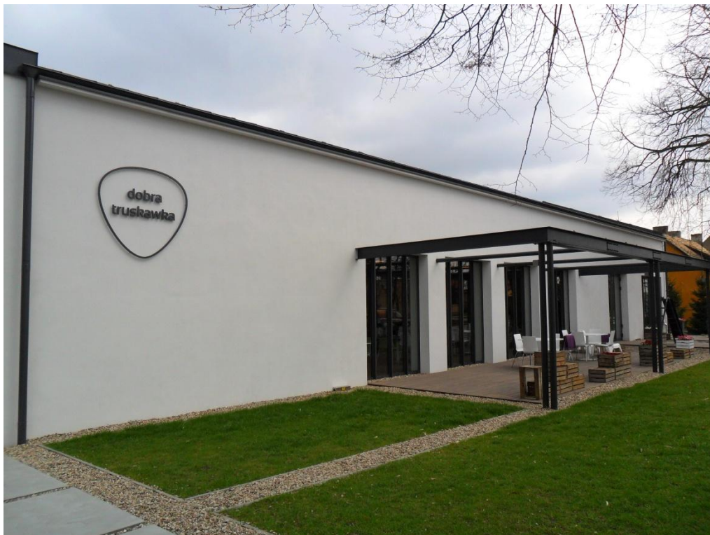
Restauracja „Dobra truskawka” obiekt dawniej wykorzystywany jako świetlica wiejska.