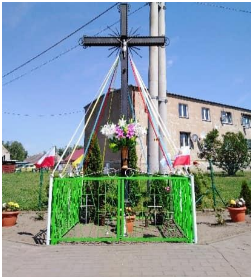
Krzyż przydrożny na skrzyżowaniu dróg.