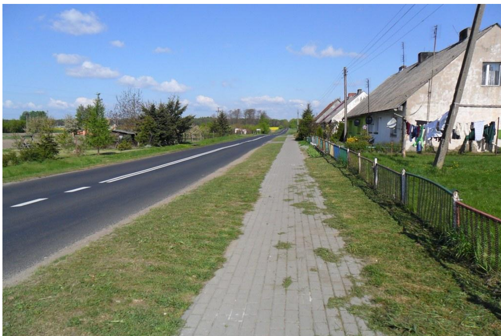
Droga powiatowa nr 1489P biegnąca przez Nowe w kierunku Kamienicy.