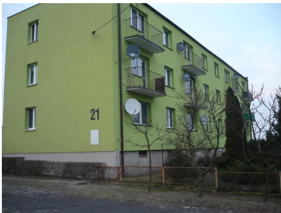
Wielorodzinny budynek mieszkalny – termoizolacja