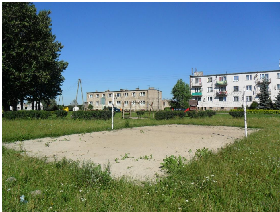
Tereny wykorzystywane przez mieszkańców jako boiska sportowe (położone na gruncie prywatnym)