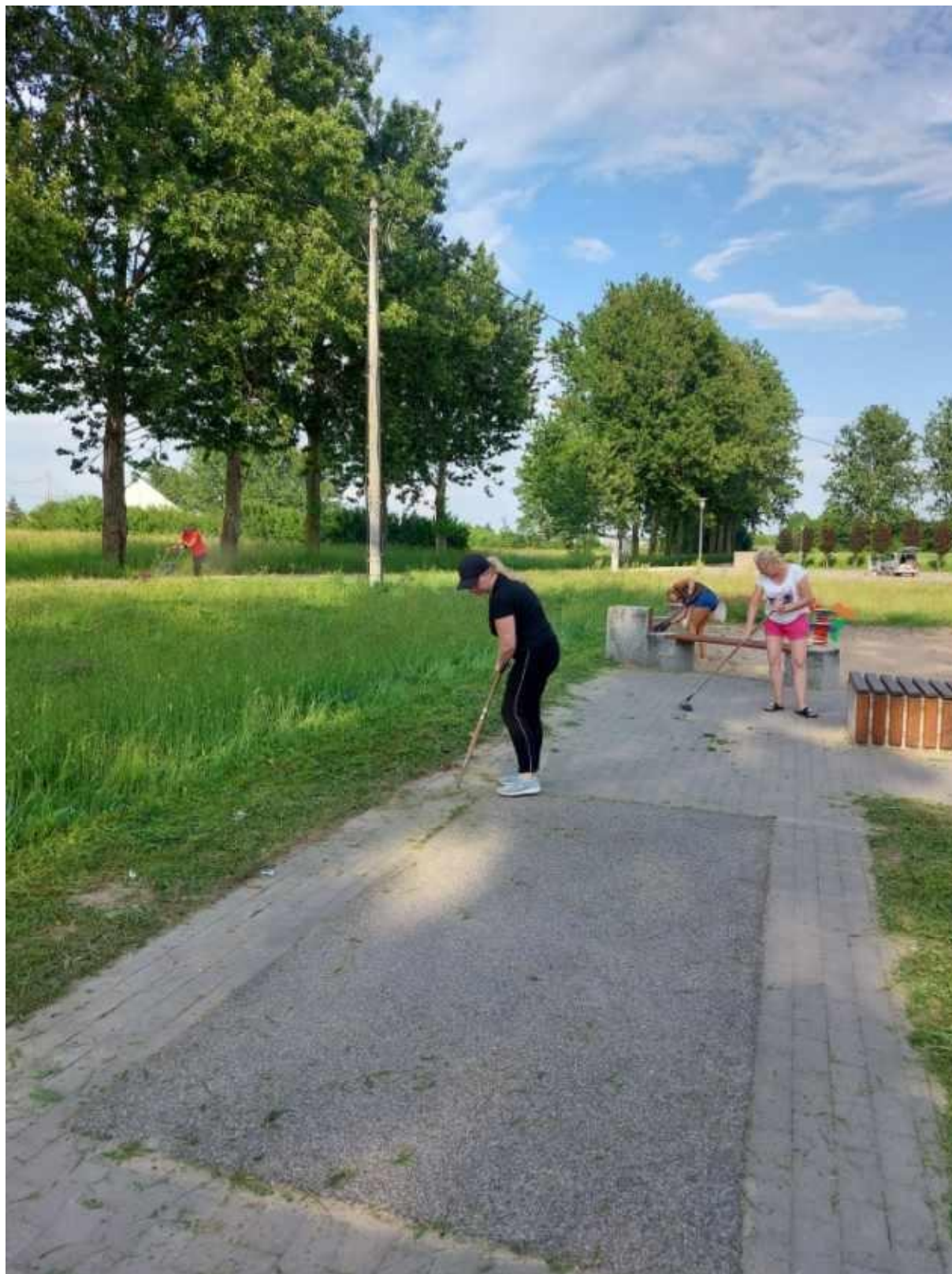
Wspólne inicjatywy społeczne w dbaniu o wieś