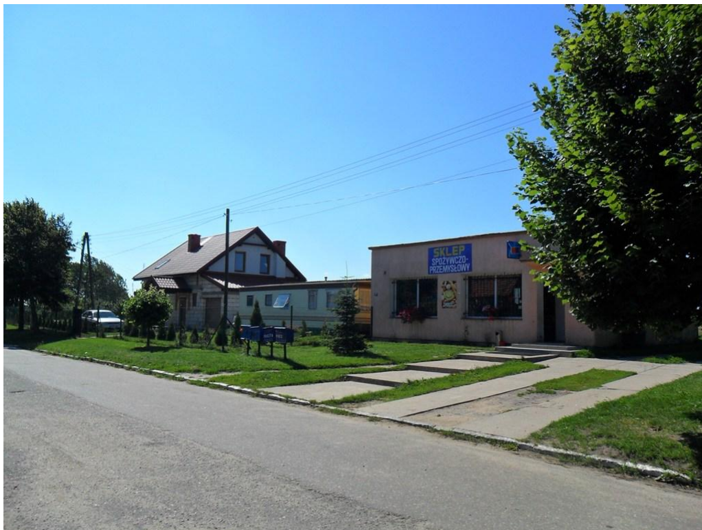
Funkcjonujący we wsi sklep spożywczo – przemysłowy.