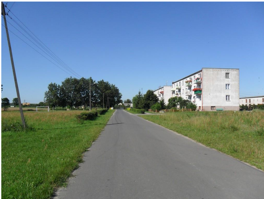
Droga gminna na terenie wsi Nowe.