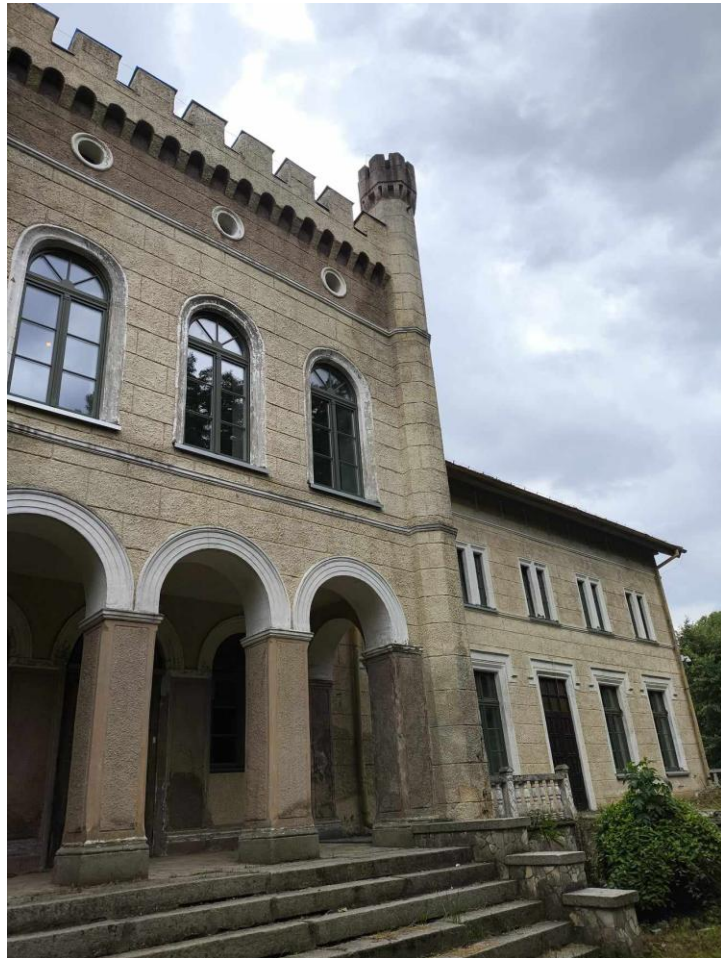
Zdjęcia: Pałac w Wiatrowie