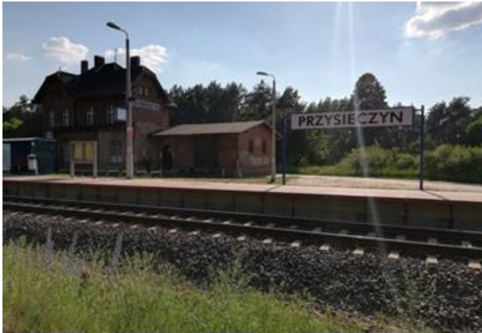
Dom mieszkalny przy dworcu

5. Dworzec kolejowy w Przysieczynie w 1905 r. uzyskał połączenie kolejowe z Wągrowcem i Poznaniem. Linia kolejowa początkowo według projektu miała przebiegać przez Sienno, ale ponieważ tamtejsi rolnicy nie chcieli odsprzedać swej ziemi, dworzec powstał w Przysieczynie. Linia kolejowa i budynek dworca zbudowane zostały w końcu XIX wieku. Przy dworcu znajduje się dom mieszkalny.