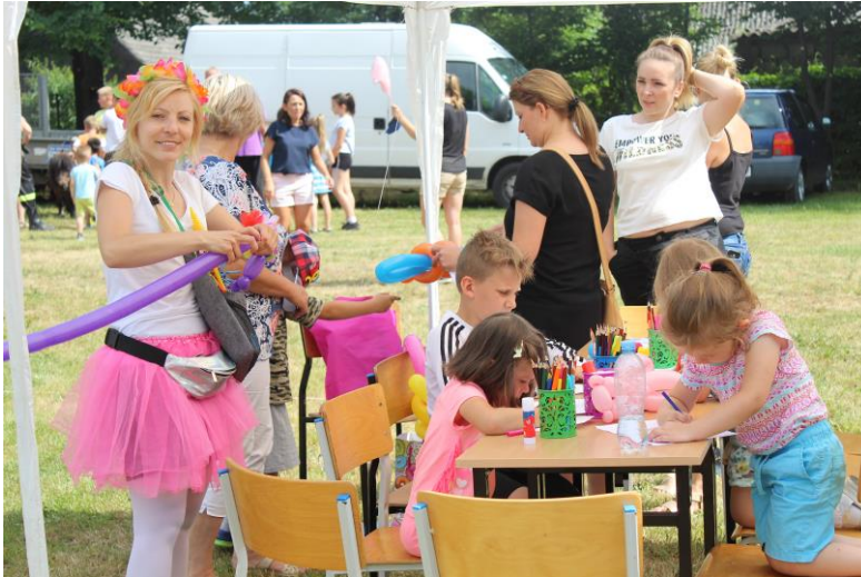
Dzień dziecka w Rąbczynie