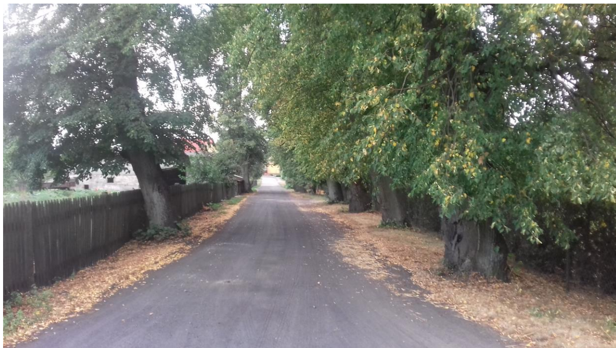
Przebudowywana droga koło szkoły w Rąbczynie