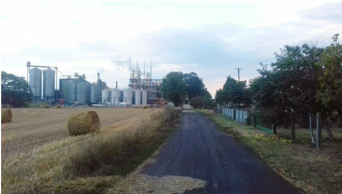
Przebudowywana droga na działkach nr 441 i 415 w Rąbczynie