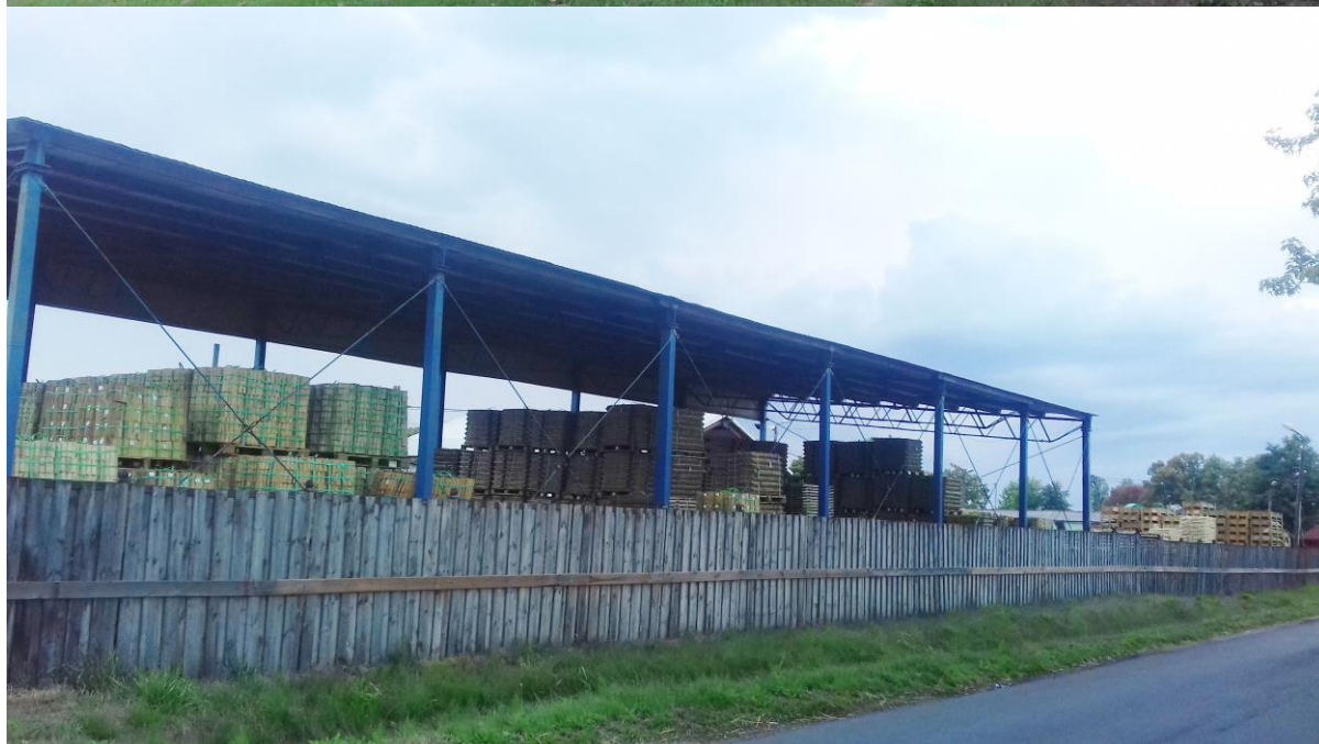
Firma MARTYNA S. A. funkcjonująca w Rąbczynie