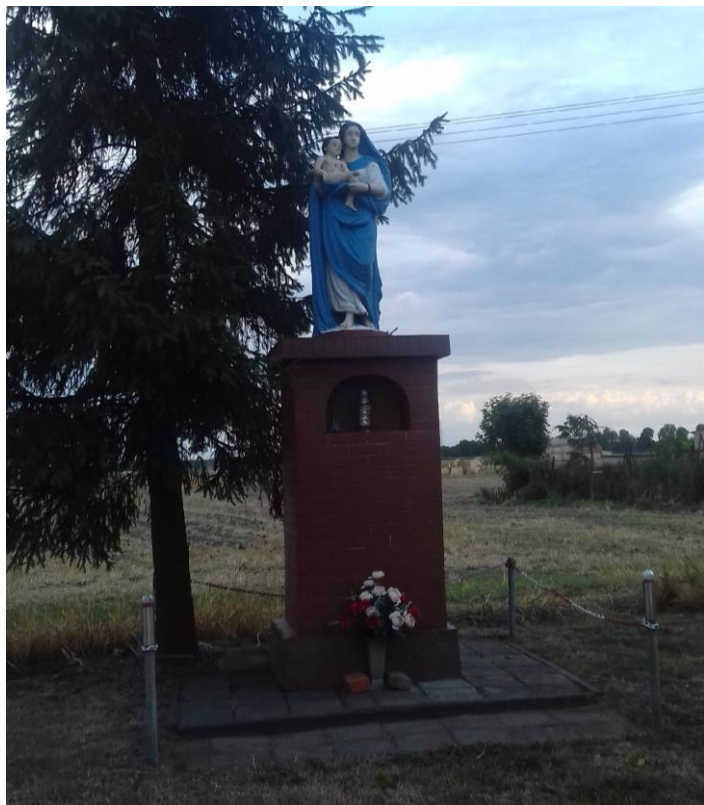
Figura Matki Boskiej z Dzieciątkiem