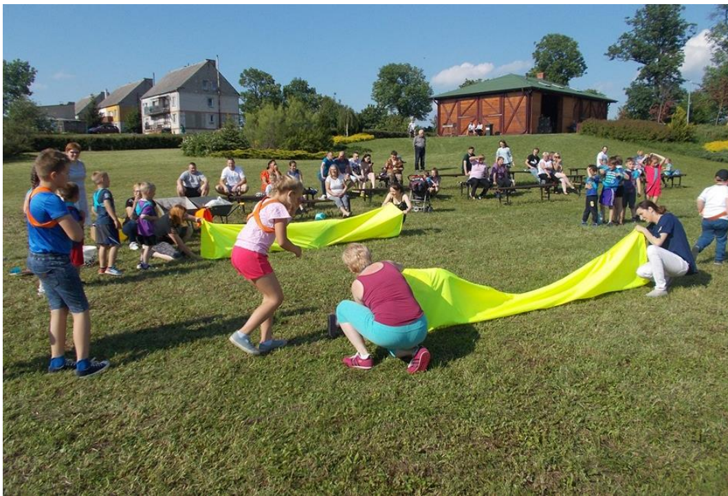
Dzień dziecka w Redgoszcy