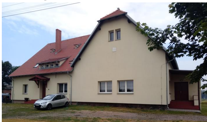
Świątlica wiejska oraz lokale komunalne w Rąbczynie