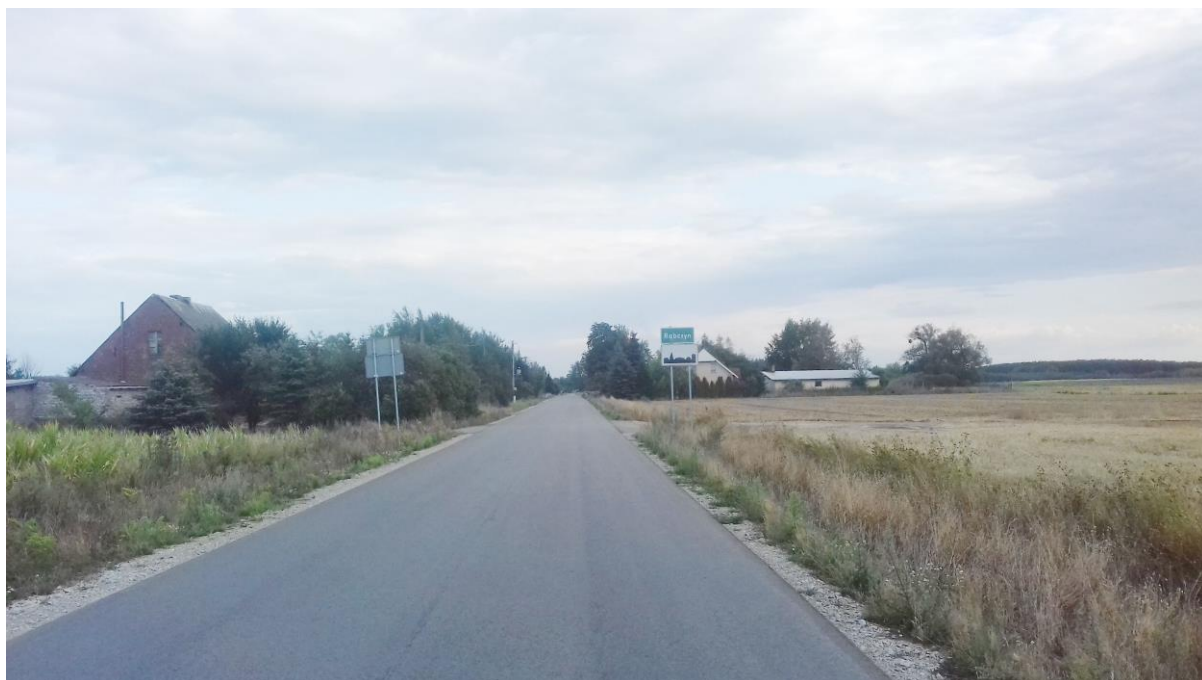
Przebudowana droga powiatowa Rąbczyn-Łekno