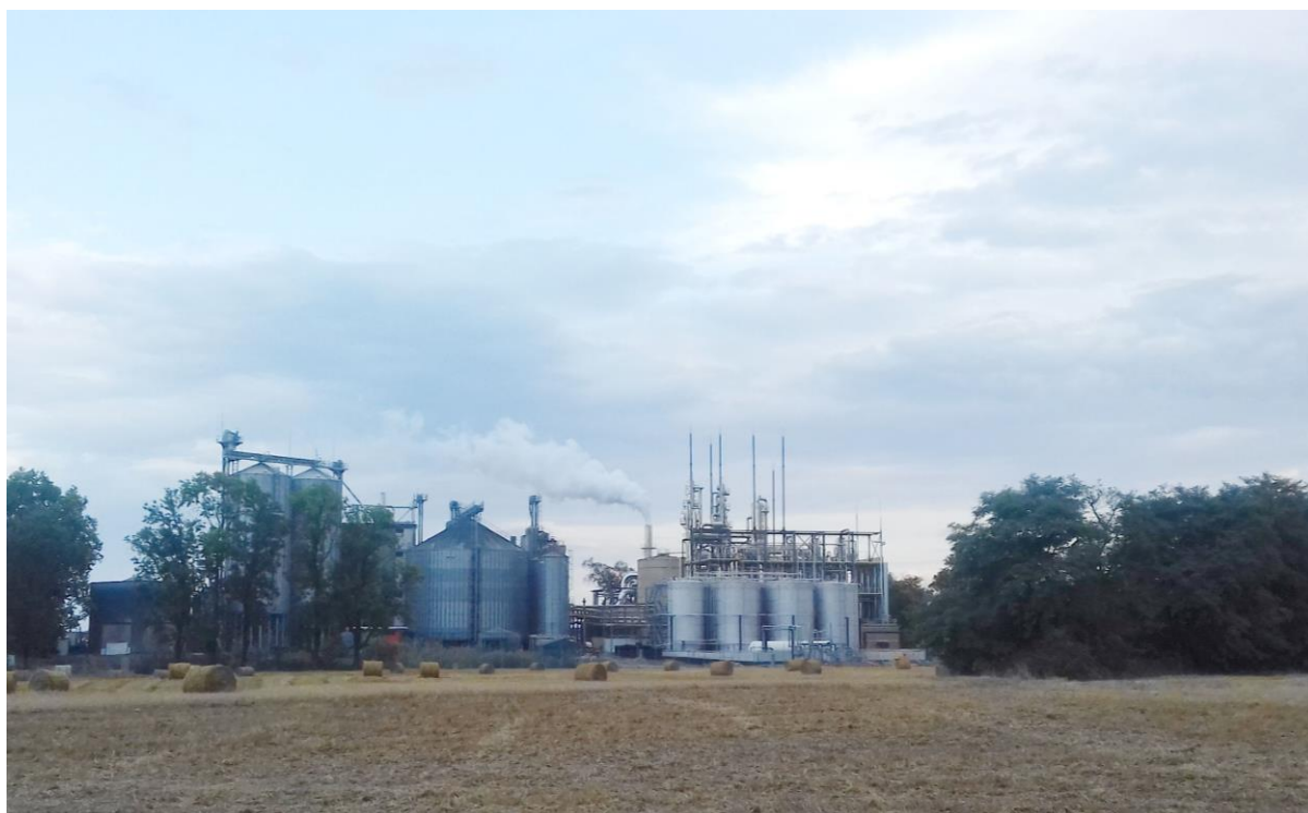
BGW w Rąbczynie