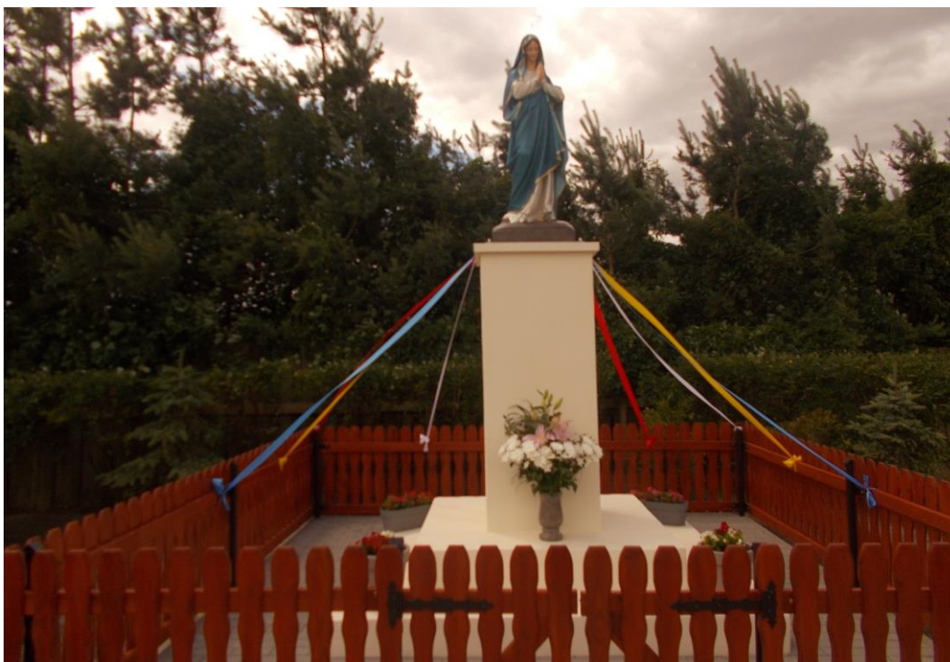
Figurka Matki Boskiej w Redgoszczy