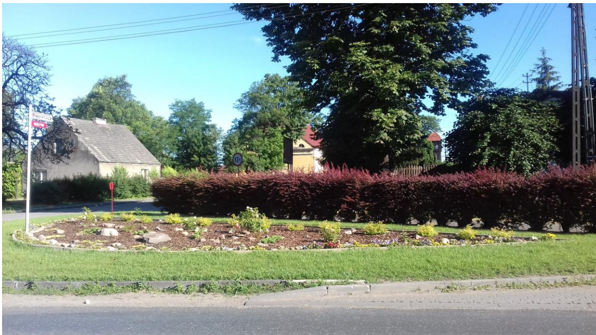
Skwerek w Rąbczynie