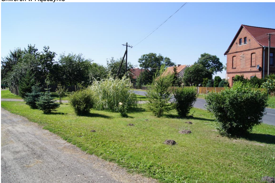
Skwerek przed figurą Matki Boskiej z Dzieciątkiem