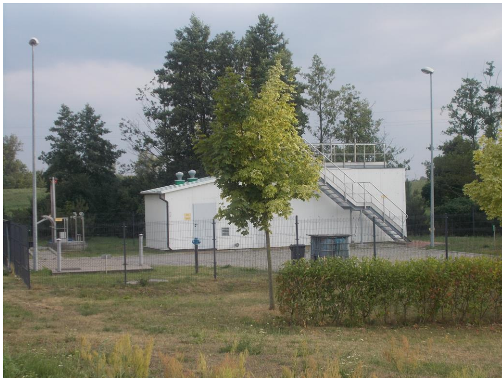
Oczyszczalnia ścieków w Redgoszczy