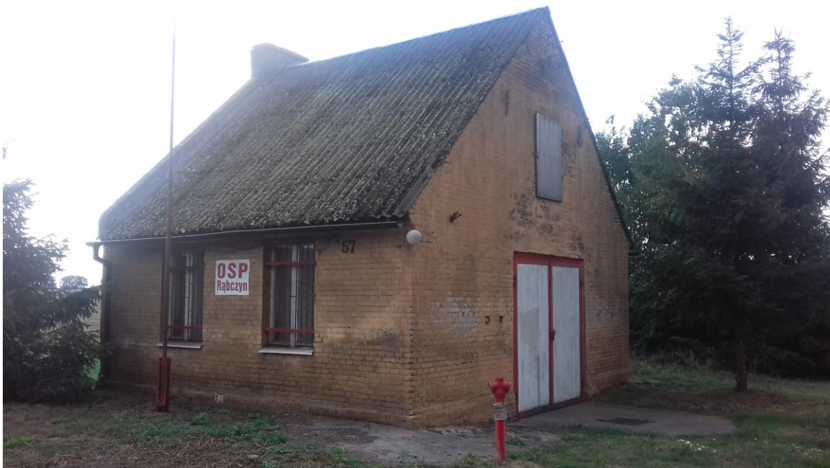
Remiza OSP w Rąbczynie