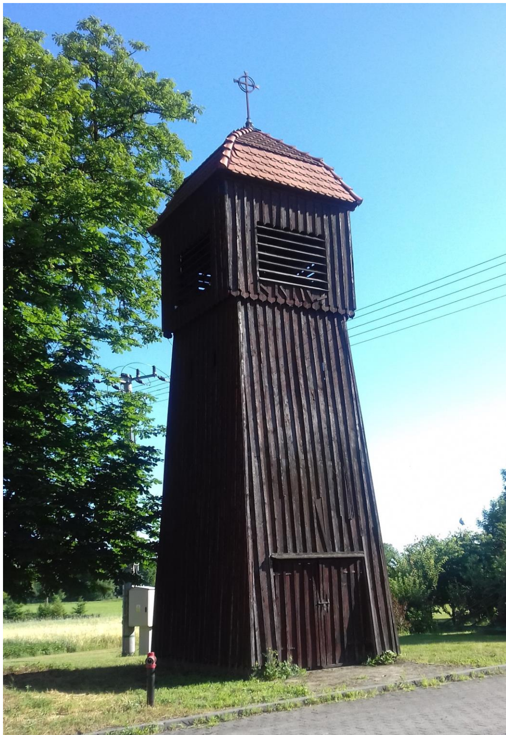
Odrestaurowana przez Gminę Wągrowiec dzwonnica w Rąbczynie