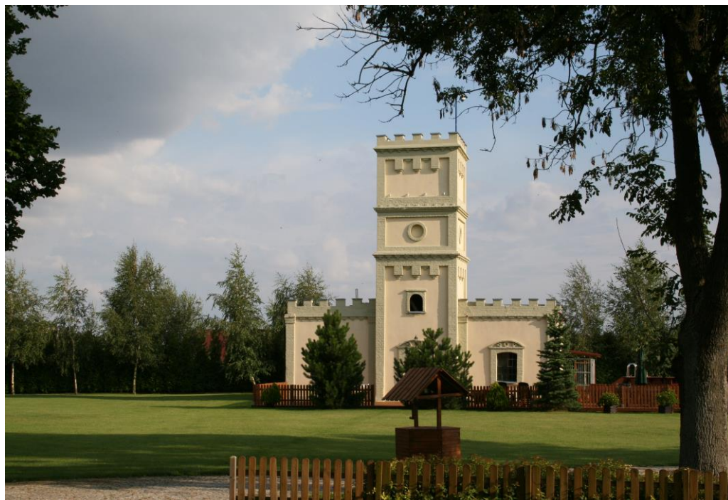
Wieża w Redgoszczy