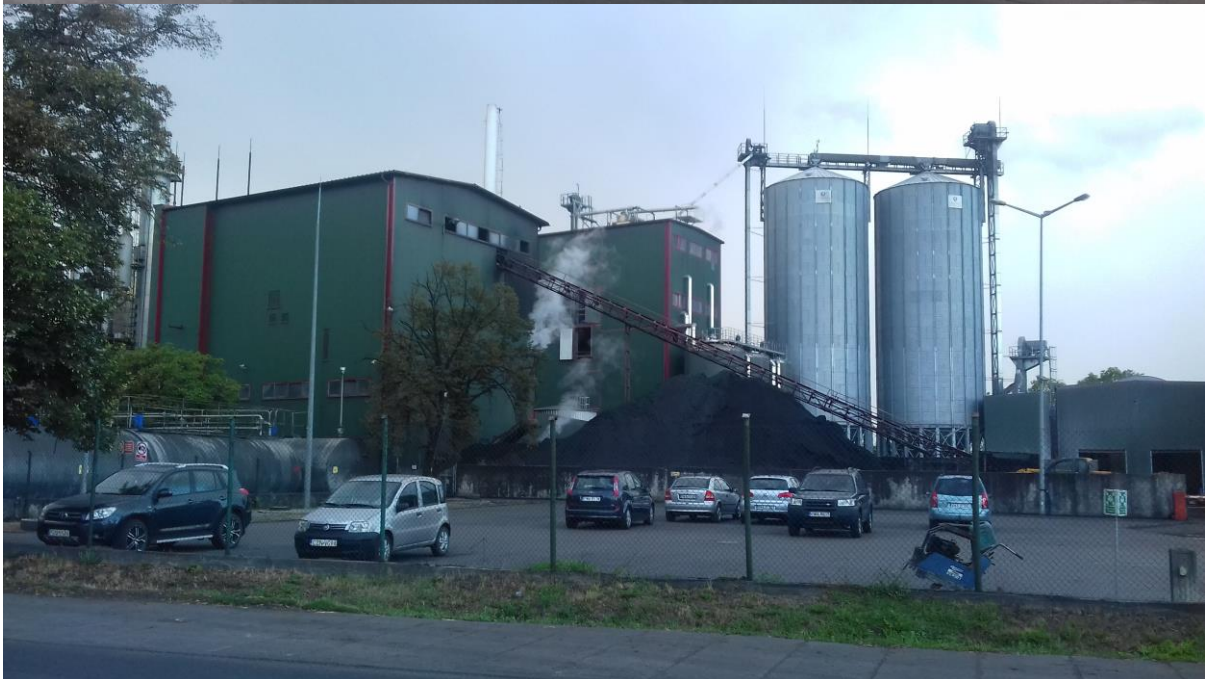
BGW w Rąbczynie