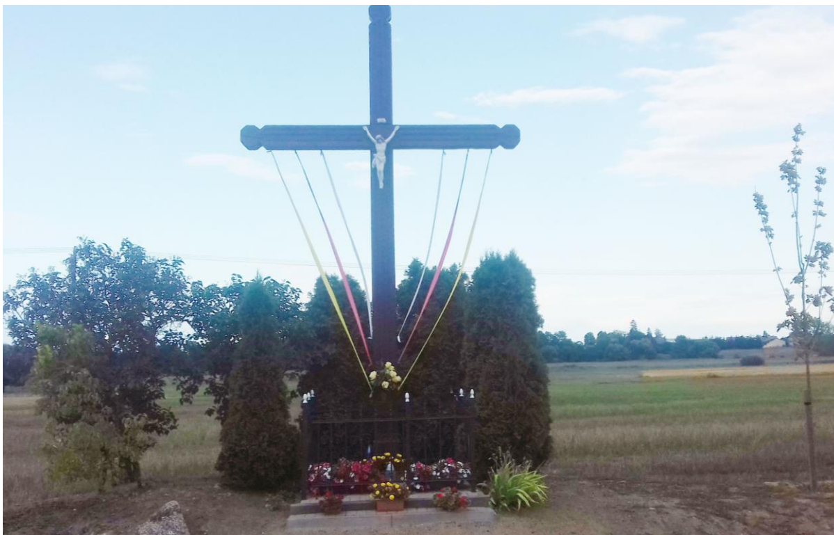
Krzyż w Rąbczynie