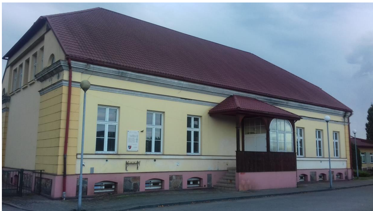
Budynek sali gimnastycznej w Rąbczynie