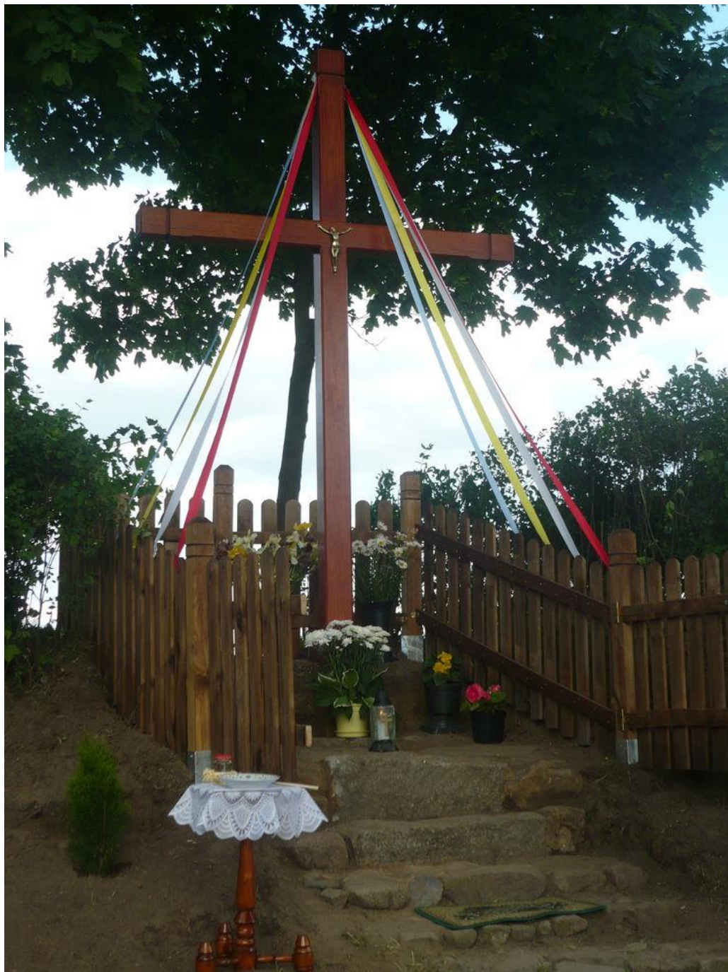
Krzyż w Redgoszczy