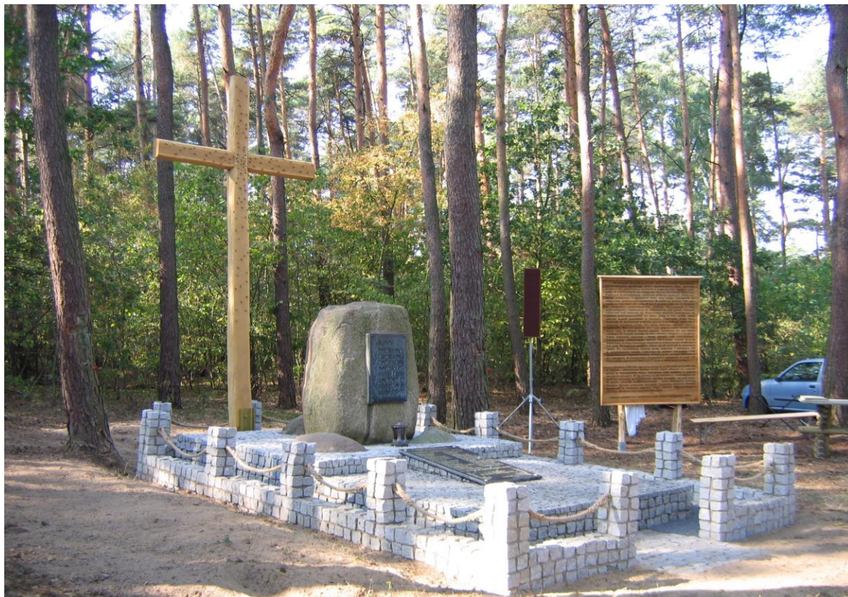
Krzyż i tablica upamiętniająca pomordowanych przez hitlerowców 107 Polaków w tym Jana Owoca znajdujące się w bukowieckim lesie