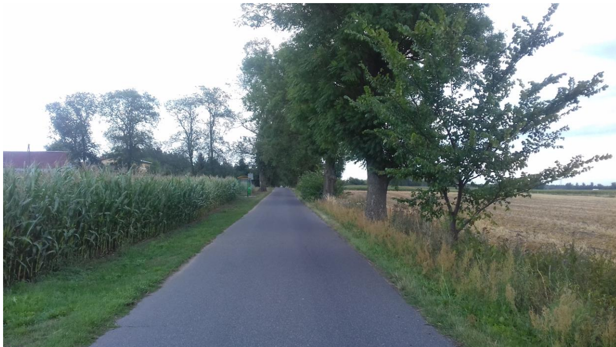
Droga do „Augustynowa”