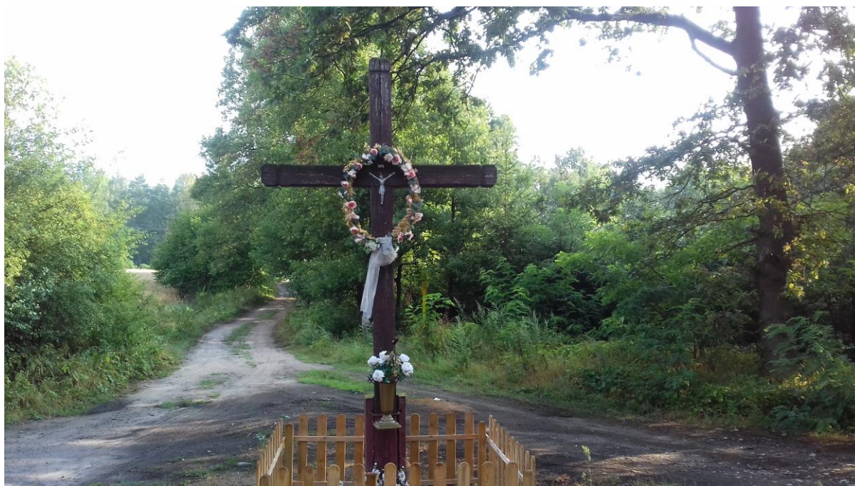
Krzyż w Nowej Wsi