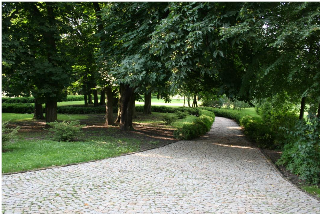
Park w Redgoszczy