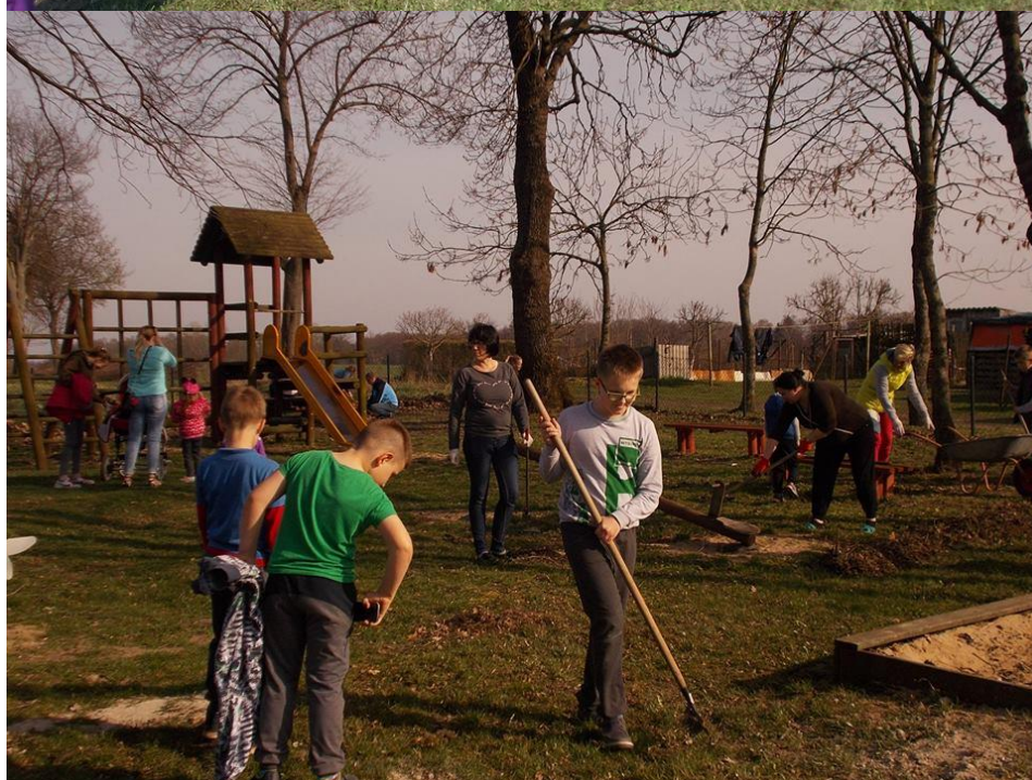
Sprzątanie placu zabaw w Redgoszczy