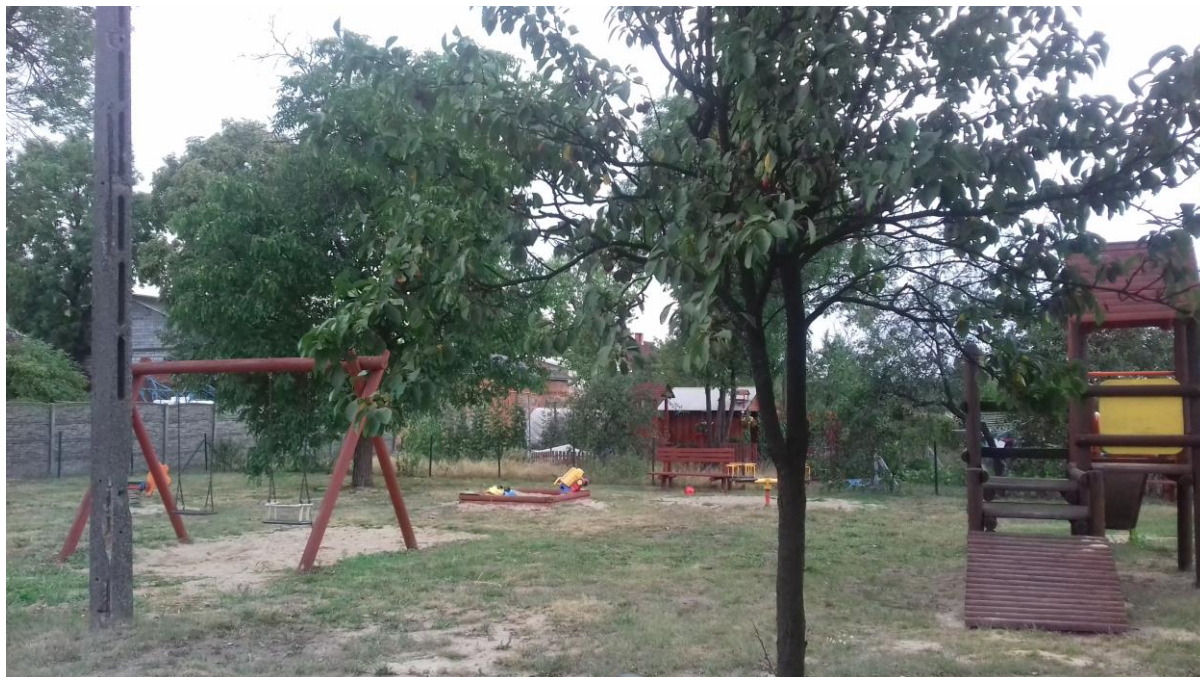
Plac zabaw w Rąbczynie