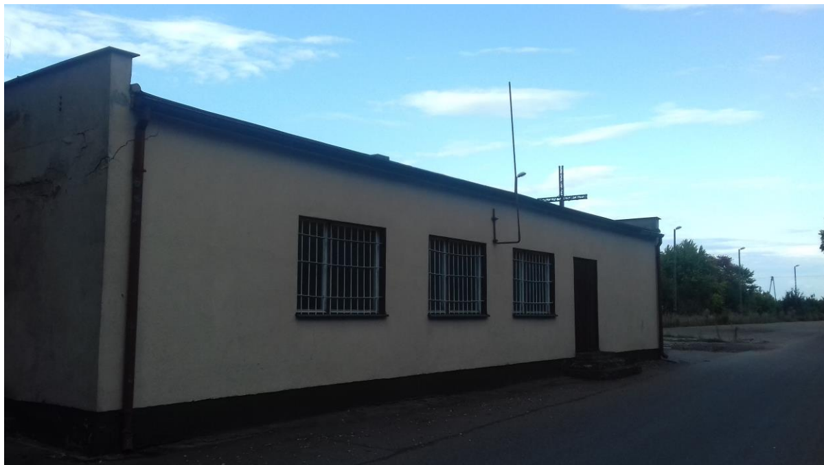
Kaplica w Rąbczynie