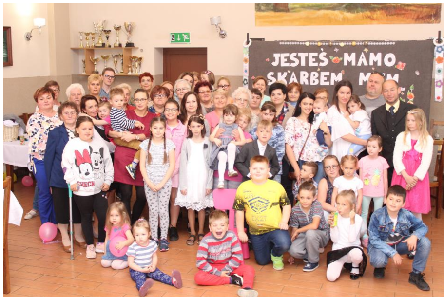
Dzień matki w Rąbczynie