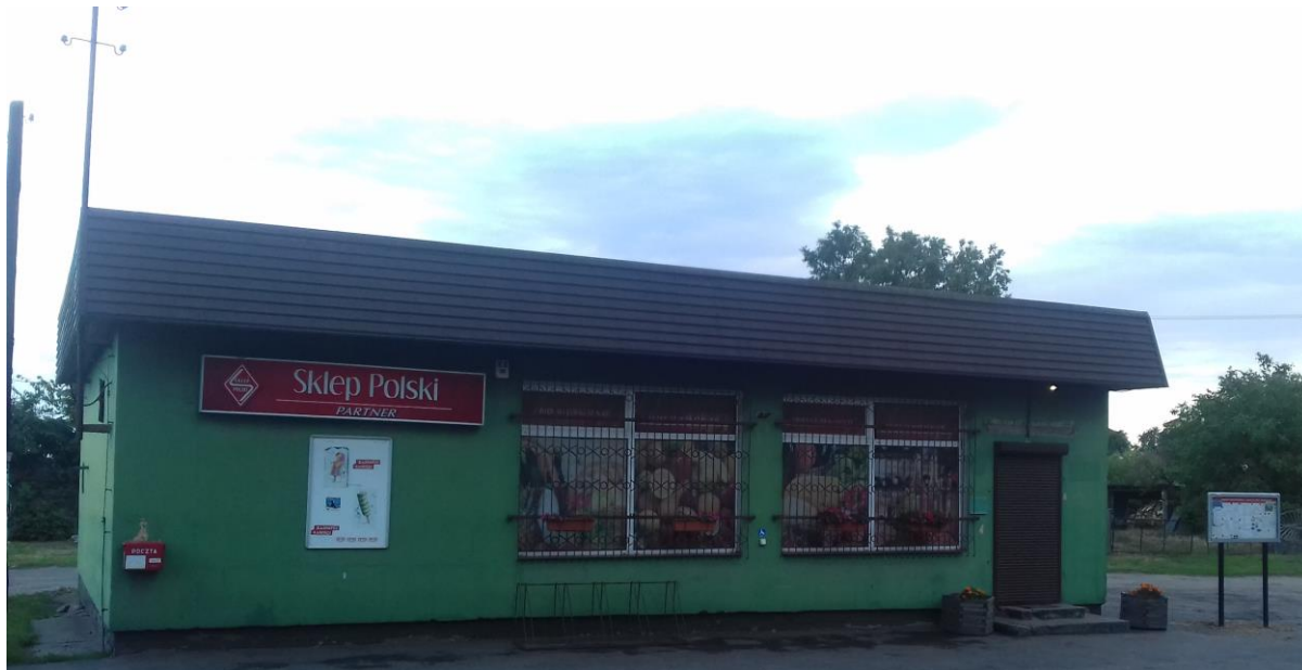
Sklep Polski w Rąbczynie