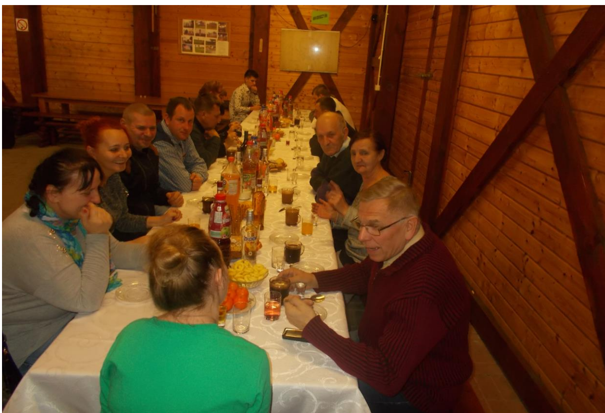
Andrzejki w Redgoszcy