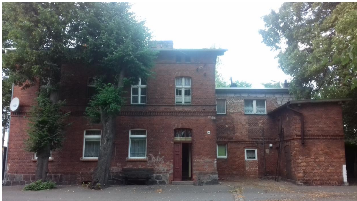
Budynek PKP w Rąbczynie