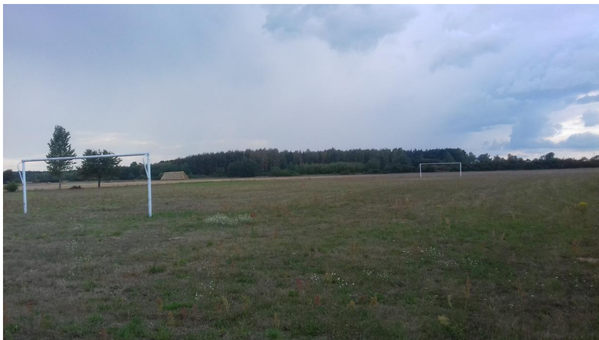
Boisko w Rąbczynie