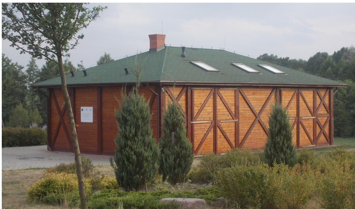
Wigwam w Redgoszczy