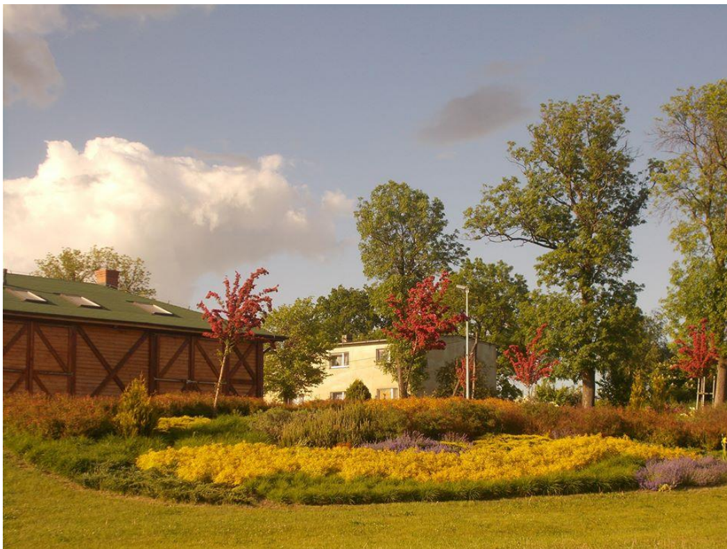
Wigwam wraz z zagospodarowaniem zieleni w Redgoszczy