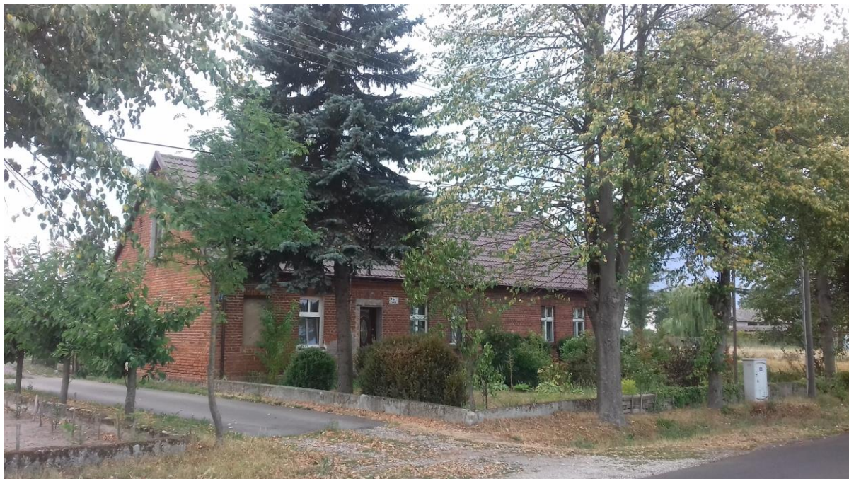
Prywatny dom służący od lat 60-tych przez wiele lat za kaplicę w Rąbczynie