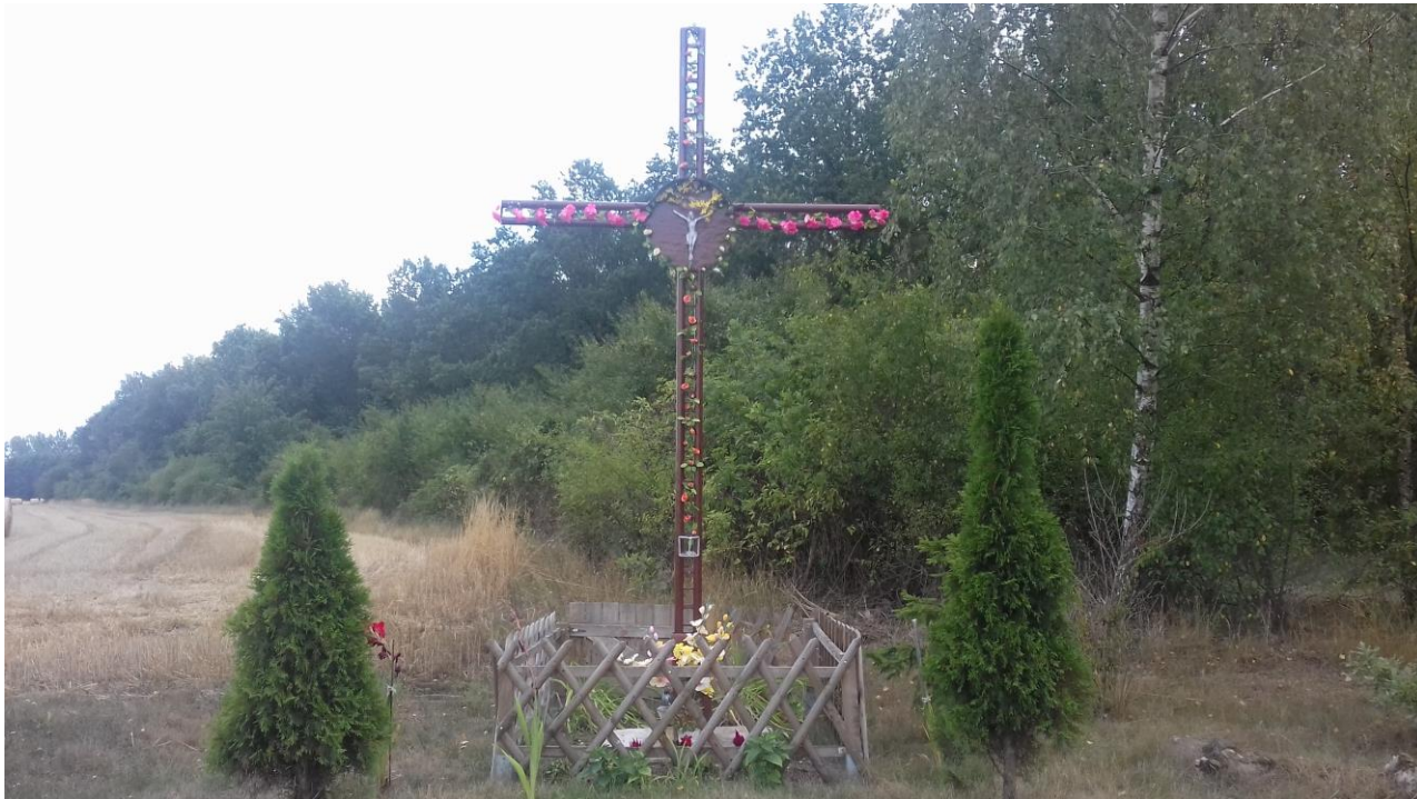
Krzyż Rąbczyn – Augustynowo