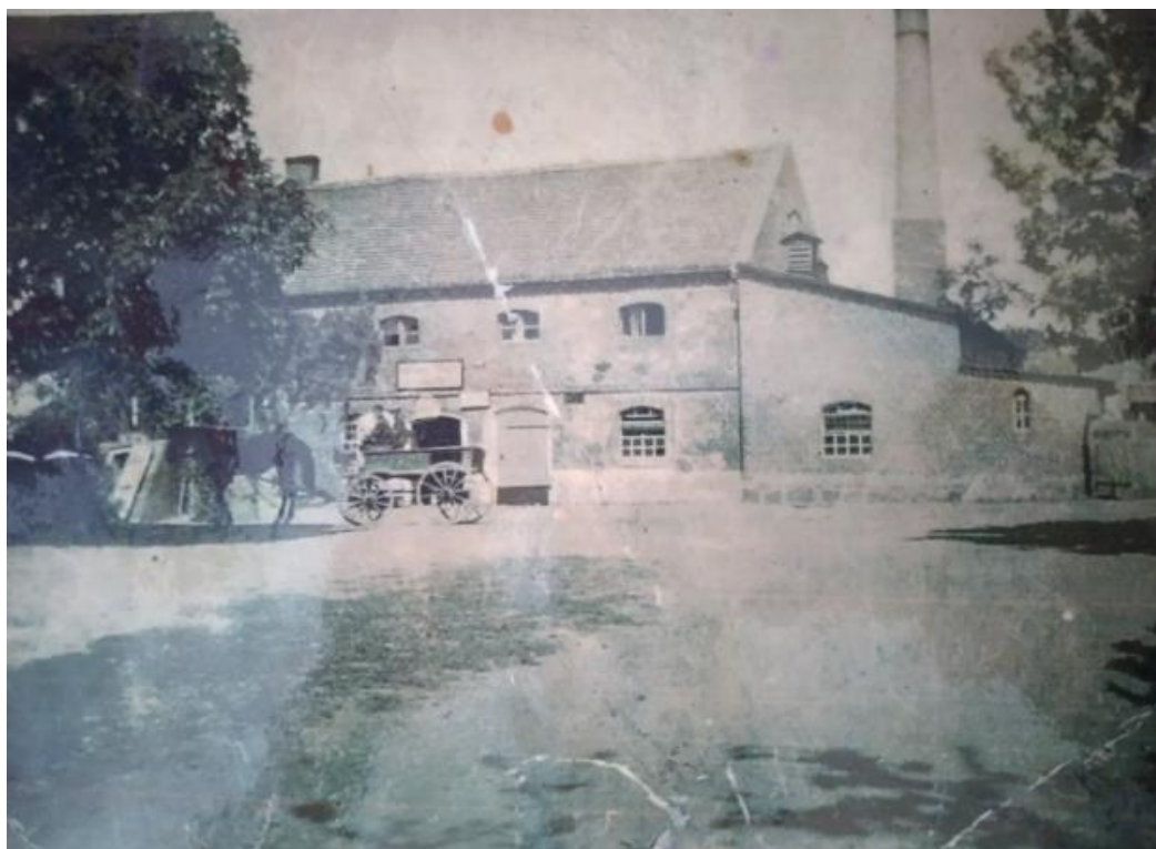
Budynek mleczarni w Rąbczynie – zdjęcie z około 1950 r.