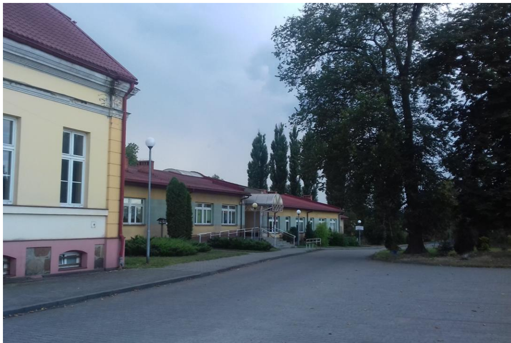
Oddany do użytku w 1999 r. budynek szkoły w Rąbczynie