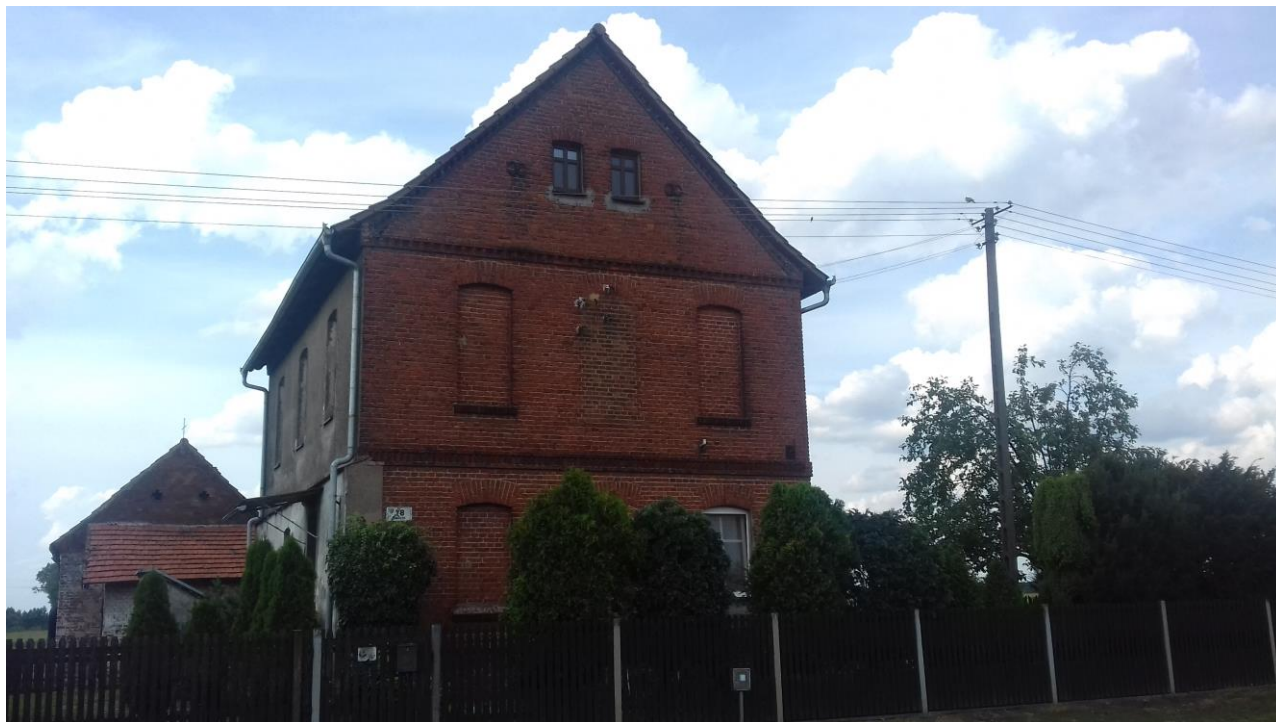
Charakterystyczny budynek w Rąbczynie