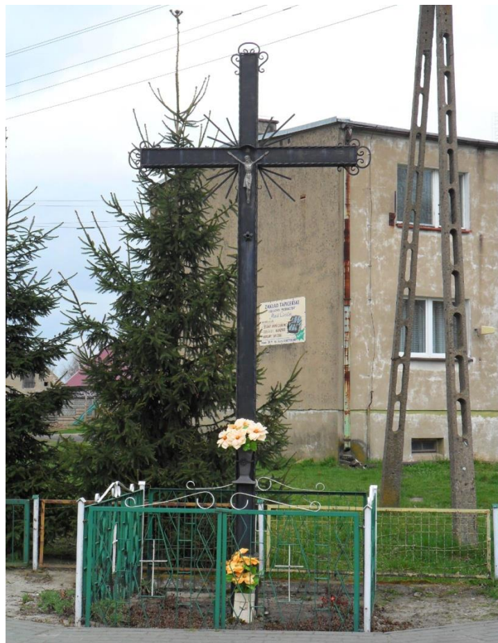
Krzyż przydrożny na skrzyżowaniu dróg.