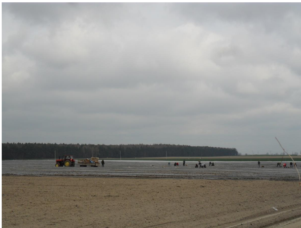
Plantacja truskawek porą wiosenną.