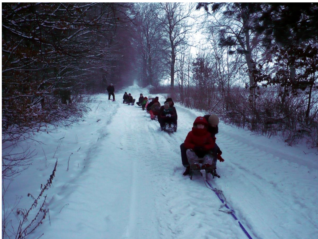
Dłuuugi radosny kulig.