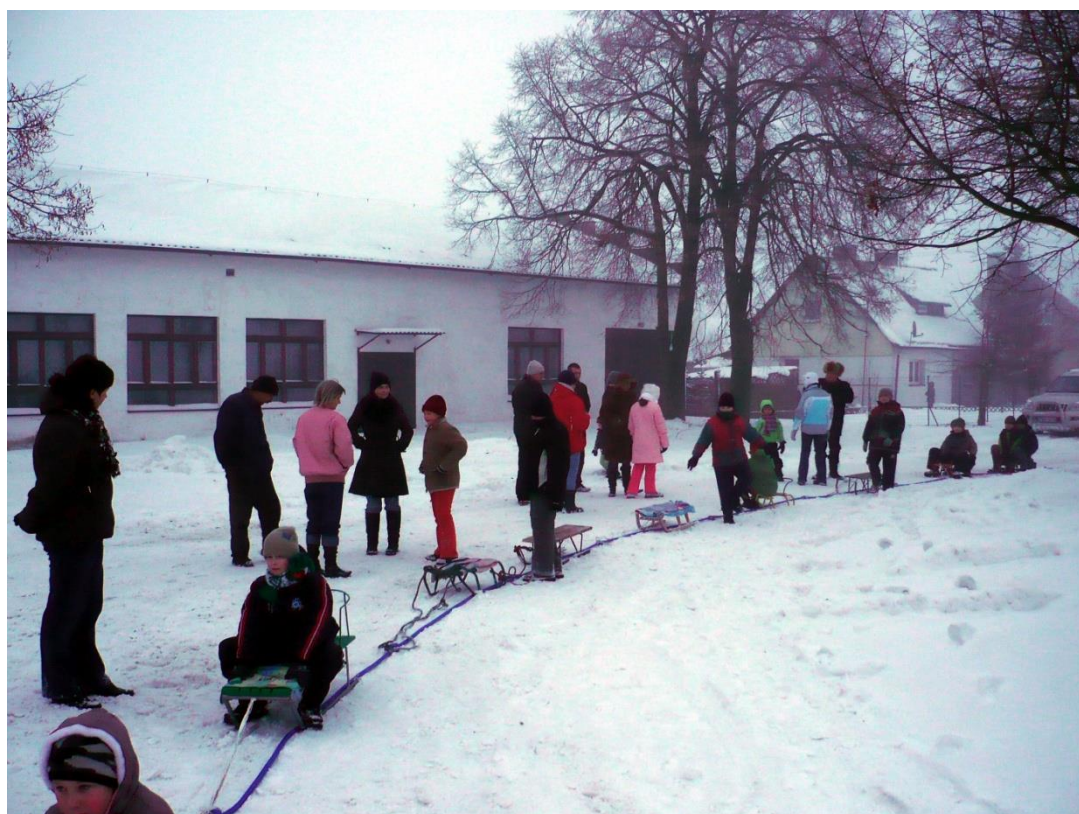
Zima- czas zabawy na śniegu.