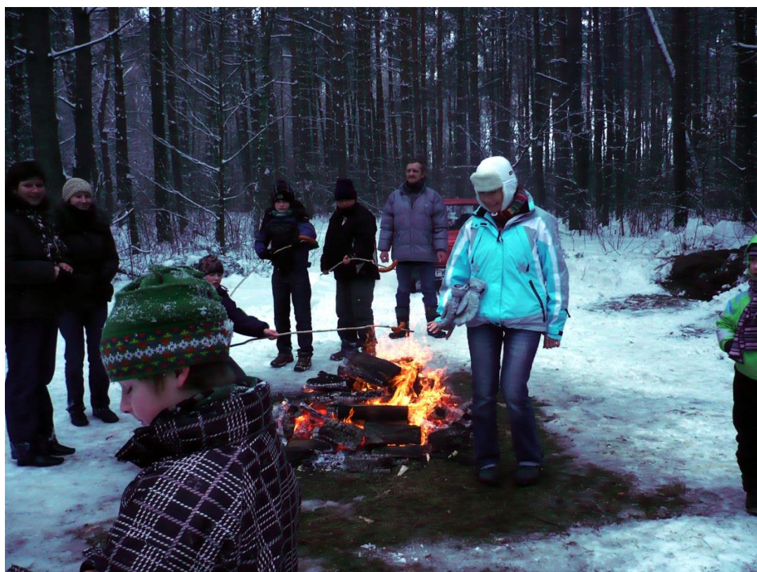
A po kuligu trzeba się rozgrzać i posilić.