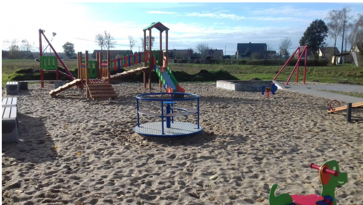
Nowo wybudowany plac zabaw.