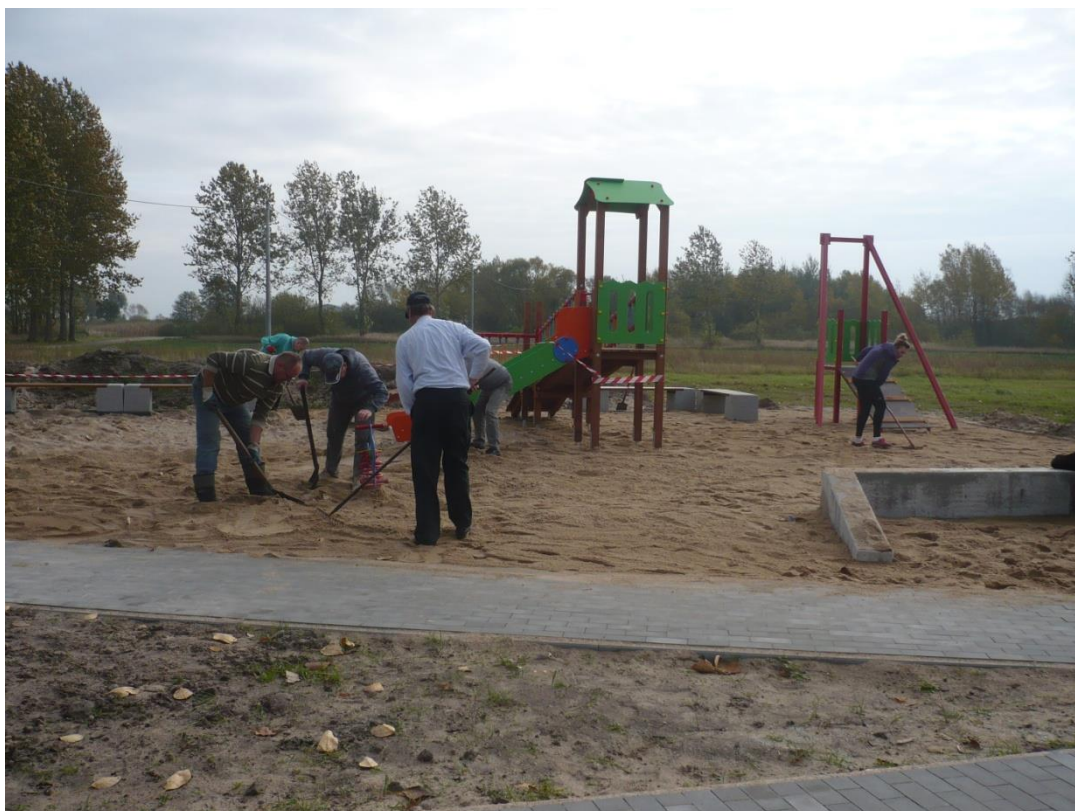
Udział mieszkańców przy budowie placu zabaw.