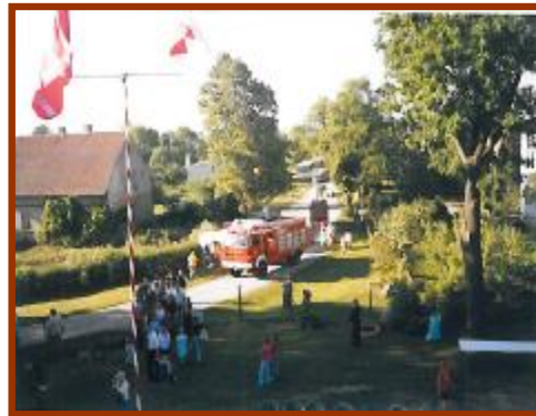
Obchody 90-lecia OSP Werkowo