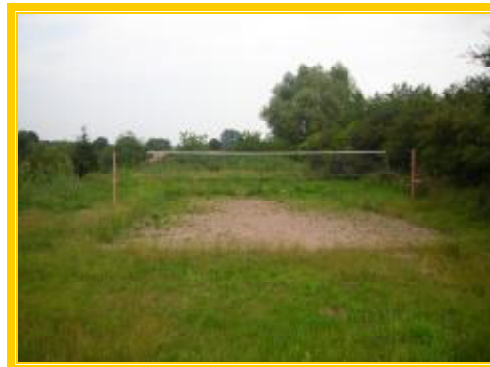
Boisko do piłki siatkowej

Mieszkańcy Werkowa integrują się pod wodzą sołtysa i rady sołeckiej podczas organizowania Dnia Dziecka, Dnia Kobiet i innych uroczystości. Niewątpliwie huczne obchodzenie tych świąt stało się już tradycją naszej wsi. Co roku w obchodach Dnia Dziecka bierze udział około sto dzieci. W przygotowywaniu włącza się wielu mieszkańców, których chętnie wspierają sponsorzy. Organizatorzy sami przygotowują posiłki i miejsce zabaw.