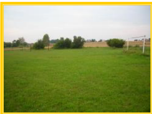
Boisko do piłki nożnej