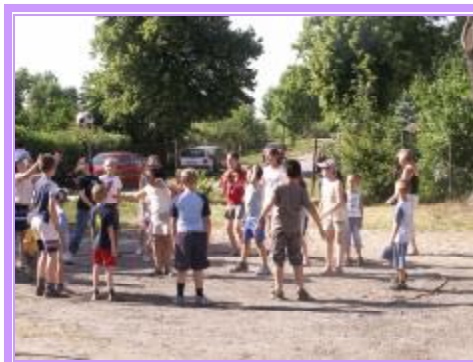
Dzień Dziecka – Werkowo 2011r.

Życie mieszkańców Werkowa związane jest z przyrodą, dlatego też naszym drogocennym zasobem jest środowisko naturalne. Naszym obowiązkiem jest więc podejmowanie działań na rzecz jego odnowy i ochrony przed dewastacją. Wyrazem dbałości o nasze środowisko jest powstanie „Śródpolnej remizy dla zwierząt w Werkowie” wraz z punktem edukacyjnym.