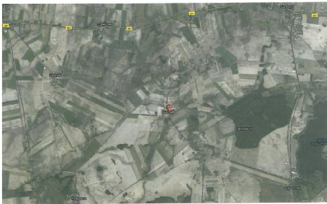
Rzut satelitarny na lokalizację miejscowości Werkowo

Ponadto zarejestrowanych jest 16 działek o powierzchni poniżej 1 ha, które ze względu na zbyt małą powierzchnię, nie mają statusu gospodarstwa rolnego.