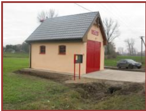
Remiza OSP Werkowo

Ochotnicza Straż Pożarna, niewątpliwie stanowi dumę naszej wsi, co staramy się okazać m.in. organizując huczne jubileusze jej powstania. W bieżącym roku czeka nas wielkie święto jakim będą obchody 100-lecia OSP Werkowo.