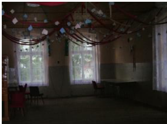
Pałac Weroniki - tu koncentrujemy swoje życie społeczno - kulturalne