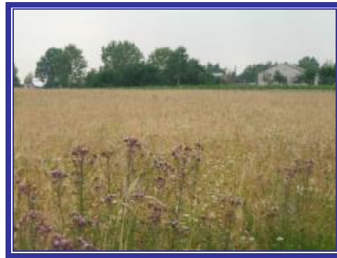
Krajobraz wsi Werkowo

Nasza wieś położona jest na środkowo - wschodniej granicy Gminy Wągrowiec i sąsiaduje z Gminą Damasławek oraz z Gminą Mieścisko. Werkowo rozciąga się wzdłuż drogi powiatowej, na odcinku zajmującym ok. 5 km i zewsząd otoczona jest polami uprawnymi. Na ok. 700 ha, które zajmuje nasza miejscowość, ok. 630 ha to grunty orne. Wieś zachowała więc swój rolniczy charakter.