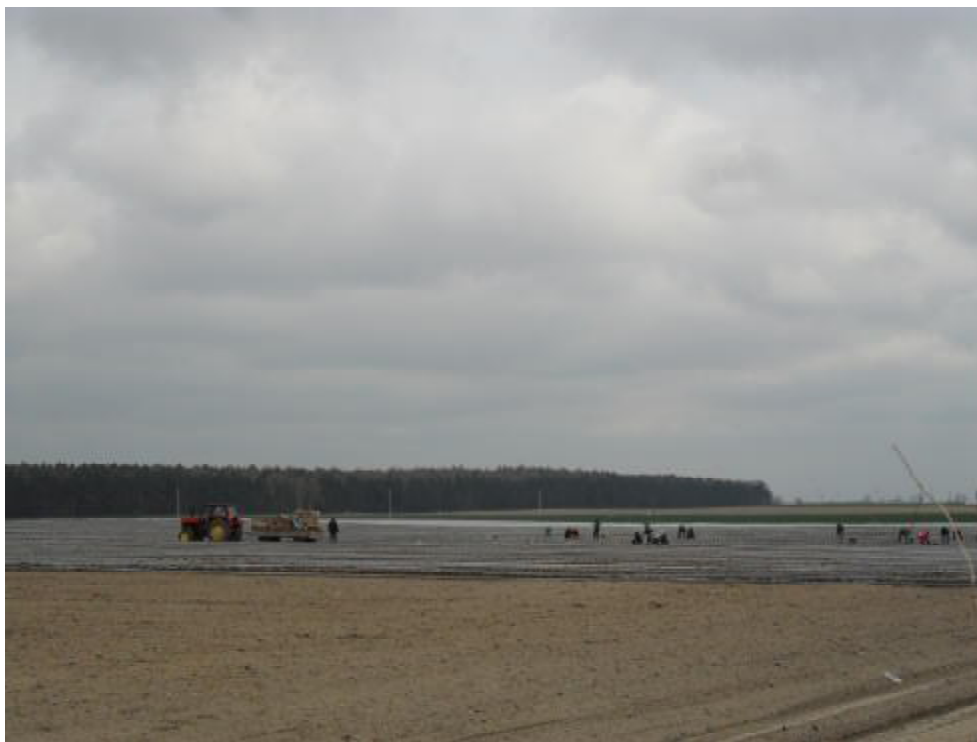
Plantacja truskawek porą wiosenną.