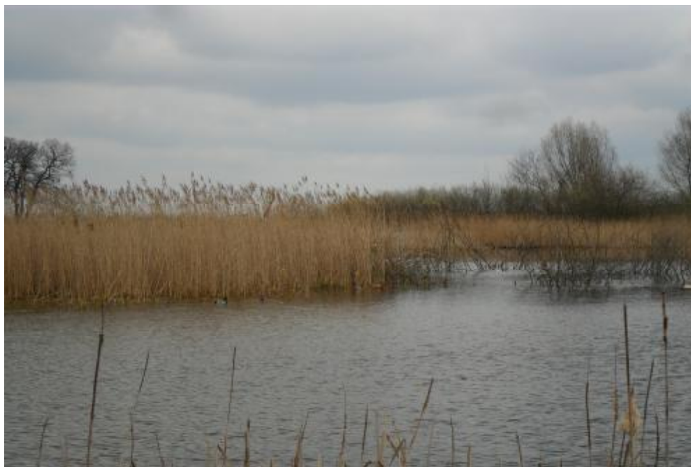
Staw gminny położony na działce nr 56.