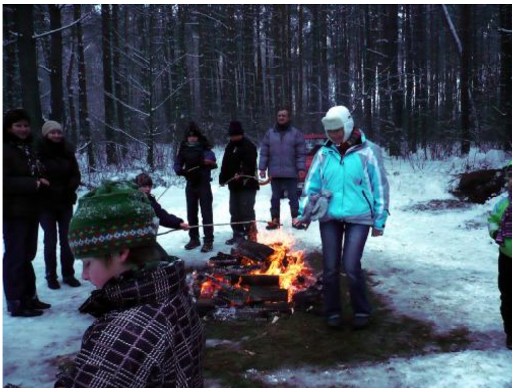
A po kuligu trzeba się rozgrzać i posilić.