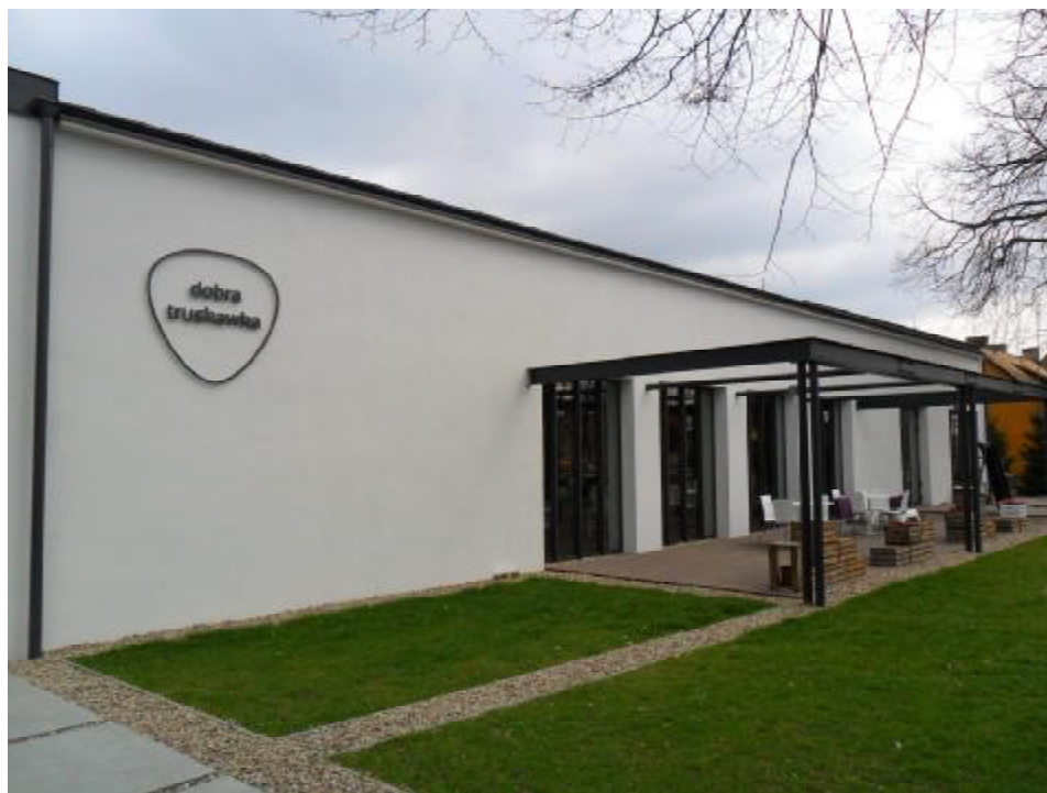
Restauracja „Dobra truskawka” obiekt dawniej wykorzystywany jako świetlica wiejska.