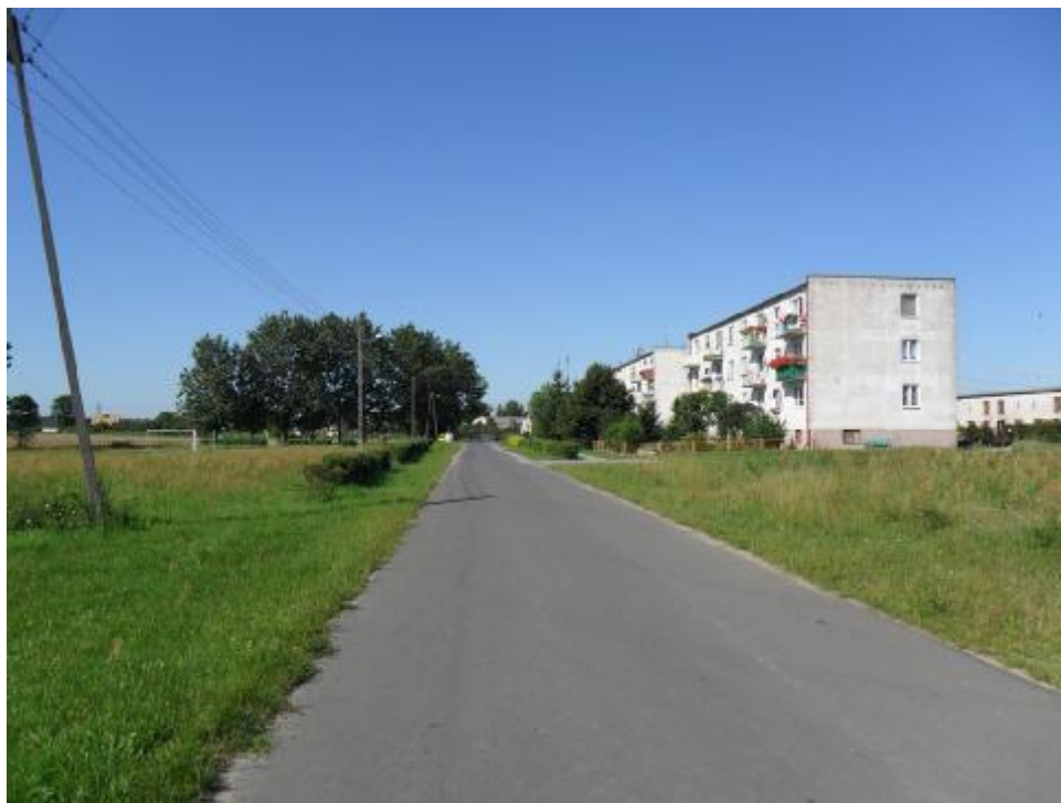
Droga gminna na terenie wsi Nowe.