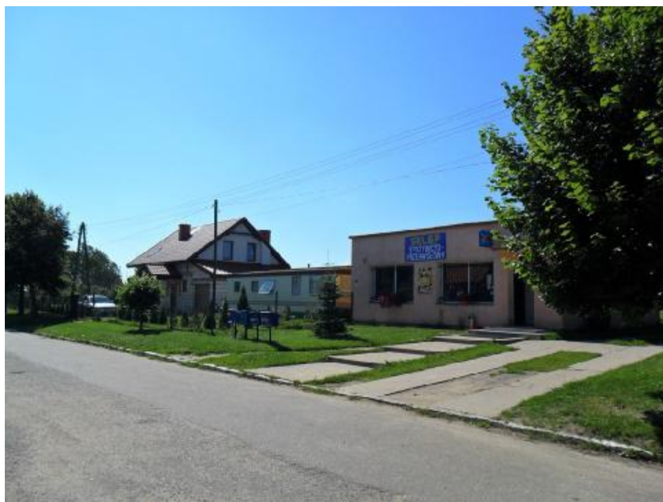
Funkcjonujący we wsi sklep spożywczo – przemysłowy.