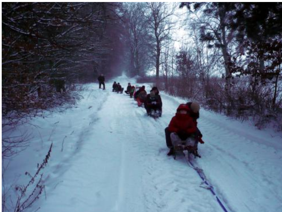
Dłuuugi radosny kulig.