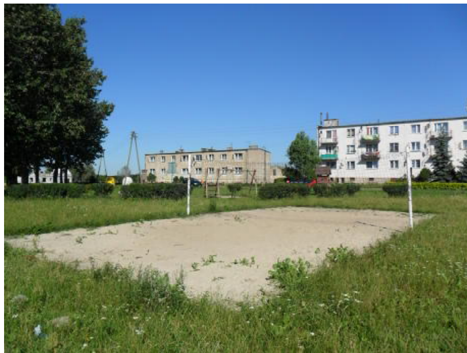
Tereny wykorzystywane przez mieszkańców jako boiska sportowe (położone na gruncie prywatnym)