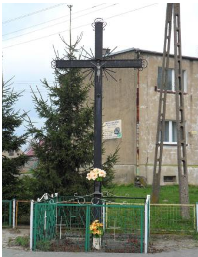
Krzyż przydrożny na skrzyżowaniu dróg.