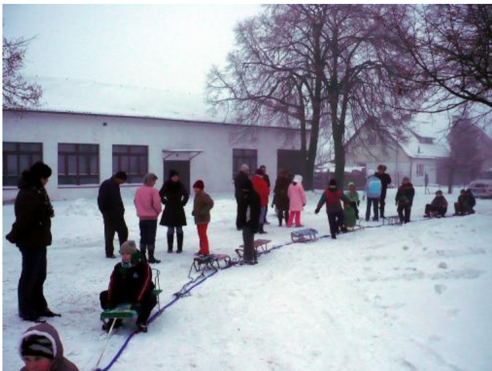
Zima- czas zabawy na śniegu.