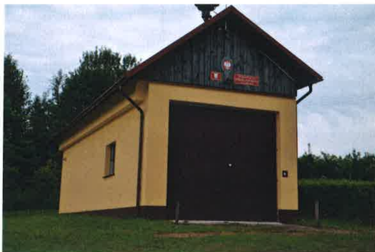
Remiza Ochotniczej Straży Pożarnej w Trelkowie

Stwierdzić można, że należy kontynuować działania w zakresie tworzenia warunków do formowania się grup społecznych, mających realne możliwości podejmowania konkretnych działań na rzecz środowiska lokalnego, z pozyskiwaniem środków zewnętrznych włącznie.