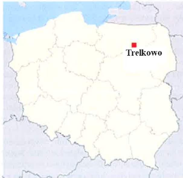
Mapa Polski z naniesioną lokalizacją miejscowości Trelkowo.

Miejscowość Trelkowo położona jest w północnej części Gminy Szczytno, w powiecie szczycieńskim, w południowej części województwa warmińsko-mazurskiego. Miejscowość dzieli od Szczytna odległość 8 kilometrów. Ukształtowanie powierzchni ma charakter zróżnicowany z przewagą pagórkowatego. Współrzędne Trelkowa to: 53° 37' 30" szerokości geograficznej północnej i 20° 59' długości geograficznej wschodniej.