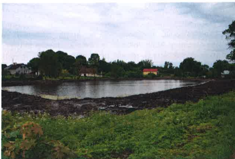
Staw w centrum wsi Trelkowo