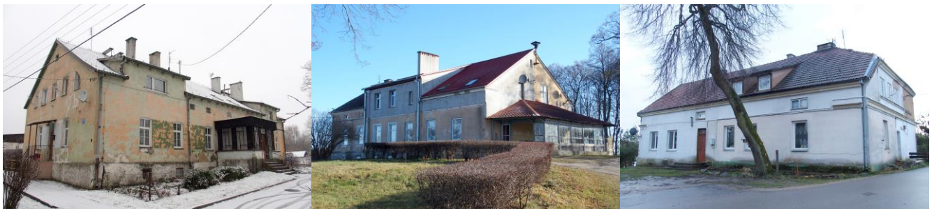
Zdjęcia nr 7, 8, 9. Bystry nr 7, Gorazdowo nr 5, Kalinowo nr 3

Pozostałe dwory są istotnym, historycznym dziedzictwem kulturowym. Prezentują walory typowe dla budownictwa mieszkalnego okresu 4 ćw. XIX w.-1ćw. XX w.