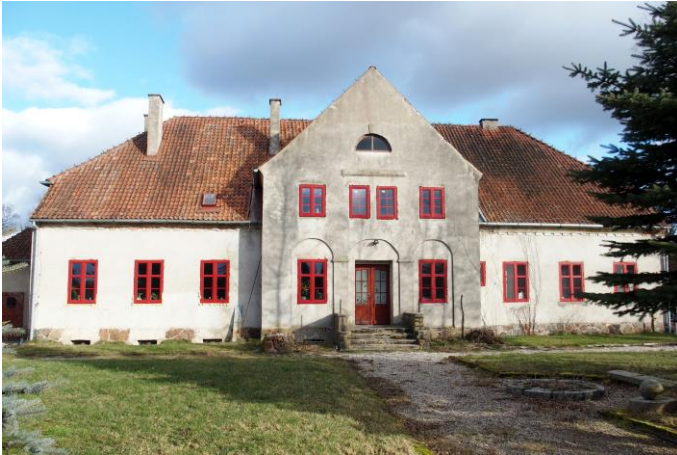
Zdjęcie nr 3. Nowe Soldany nr 13, dwór w zespole dworsko-folwarcznym, ob. budynek mieszkalny

Obiekt wzniesiony w 1 ćw. XX w., w szacie neoklasycyzmu. Budynek na rzucie prostokąta, w części podpiwniczony, parterowy, z dwukondygnacyjnym ryzalitem zwieńczonym trójkątną wystawką – na osi fasady, nakryty naczółkowym dachem i dwuspadowym dachem wystawki. Analogiczny ryzalit w elewacji tylnej, poprzedzony murowaną werandą. Ściany murowane, tynkowane, na cokole licowanym kamieniem polnym. Elewacje gładko tynkowane, w przyziemiu ryzalitu – trzy płytkie arkadowe blendy, w zwieńczeniu ścian – schodkowy gzyms. Wnętrze dwutraktowe.