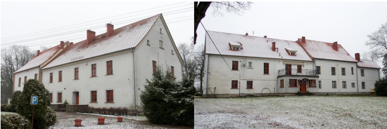
Zdjęcia nr 4, 5. Pierkunowo nr 1, dwór, ob. budynek mieszkalny

Budynek pochodzi z 1880 r., 1 ćw. XX w., brak cech stylowych. Złożony z dwóch, dwukondygnacyjnych, lekko zróżnicowanych członków na rzucie prostokąta, nakrytych dwuspadowymi dachami i niższego dwukondygnacyjnego aneksu. W fasadzie dobudowany współcześnie ganek. Budynek murowany, tynkowany, pozbawiony detali architektonicznych.