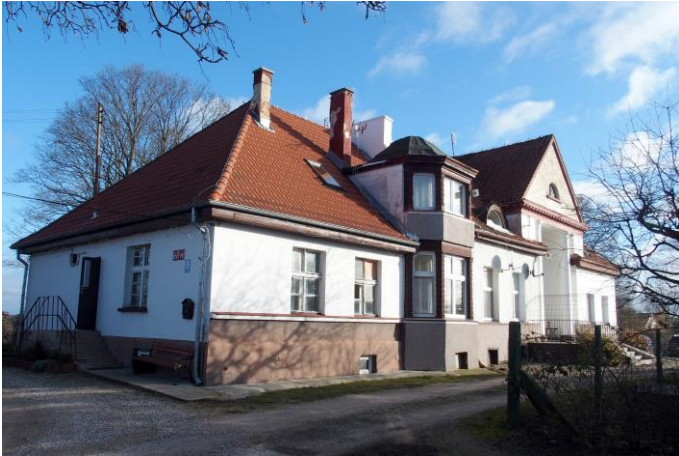
Zdjęcie nr 6. Upałty Małe nr 8, dwór, ob. budynek mieszkalny

Budynek wzniesiony w pocz. XX w., zapewne wg projektu architekta z Olecka, H. Thieme. Po wojnie budynek przekształcony w dom wielorodzinny. Podpiwniczony, parterowy budynek złożony z dwóch prostokątnych części, lekko zróżnicowanych w wysokości, nakryty dwoma trójspadowymi dachami. Fasada niesymetryczna: w części pld. – rozczłonkowana dwukondygnacyjnym ryzalitem z wgłębnym portykiem zwieńczonym trójkątnym szczytem wspartym na parze kolumn w porządku wielkim. W drugiej części – dwukondygnacyjny aneks zamknięty trójbocznie. Elewacje gładko tynkowane, bez detali. Zmieniony kształt okien.