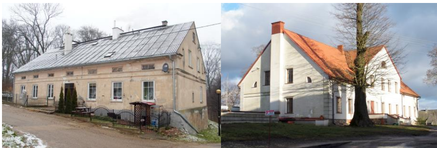
Zdjęcia nr 10, 11. Piękna Góra nr 2, Zielony Gaj nr 1