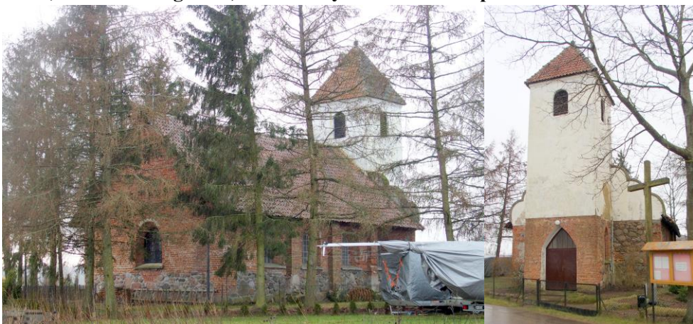
Zdjęcia nr 1, 2. Doba, kościół ewangelicki, obecnie rzymsko-katolicki pw. św. Jana Chrzciciela

Pierwszy kościół w Dobie wzniesiony został w 1574 r., w 1887 r., z inicjatywy rodziny Tautenbergów, wzniesiono wieżę i przeprowadzono remont budynku. Po wojnie kościół uległ zniszczeniu w wyniku uderzenia pioruna, odbudowany został w 1985 r. na fundamentach zrujnowanej świątyni. Utrzymany jest w stylu późnogotyckim.