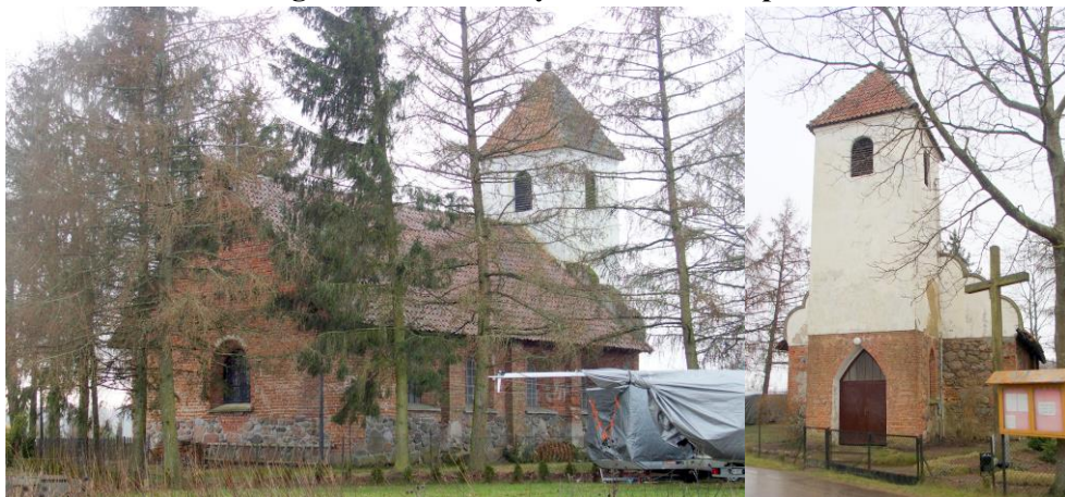
Zdjęcia nr 1, 2. Doba, kościół ewangelicki, obecnie rzymsko-katolicki pw. św. Jana Chrzciciela

• Doba, kościół ewangelicki, obecnie rzymsko-katolicki pw. św. Jana Chrzciciela