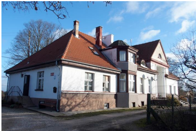
Zdjęcie nr 6. Upały Małe nr 8, dwór, ob. budynek mieszkalny

Budynek wzniesiony w pocz. XX w., zapewne wg projektu architekta z Olecka, H. Thieme. Po wojnie budynek przekształcony w dom wielorodzinny. Podpiwniczony, parterowy budynek złożony z dwóch prostokątnych części, lekko zróżnicowanych w wysokości, nakryty dwoma trójspadowymi dachami. Fasada niesymetryczna: w części płd. – rozczłonkowana dwukondygnacyjnym ryzalitem z wgłębnym portykiem zwieńczonym trójkątnym szczytem wspartym na parze kolumn w porządku wielkim. W drugiej części – dwukondygnacyjny aneks zamknięty trójbocznie. Elewacje gładko tynkowane, bez detali. Zmieniony kształt okien.