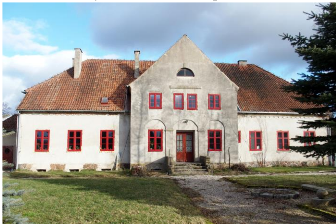
Zdjęcie nr 3. Nowe Soldany nr 13, dwór w zespole dworsko-folwarcznym, ob. budynek mieszkalny

Obiekt wzniesiony w 1 ćw. XX w., w szacie neoklasycyzmu. Budynek na rzucie prostokąta, w części podpiwniczony, parterowy, z dwukondygnacyjnym ryzalitem zwieńczonym trójkątną wystawką – na osi fasady, nakryty naczółkowym dachem i dwuspadowym dachem wystawki. Analogiczny ryzalit w elewacji tylnej, poprzedzony murowaną werandą. Ściany murowane, tynkowane, na cokole licowanym kamieniem polnym. Elewacje gładko tynkowane, w przyziemiu ryzalitu – trzy płytkie arkadowe blendy, w zwieńczeniu ścian – schodkowy gzyms. Wnętrze dwutraktowe.