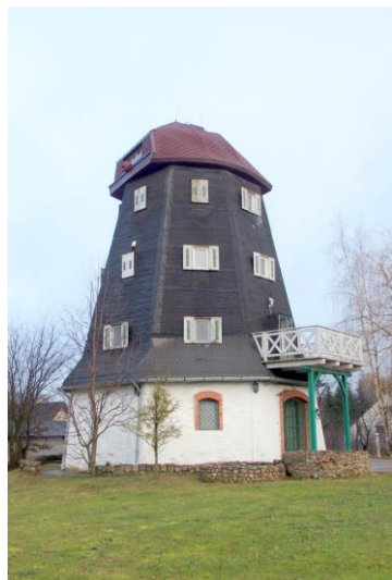
Zdjęcie nr 12. Wiatrak holenderski w Sterławkach Małych