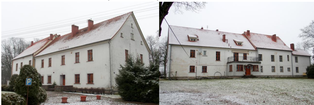
Zdjęcia nr 4, 5. Pierkunowo nr 1, dwór, ob. budynek mieszkalny

Budynek pochodzi z 1880 r., 1 ćw. XX w., brak cech stylowych. Złożony z dwóch, dwukondygnacyjnych, lekko zróżnicowanych członków na rzucie prostokąta, nakrytych dwuspadowymi dachami i niższego dwukondygnacyjnego aneksu. W fasadzie dobudowany współcześnie ganek. Budynek murowany, tynkowany, pozbawiony detali architektonicznych.