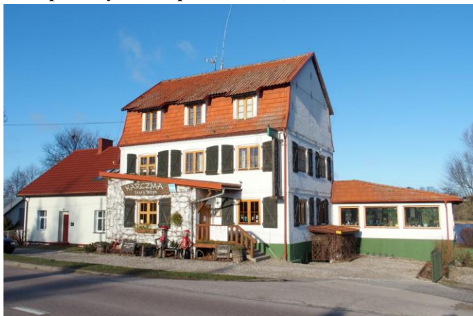
Zdjęcie nr 13. Zespół Młyna w Upałtach nr 2, ob. karczma

Wiatrak w Sterławkach Małych to ostatni reprezentant licznych niegdyś na tym terenie budowli tego typu. Wzniesiony w 2 poł. XIX w., później przebudowany (fragmenty murowane). Zbudowany na planie sześcioboku. Obecnie jest bez skrzydeł, znajduje się w rękach prywatnych, pełni funkcję domu mieszkalnego.