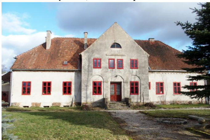
Zdjęcie nr 3. Nowe Soldany nr 13, dwór w zespole dworsko-folwarcznym, ob. budynek mieszkalny

Obiekt wzniesiony w 1 ćw. XX w., w szacie neoklasycyzmu. Budynek na rzucie prostokąta, w części podpiwniczony, parterowy, z dwukondygnacyjnym ryzalitem zwieńczonym trójkątną wystawką – na osi fasady, nakryty naczółkowym dachem i dwuspadowym dachem wystawki. Analogiczny ryzalit w elewacji tylnej, poprzedzony murowaną werandą. Ściany murowane, tynkowane, na cokole licowanym kamieniem polnym. Elewacje gładko tynkowane, w przyziemiu ryzalitu – trzy płytkie arkadowe blendy, w zwieńczeniu ścian – schodkowy gzyms. Wnętrze dwutraktowe.