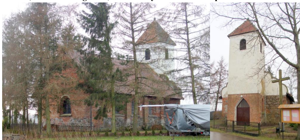
Zdjęcia nr 1, 2. Doba, kościół ewangelicki, obecnie rzymsko-katolicki pw. św. Jana Chrzciciela

• Doba, kościół ewangelicki, obecnie rzymsko-katolicki pw. św. Jana Chrzciciela