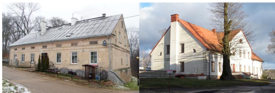
Zdjęcia nr 10, 11. Piękna Góra nr 2, Zielony Gaj nr 1