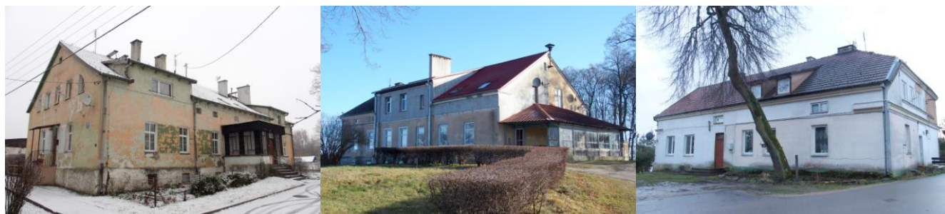
Zdjęcia nr 7, 8, 9. Bystry nr 7, Gorazdowo nr 5, Kalinowo nr 3

Pozostałe dwory są istotnym, historycznym dziedzictwem kulturowym. Prezentują walory typowe dla budownictwa mieszkalnego okresu 4 ćw. XIX w.-1ćw. XX w.