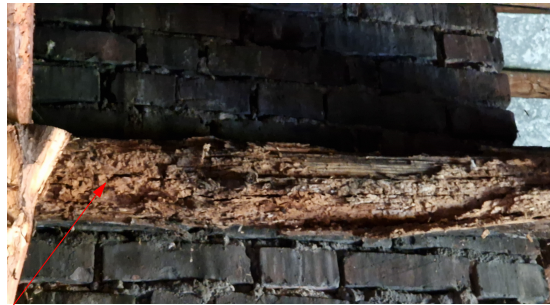
ZNISZCZONE ELEMENTY WIEŻBY DACHOWEJ