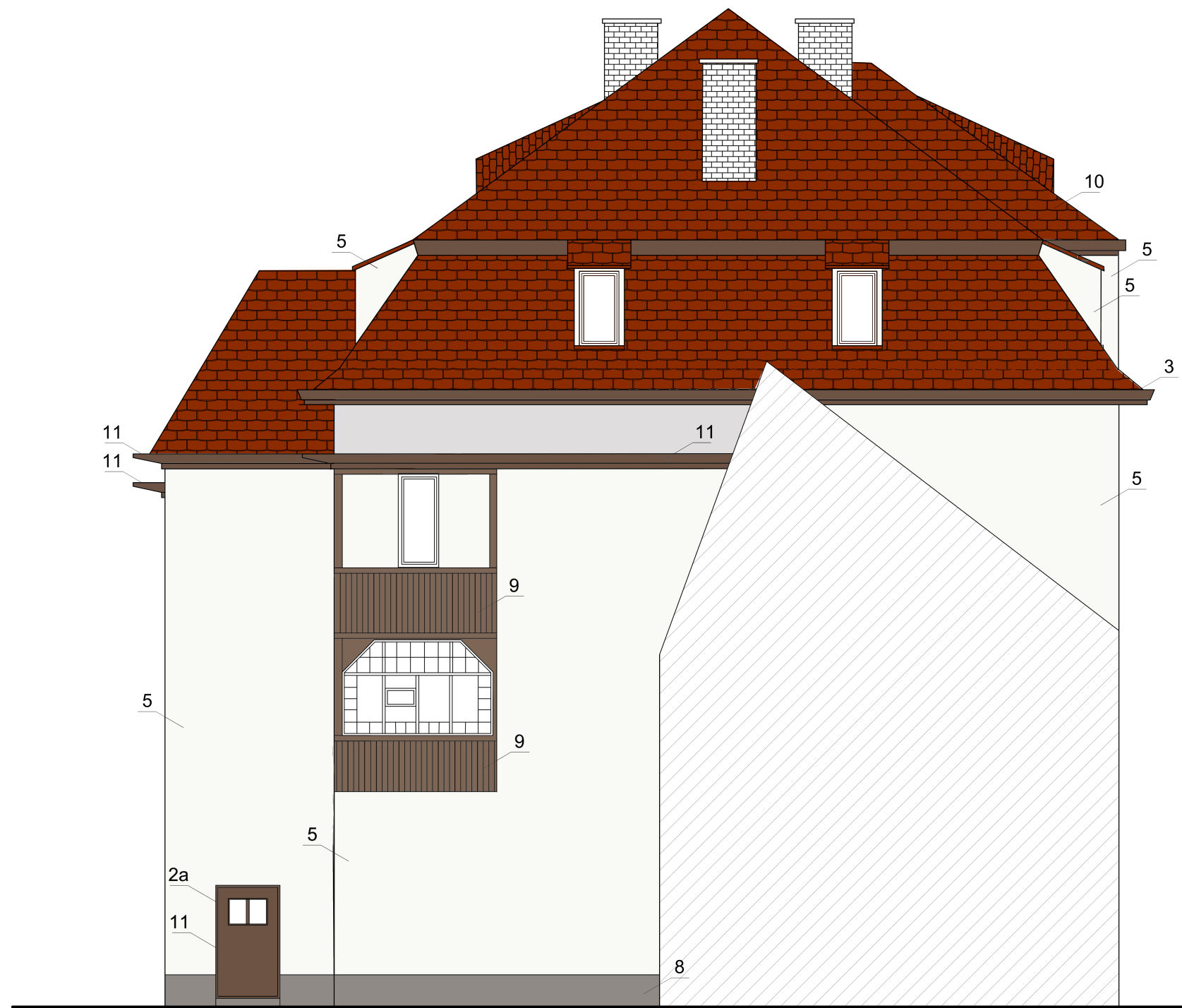
1a, 12a - wnęka okienna/drzwiowa Kolory tynku na podstawie wzornika firmy Baupol