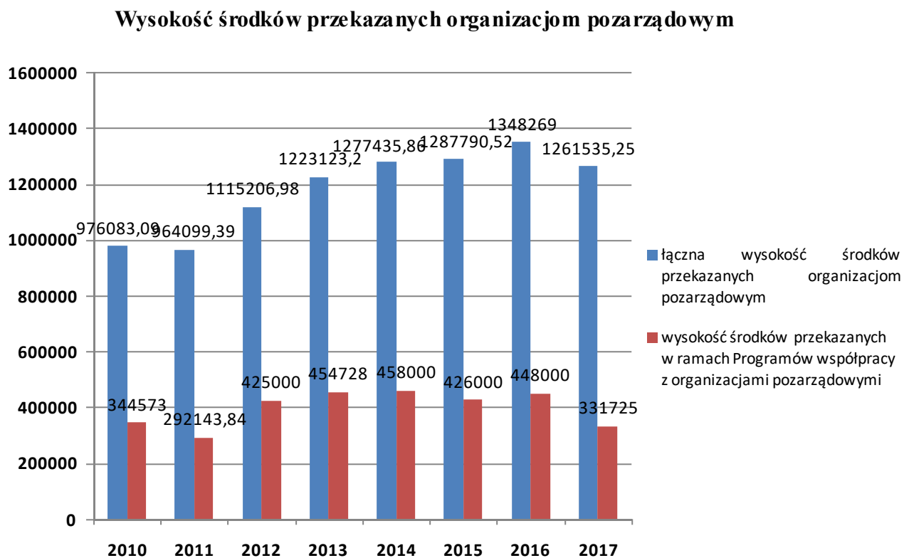
Wykres 3: Wysokość środków przekazanych organizacjom pozarządowym w latach 2010-2017 (w zł)

5) wysokość środków finansowych zaangażowanych przez organizacje pozarządowe w realizację zadań publicznych.