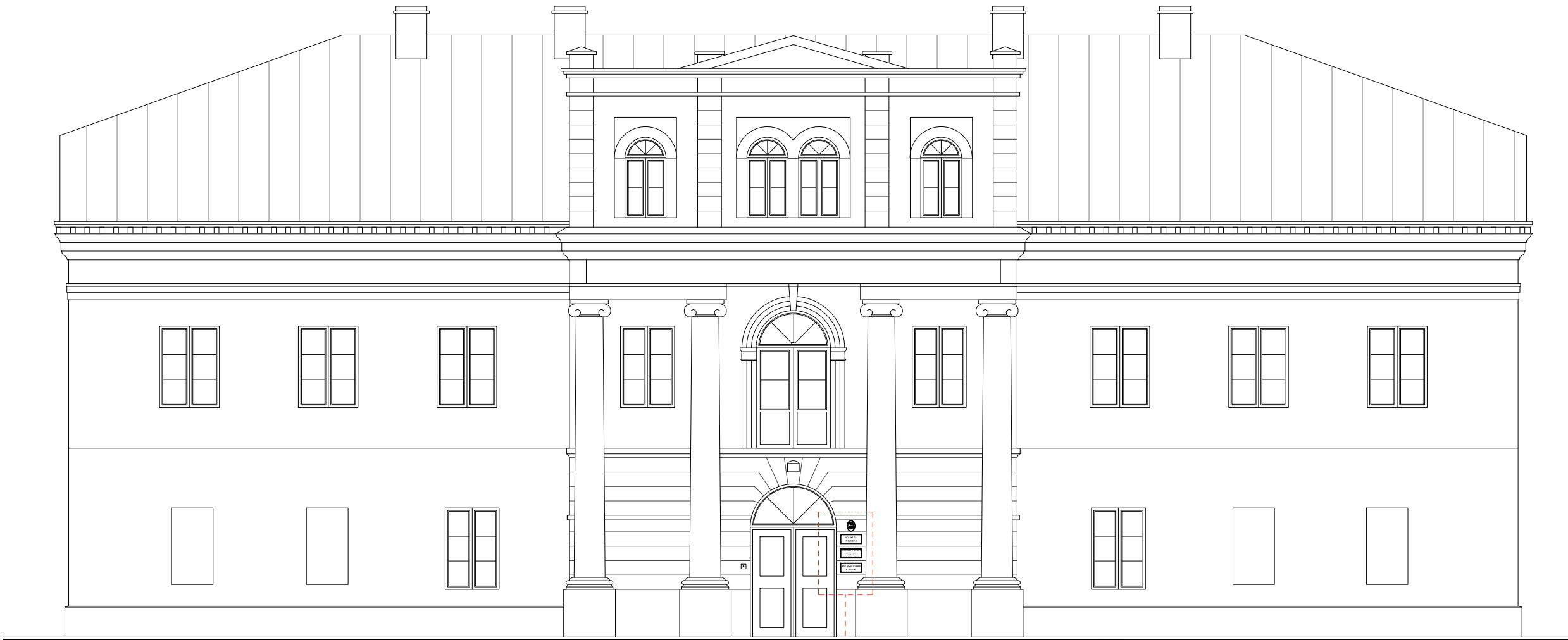
ELEWACJA PÓŁNOCNA - FRONTOWA