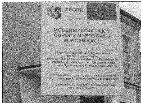
Zdjęcie nr 2. Tablica pamiątkowa.