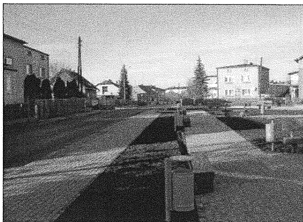
Zdjęcie nr 3. Rekreacyjne zagospodarowanie terenu przy ul. Obrony Narodowej

Kontrola obejmowała także przeprowadzenie oględzin przedmiotu projektu, którego część obrazują zamieszczone poniżej zdjęcia: