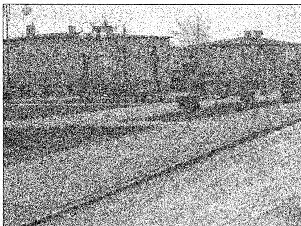
Zdjęcie nr 5. Rekreacyjne zagospodarowanie terenu przy ul. Obrony Narodowej