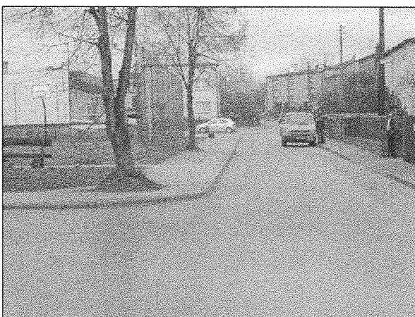
Zdjęcie nr 6. Ulica Obrony Narodowej

W tabeli nr 1 przedstawiono zakładane oraz zrealizowane wartości wskaźników osiągnięcia celów projektu.