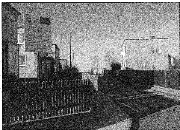
Zdjęcie nr 1. Tablica pamiątkowa