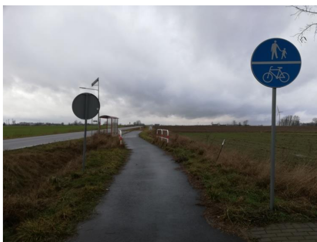
Ścieżka pieszo – rowerowa przy drodze powiatowej