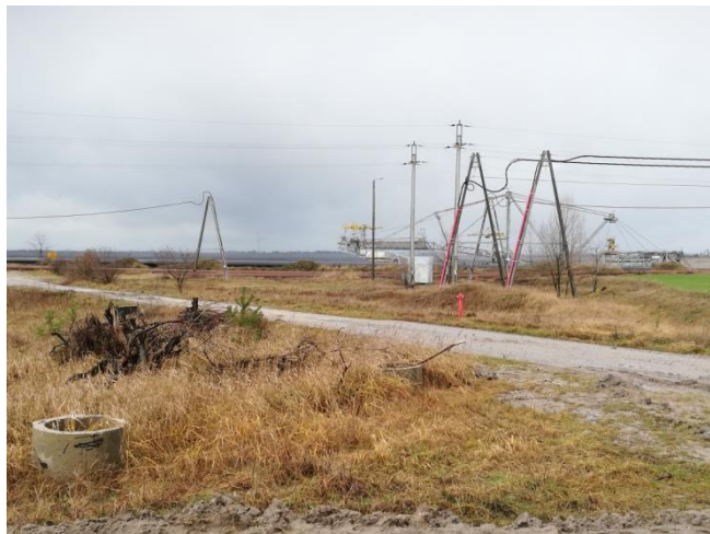
Tereny eksploatowane przez kopalnię