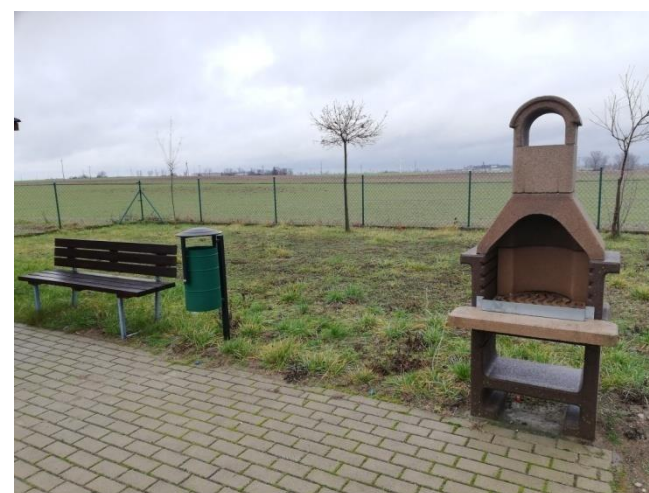
Świetlica wiejska w msc. Kaliska z terenem wokół, udostępniana do dyspozycji mieszkańców sołectwa Golina