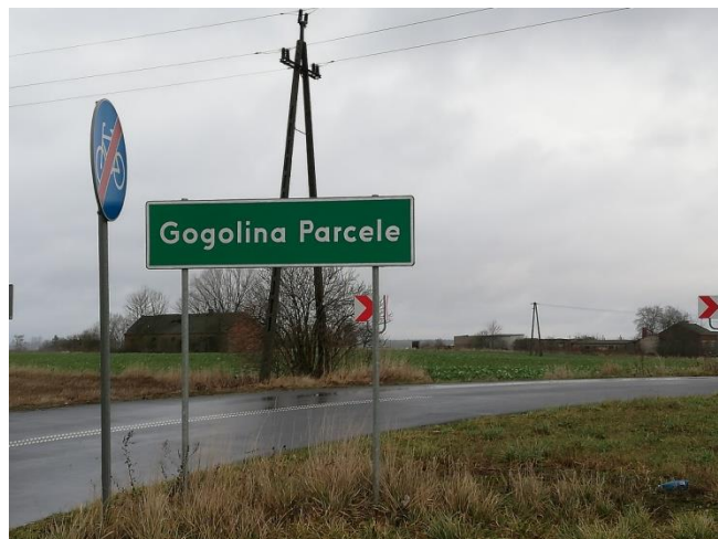
Droga dojazdowa do miejscowości Gogolina Nowa i Gogolina Parcele