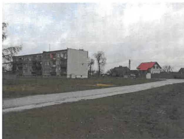
Widok na bloki mieszkalne