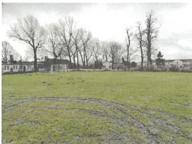
Boisko sportowe przy świetlicy wiejskiej