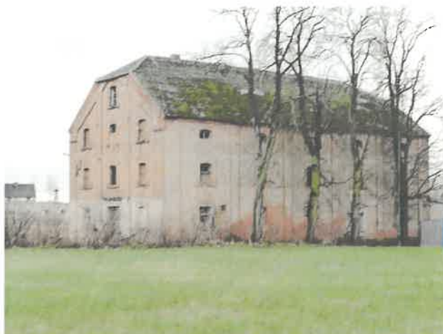
Zabytkowy budynek spichlerza