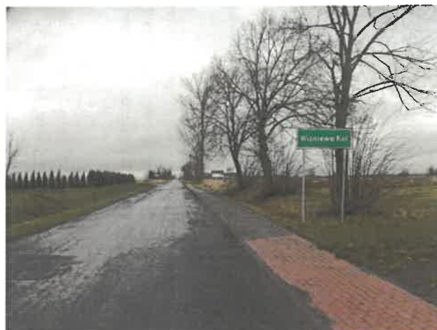
Droga dojazdowa do miejscowości Wiśniewa i Wiśniewa Kolonia