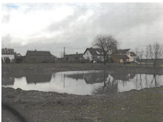
Staw w centrum miejscowości