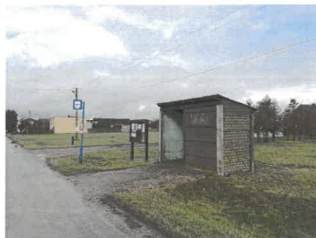
Przystanek PKS i tablica informacyjna