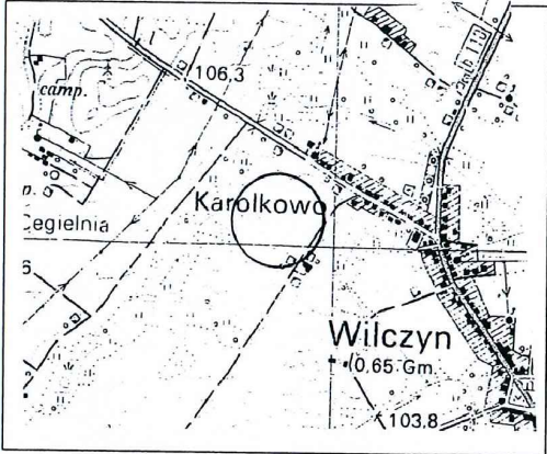
Szkiec orientacyjny 1:25 000