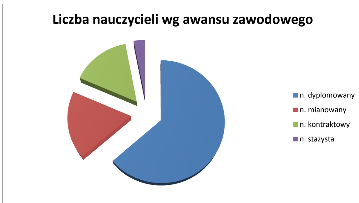
Wykres 3. Liczba nauczycieli wg awansu zawodowego.

Najliczniejszą szkołą podstawową w Gminie Suchożebry jest Szkoła Podstawowa w Suchożebkach (w strukturze Zespołu Szkół Publicznych im. H. Sienkiewicza w Suchożebkach), która wg stanu na dzień 30.09.2018r. liczyła 227 dzieci w 11 oddziałach, liczba dzieci w poszczególnych oddziałach wahała się od 11 do 24 uczniów. Następną szkołą pod względem wielkości jest Szkoła Podstawowa im. Marszałka Józefa Piłsudskiego w Krześlinie licząca 84 uczniów w ośmiu oddziałach, liczba uczniów w oddziałach wahała się od 6 do 16. Najmniej liczna szkołą jest natomiast Szkoła Podstawowa im. Marszałka Józefa Piłsudskiego w Krynicy licząca 59 uczniów w 7 oddziałach, liczba dzieci w oddziałach waha się od 4 do 12. Ponadto w Szkole Podstawowej w Suchożebkach do dnia 31 sierpnia 2019r. funkcjonują jeszcze oddziały gimnazjalne. W każdej ze szkół podstawowych jest oddział przedszkolny tzw. oddział „0”. Na terenie Gminy Suchożebry zapewniono również wychowanie przedszkolne dla dzieci w wieku 3-5 lat: w Zespole Szkół Publicznych im. H. Sienkiewicza w Suchożebkach działa czterooddziałowe przedszkole, zaś przy pozostałych dwóch szkołach podstawowych funkcjonują punkty przedszkolne.