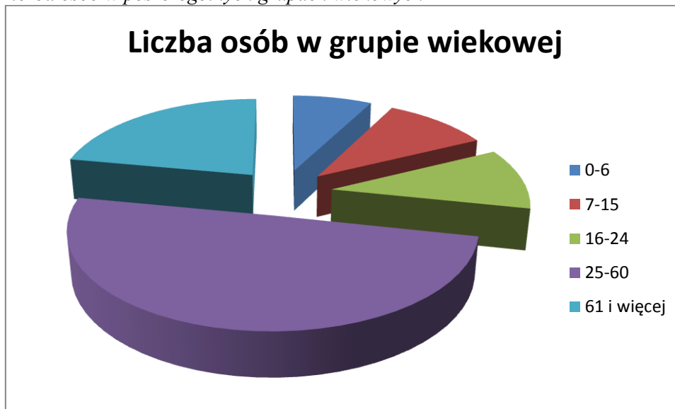
Wykres 1. Liczba osób w poszczególnych grupach wiekowych

Szczegółowe dane dotyczące osób zameldowanych w poszczególnych sołectwach przedstawia tabela poniżej.