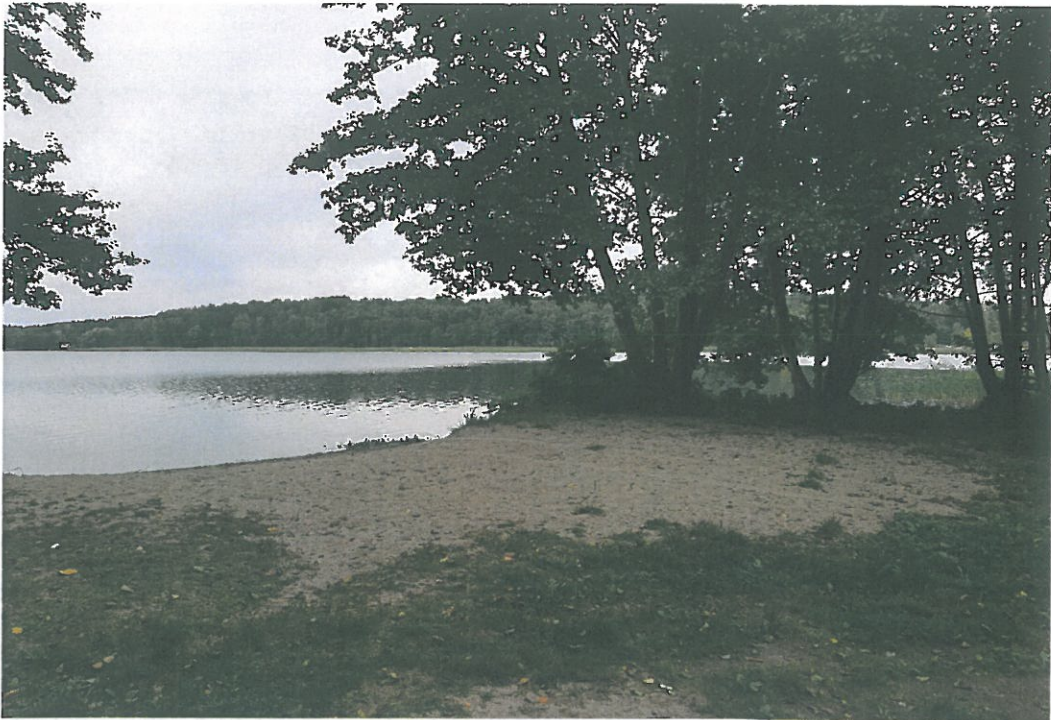
Teren rekreacyjno-wypoczynkowy jez. Wulpińskie m. Kręsk.