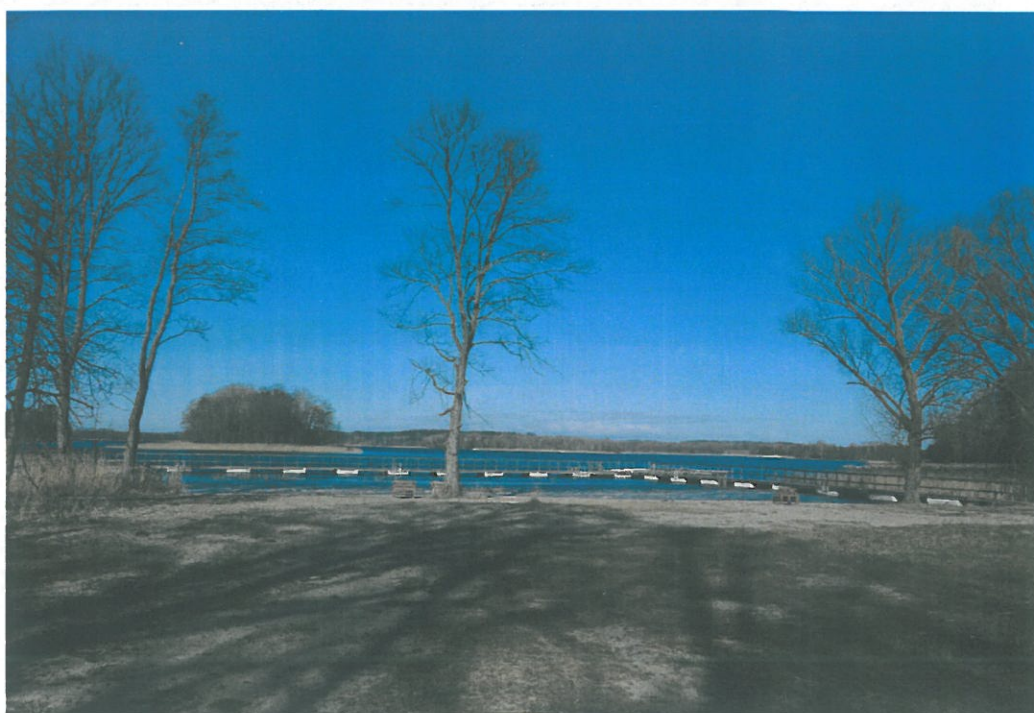
Teren rekreacyjno-wypoczynkowy jez. Wulpińskie m. Dorotowo.