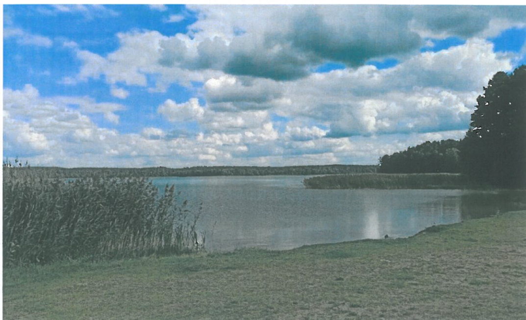
Teren rekreacyjno-wypoczynkowy jez. Łańskie m Rybaki (Fot. https://rybaki.org.pl/ ).