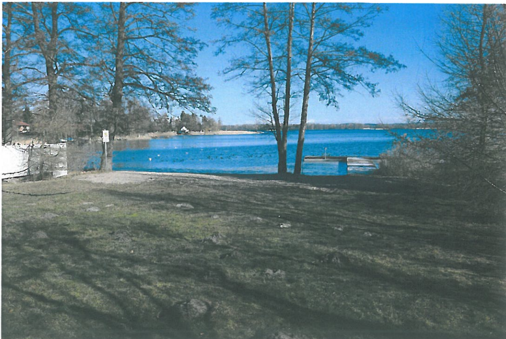
Teren rekreacyjno-wypoczynkowy jez. Wulpińskie m. Majdy.