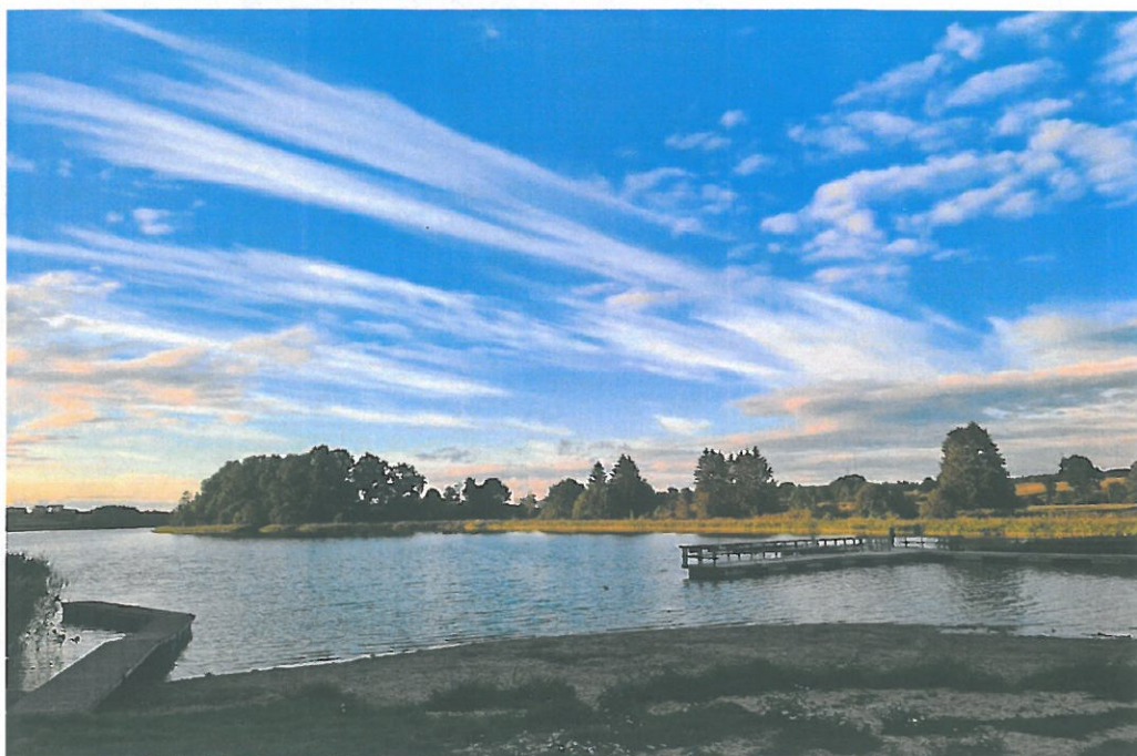
Teren rekreacyjno-wypoczynkowy jez. Bartąg m. Bartązek (Fot. Przemysław Piech).

Identyfikacja potencjalnych miejsc zagrożeń w obrębie zbiorników wodnych i cieków wodnych.