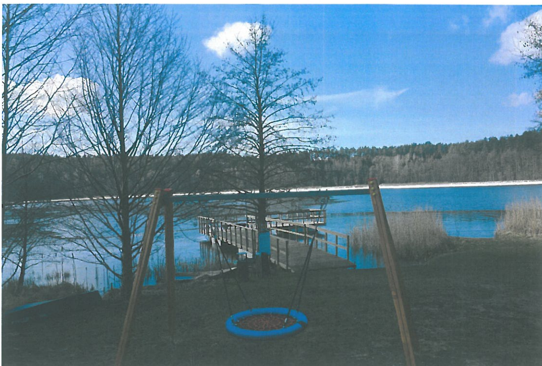
Teren rekreacyjno-wypoczynkowy jez. Wymój m. Wymój.