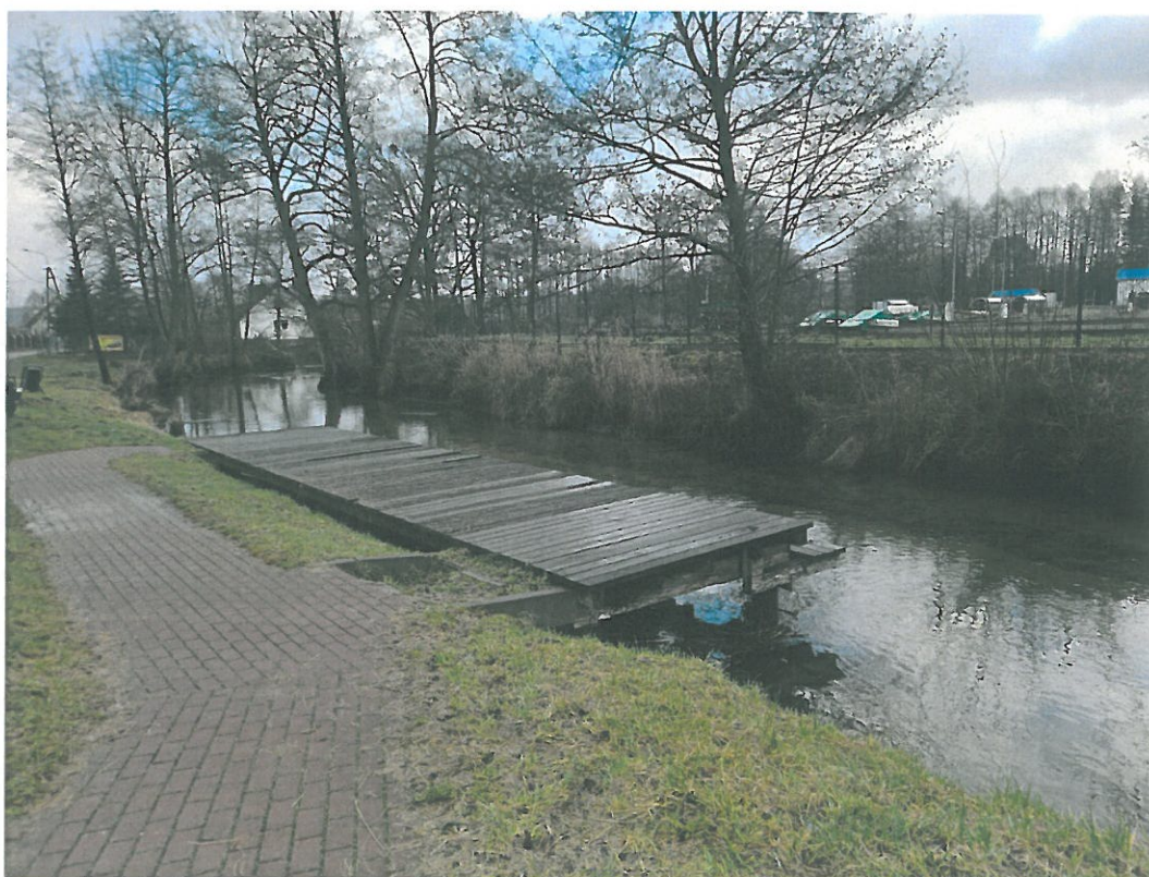
Pomost do wodowania kajaków rz. Łyna m. Ruś.