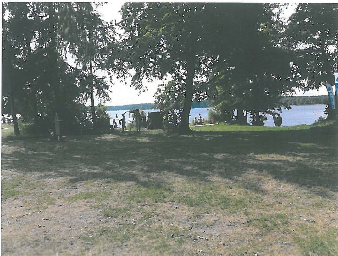
Teren rekreacyjno-wypoczynkowy jez. Pluszne m. Pluski.