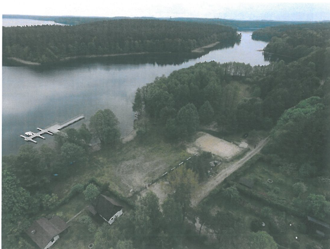
Teren rekreacyjno-wypoczynkowy jez. Pluszne m. Zielonowo (Fot. Adam Walkowiak).