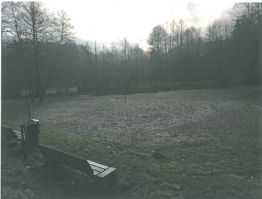
Teren rekreacyjno-wypoczynkowy rz. Łyna m. Ruś.