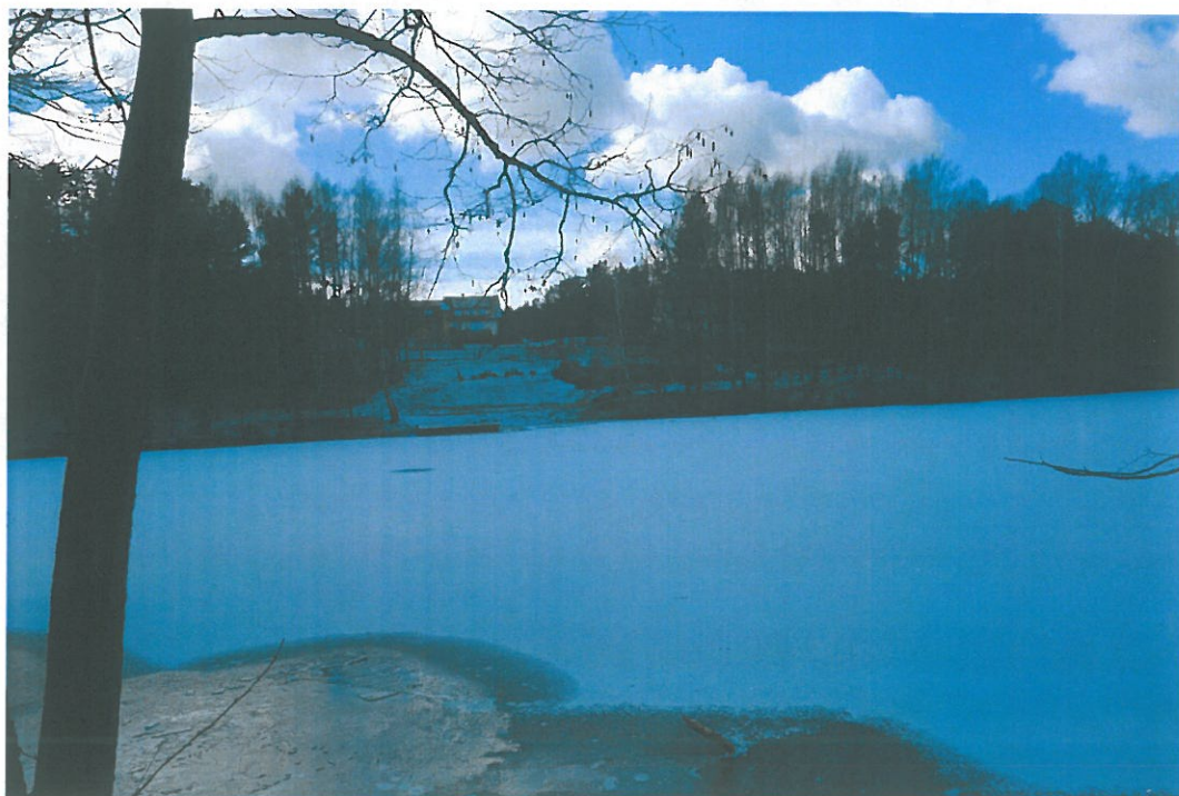
Teren rekreacyjno-wypoczynkowy jez. Miodówko m. Miodówko (Fot. Monika Jabłońska).