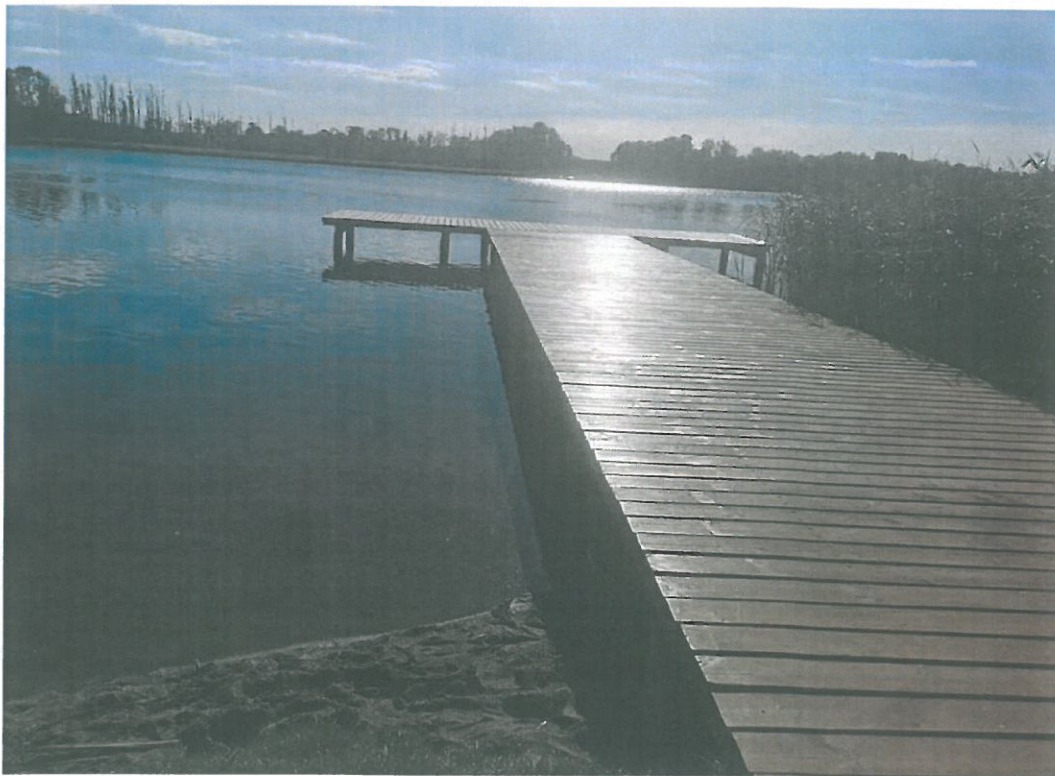
Teren rekreacyjno-wypoczynkowy jez. Wulpińskie m. Tomaszkowo.