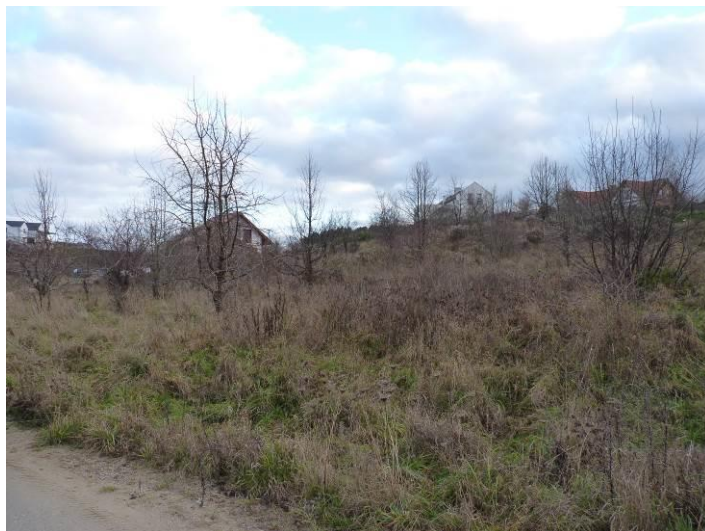
Zdjęcie. Zabudowa mieszkaniowa jednorodzinna położona w granicach obszaru objętego projektem planu.