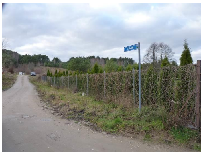
Zdjęcie. Ulica Kamila stanowiąca północną granicę obszaru objętego projektem planu.