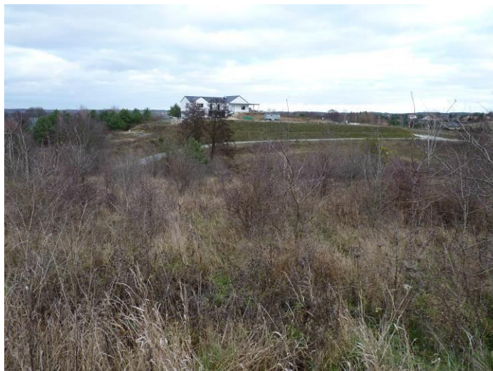
Zdjęcie. Ulica Jakuba i teren obecnie niezagospodarowany w części północno-wschodniej obszaru objętego projektem planu.