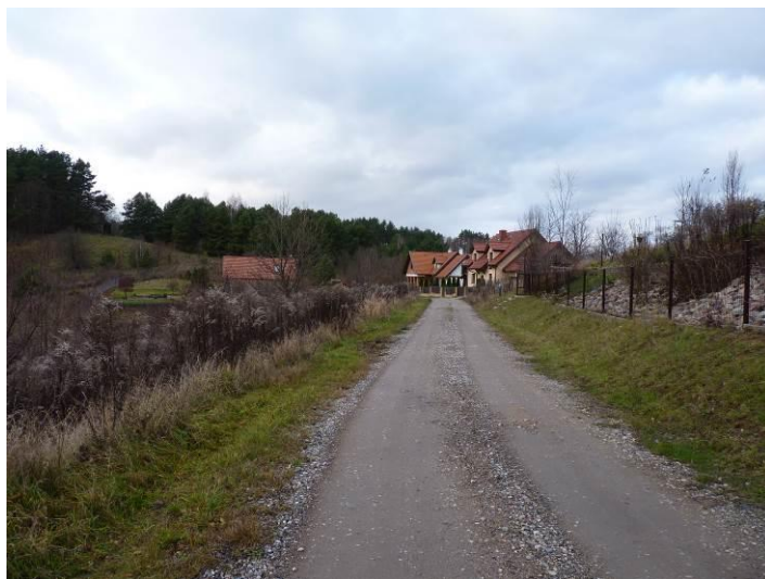
Zdjęcie. Ulica Krzysztofa i zabudowa mieszkaniowa jednorodzinnej położone w centralnej części obszaru objętego projektem planu.