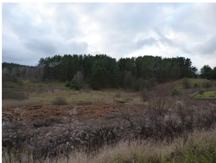
Zdjęcie. Obniżenie terenowe zlokalizowane w południowej części obszaru objętego projektem planu.