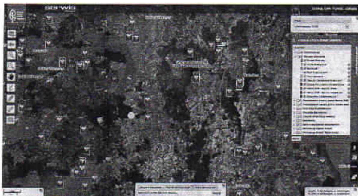
Rys. 9.1 Mapa przedstawiająca lokalizację infrastruktury kajakowej na tle istniejących form ochrony przyrody