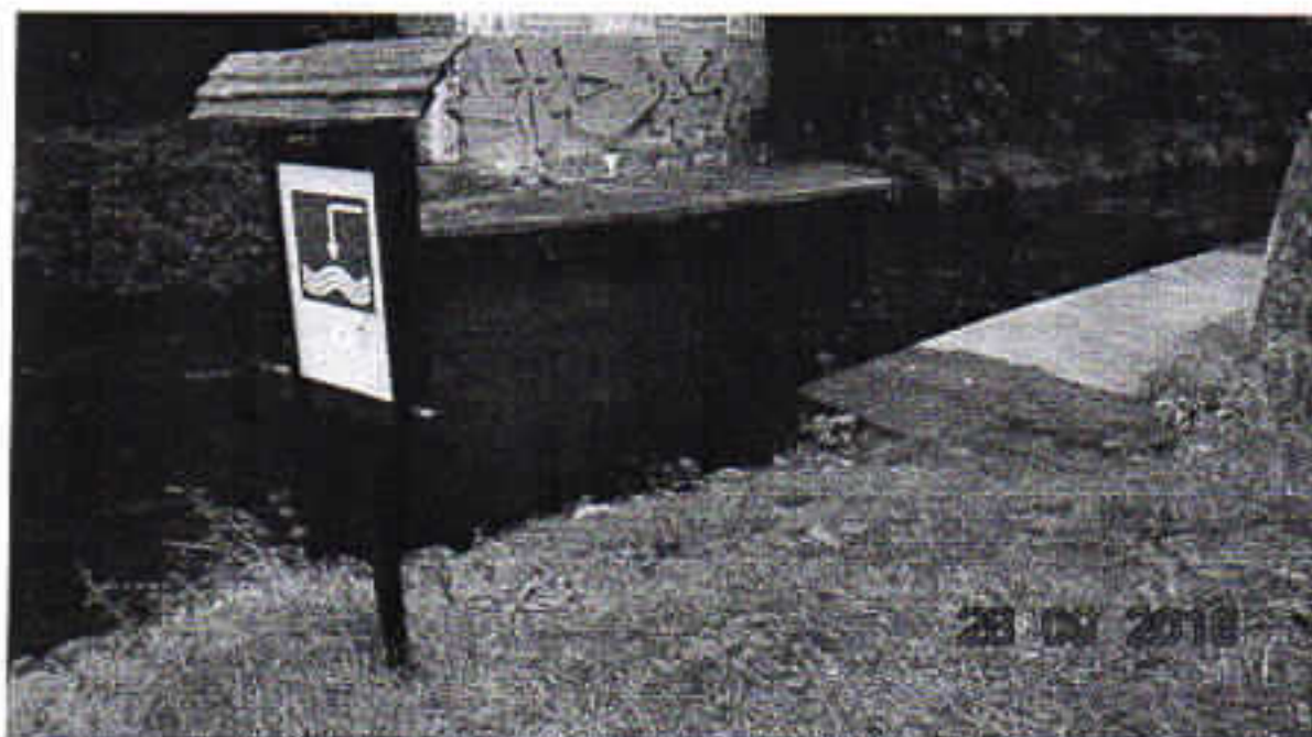
Zdj. 2 Miejsce wodowania kajaków za przeszkodą w Nowej Wsi Rzecznej

Mając na uwadze istniejące zagospodarowanie w przedstawionej lokalizacji, ingerencja w środowisko naturalne nie przekroczy aktualnych norm. Realizacja przedmiotowej inwestycji nie wymaga wycinki drzewostanu na analizowanych działkach lokalizacyjnych.