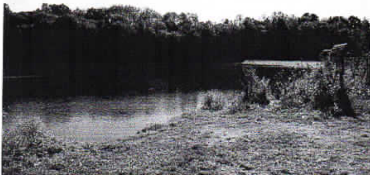
Zd. 1 Miejsce wyjmowania kajaków przez elektrownią wodną w Nowej Wsi Riecznej

Działka nr 223/1 położona jest w sąsiedztwie elektrowni wodnej (Elektrownia Wierzyca-dz. nr 223/1). Dojazd do elektrowni jest utrudniony ze względu na złą nawierzchnię drogi (na ostatnim odcinku płyty betonowe) oraz przecinający dojazd potok Piesienica. Budowa elektrowni nie objęła swoim zasięgiem zapewnienia przenoski na szlaku kajakowym. Obecnie istnieje oznakowanie przenoski oraz punktów wyjmowania i wodowania kajaków. Przed przeszkodą brzeg rzeki jest bardzo łagodny, piaszczysto-trawiasty, porośnięty trzinami. Znajdują się tam oznaki użytkowania tego terenu w celach rekreacyjnych o czym świadczą pozostawione ogniska oraz wydeptana ścieżka przez kajakarzy stanowiąca drogę przenoski. Przebiega ona przez użytki leśne, w północnej części działki porośnięte takimi odmianami drzew jak sosny, brzozy, olchy czarne, dęby i leszczyny, a w części południowej lasem mieszanym (grab, klon, olcha, sosna, dąb, lipa). Na kilkumetrowym odcinku biegnie wzdłuż ogrodzenia terenu elektrowni i wskutek m.in. umocnień powstałych podczas budowy elektrowni na jej trasie występują niewielkie różnice terenu. Miejsce wodowania jest porośnięte jedynie niską trawą i znajduje się pod wiaduktem kolejowym, w bliskiej odległości od elektrowni, na dość stromym brzegu rzeki. Rzeka na odcinku między elektrownią a wiaduktem kolejowym jest dość wąska o stromym brzegu umocnionym z obu stron płytami betonowymi oraz gabionami. Nurt rzeki jest szybki i zależy również od okresów pracy elektrowni.