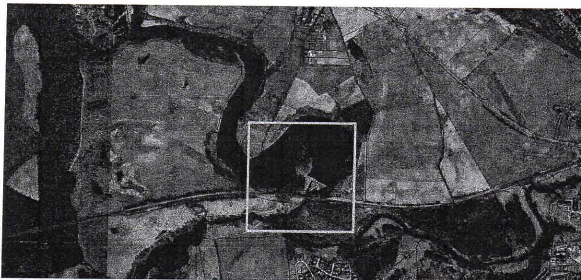
Rys 1.4 Mapa sytuacyjna określająca położenie inwestycji w Nowej Wsi Rzecznej na tle istniejącej struktury własnościowej

Działki 223/1 położona jest w miejscowości Nowa Wieś Rzeczna. W związku z obecnością na rzece trwałej przeszkody w postaci elektrowni, konieczna jest organizacja przenoski. Jej realizacja polegać będzie na uporządkowaniu ciągu pieszego, wykonaniu miejsca wyjmowania kajaków przed przeszkodą w formie slipu brzegu rzeki oraz miejsca wodowania za przeszkodą w formie pomostu oraz wykonaniu dodatkowych elementów, tj. 2 tablic informacyjno-promocyjnych, 4 koszy na śmieci, 4 ławek i oznakowania.