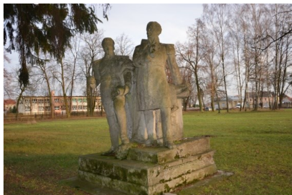
Zdjęcie 1. Pomnik Generała Ignacego Prądzyńskiego i Generała Wojciecha Chrzanowskiego w Komorowie