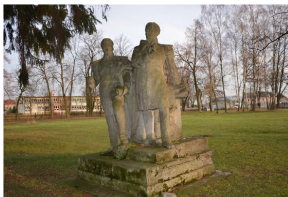
Zdjęcie 1. Pomnik Generała Ignacego Prądzyńskiego i Generała Wojciecha Chrzanowskiego w Komorowie