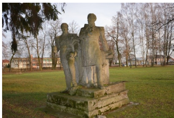
Zdjęcie 1. Pomnik Generała Ignacego Prądzyńskiego i Generała Wojciecha Chrzanowskiego w Komorowie