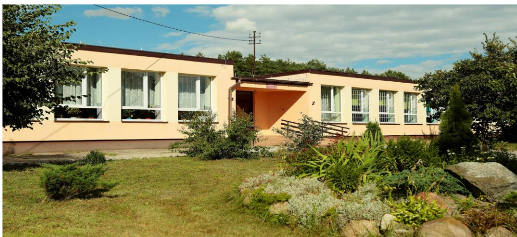
Budynek Publicznej Szkoły Podstawowej im. rtm. Witolda Pileckiego w Kozikach

Na terenie Gminy Ostrów Mazowiecka funkcjonuje 13 Publicznych Szkół Podstawowych w miejscowościach: (Dudy, Dybki, Jasienica, Jelonki, Kalinowo, Komorowo, Koziki, Lubiejewo, Nagoszewo, Nagoszewka, Nowa Osuchowa, Pałapus, Ugniewo), 4 Publiczne Gimnazja w Jasienicy, Jelonkach, Komorowie, Nagoszewie, oraz 1 Przedszkole Samorządowe w miejscowości Komorowo.