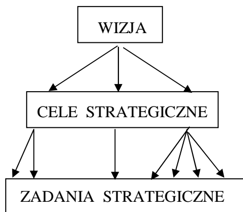
Rys. Struktura strategii

Program ten składa się z 5 części dotyczących: