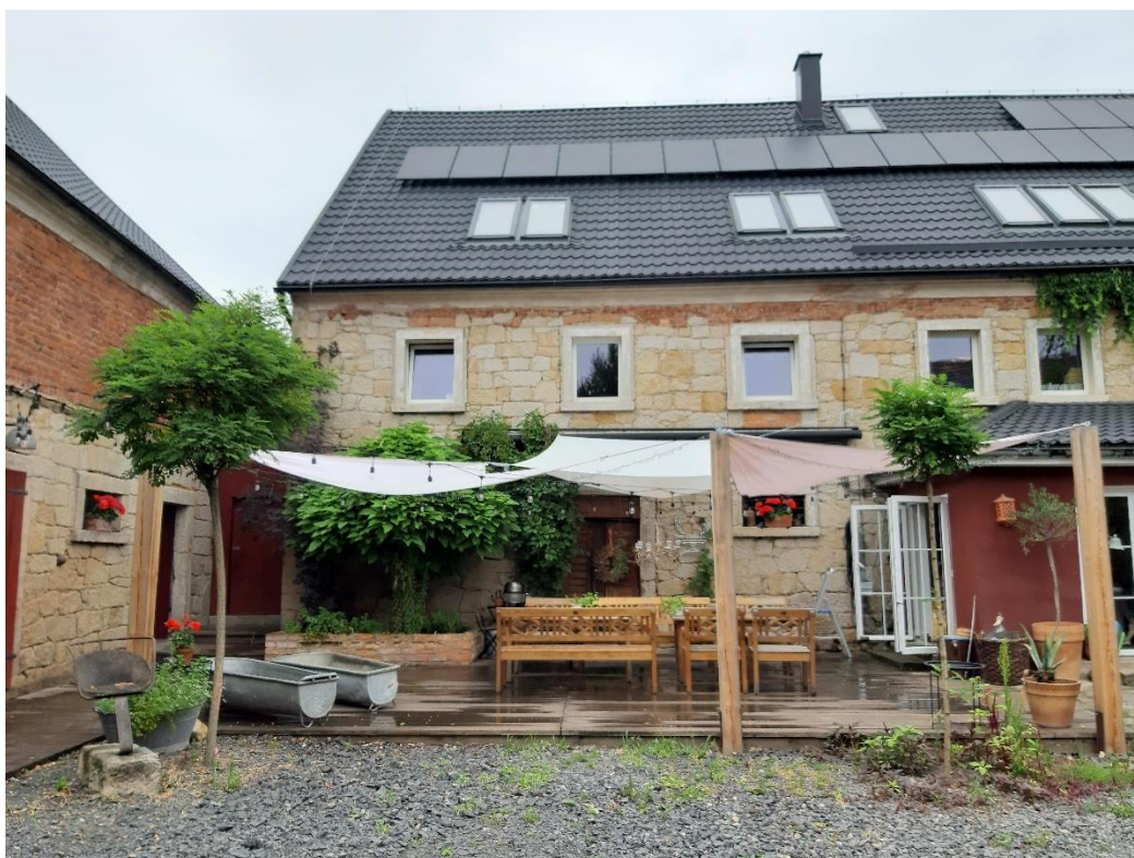
Przykład udanej rewitalizacji tradycyjnej zabudowy