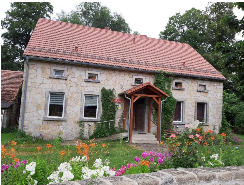
Budynek świetlicy wiejskiej