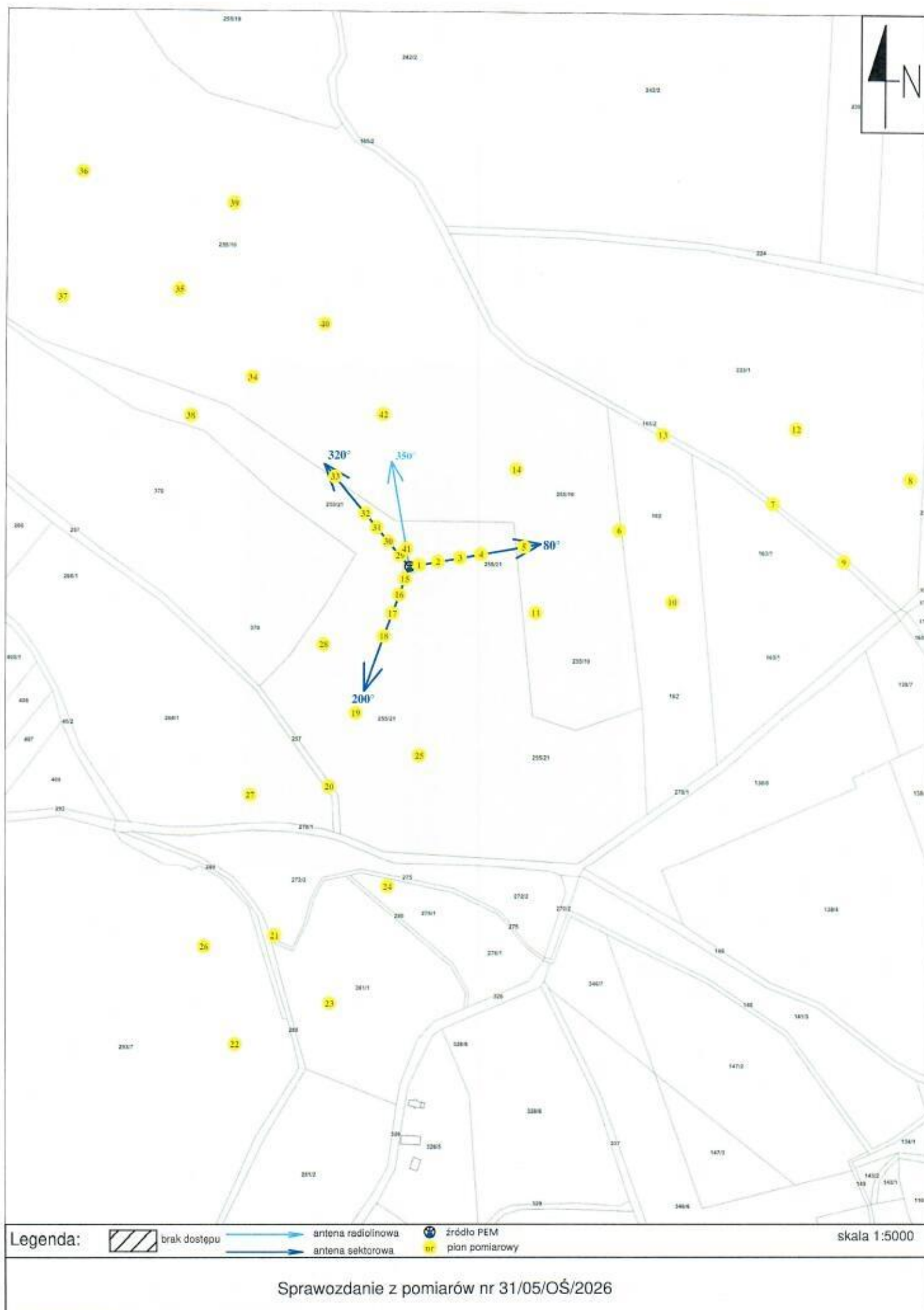
Rys. 2 Lokalizacja pionów pomiarowych