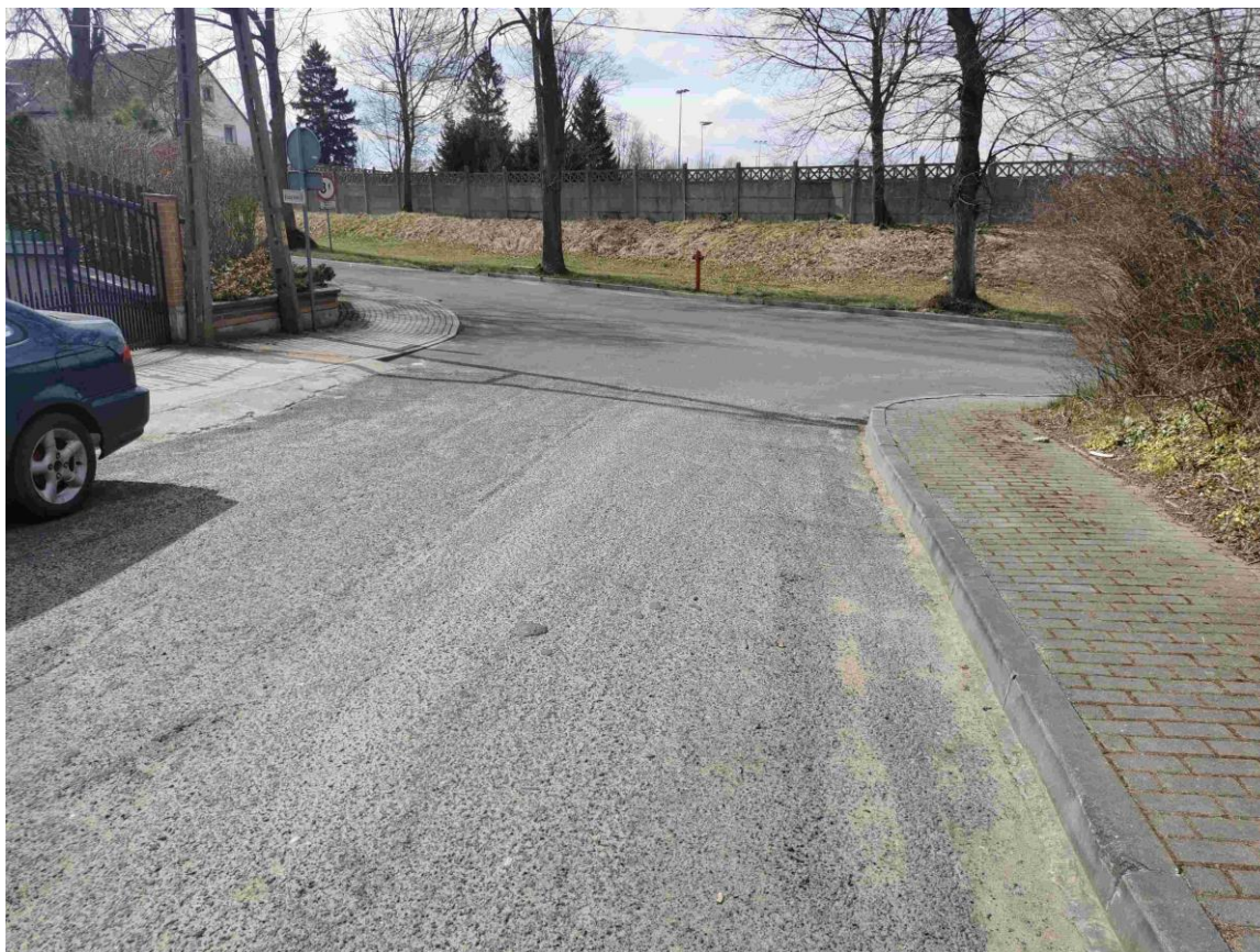
Foto nr 11. ul. Edukacji Narodowej na włączeniu do ul. Kościuszki