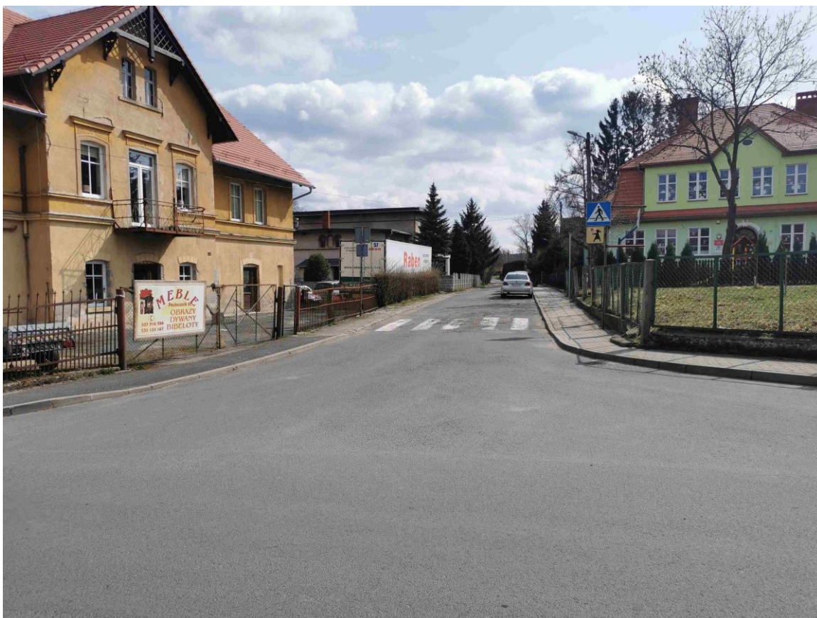
Foto nr 1. Skrzyżowanie ul. Chopina z ul. Stogryna