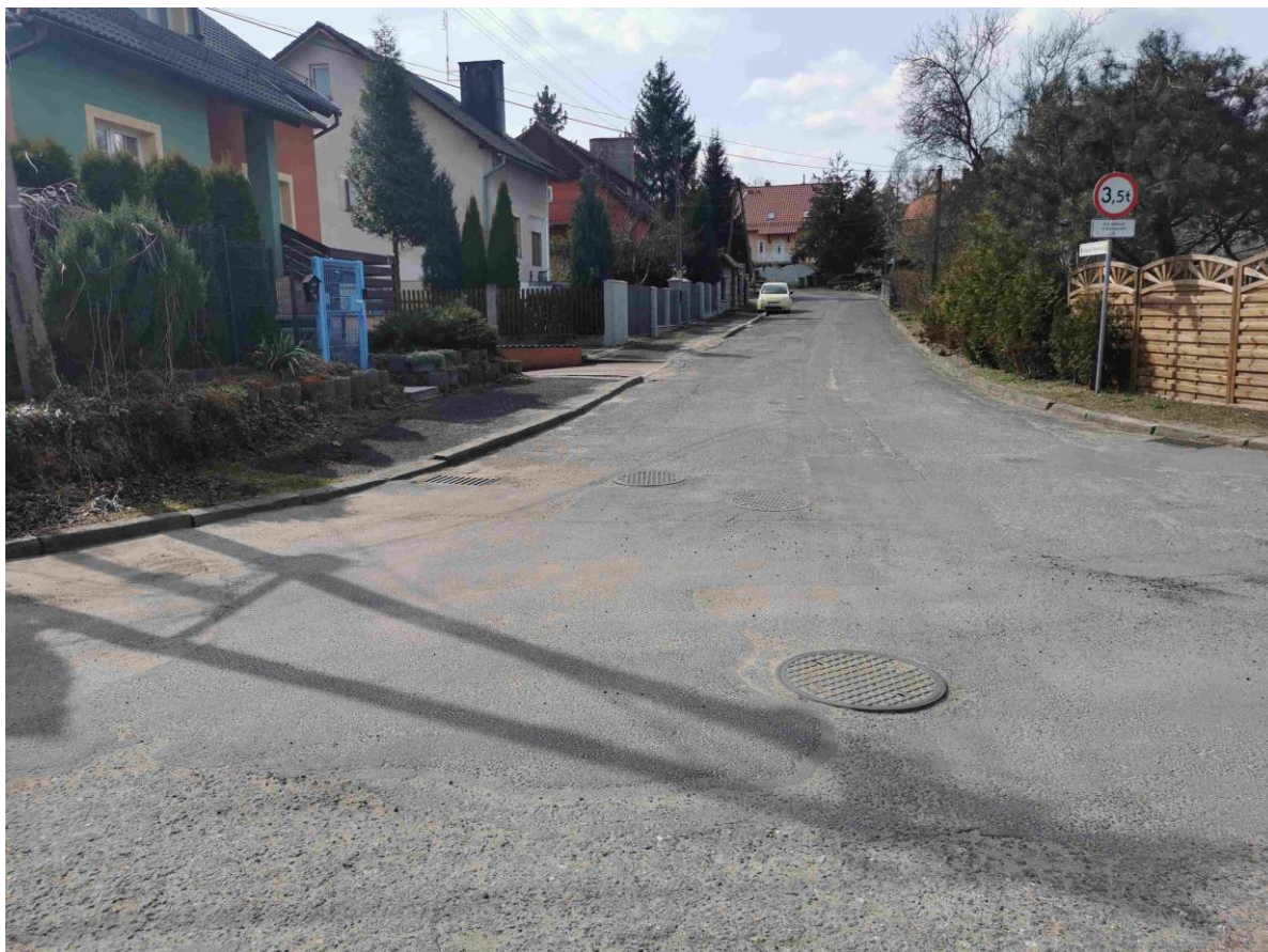
Foto nr 6. Skrzyżowanie ul. Stogryna z ul. Edukacji Narodowej