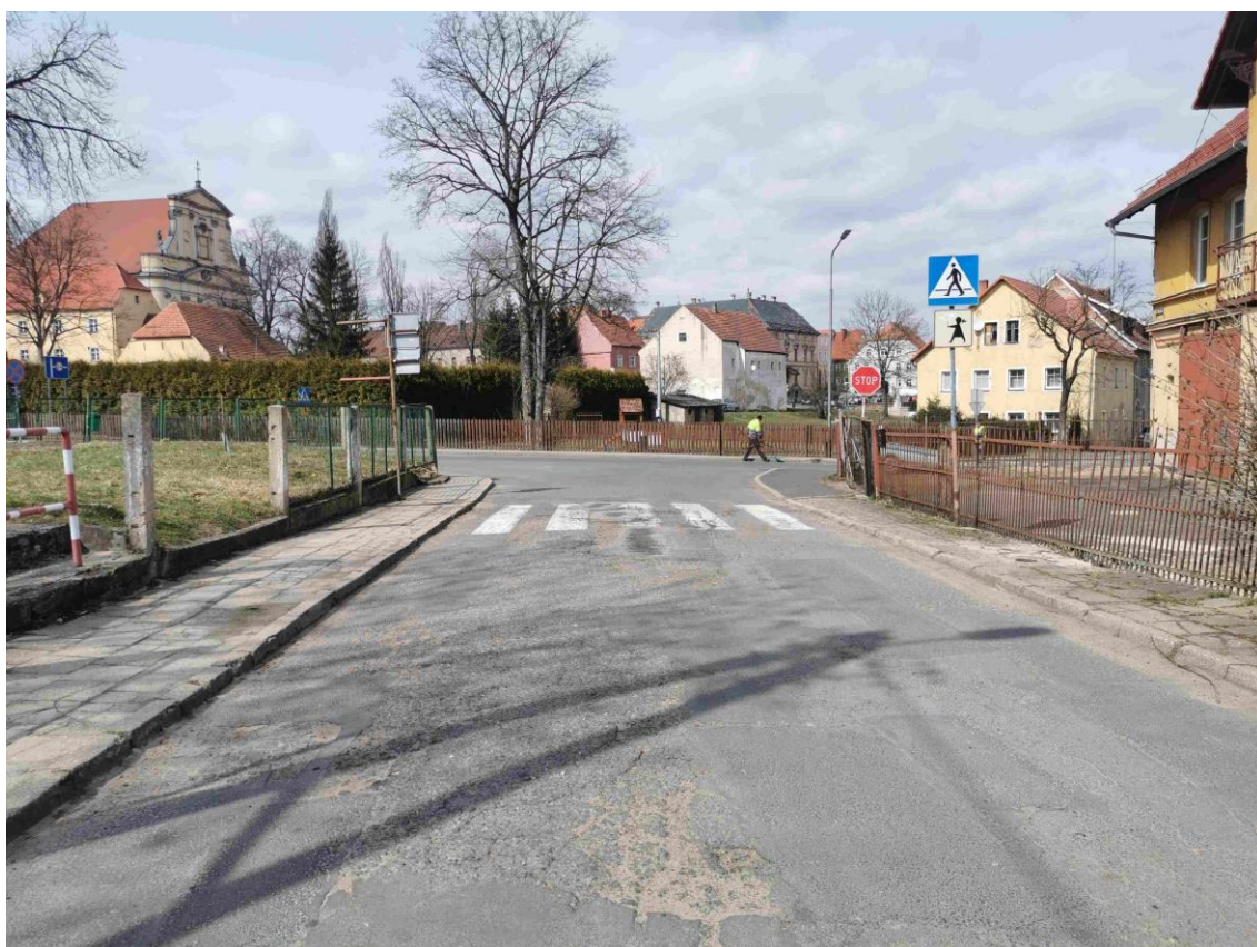
Foto nr 2. ul. Stogryna na włączeniu z ul. Chopina