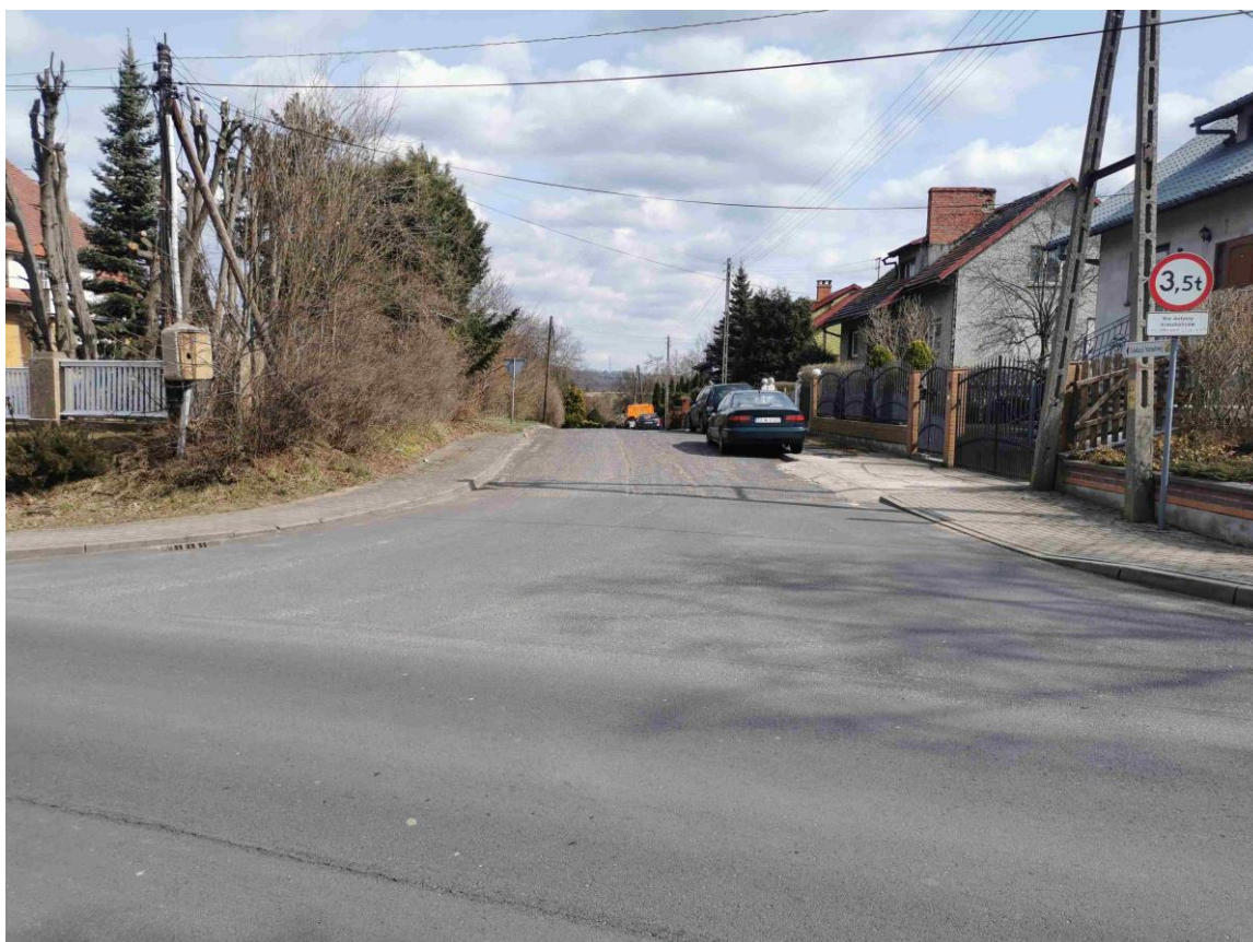
Foto nr 12. Skrzyżowanie ul. Edukacji Narodowej z ul. Kościuszki