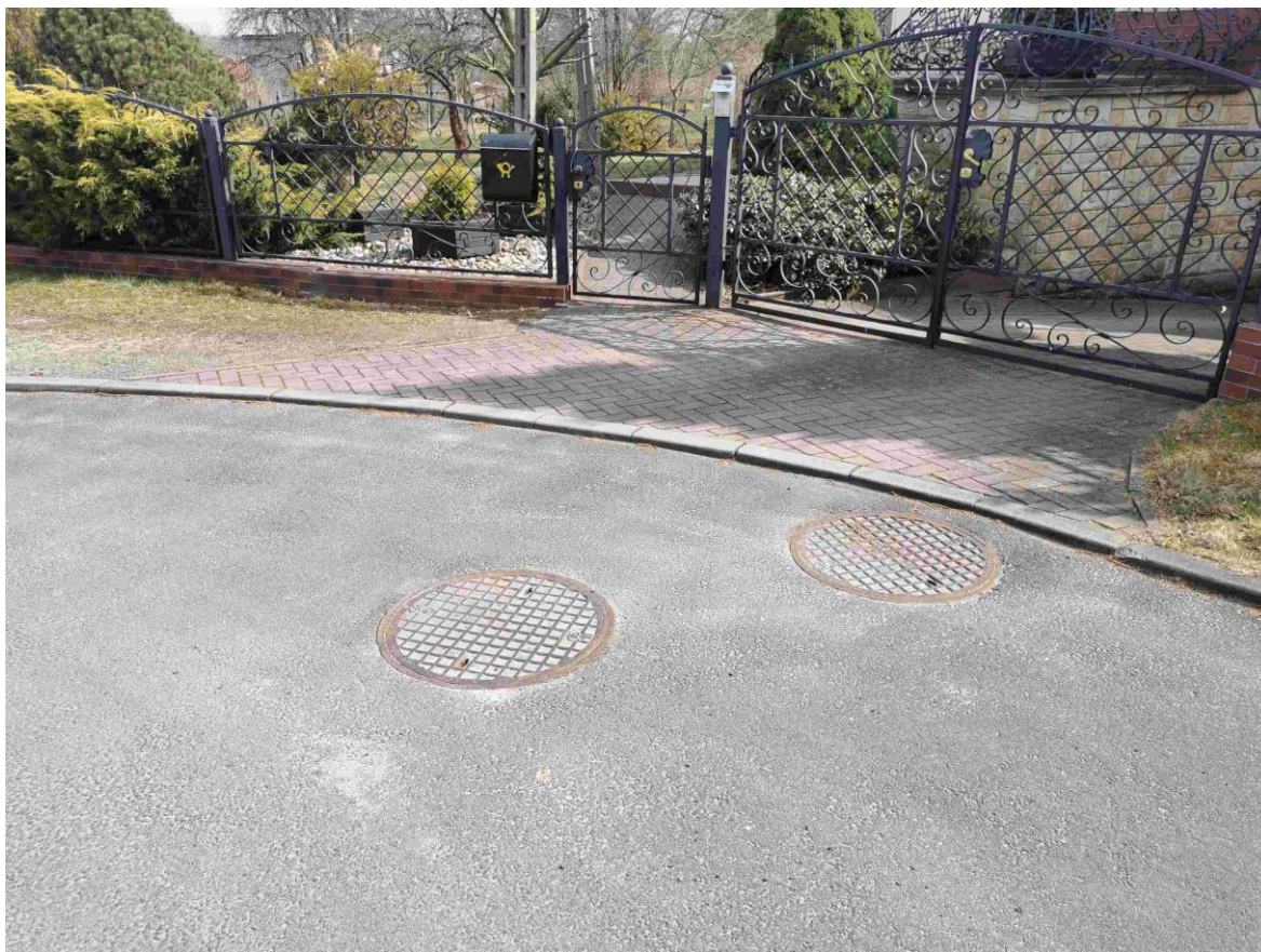
Foto nr 9. ul. Edukacji Narodowej – miejsce przepięcia przykanalika sanitarnego