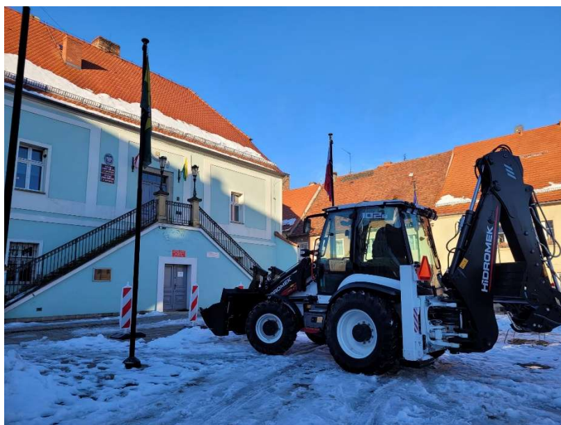
Fot. Koparko Ładowarka Hidromek

Dodatkowo w ramach działań z zakresu Ochrony Ludności i Obrony Cywilnej zrealizowano następujące zakupy: