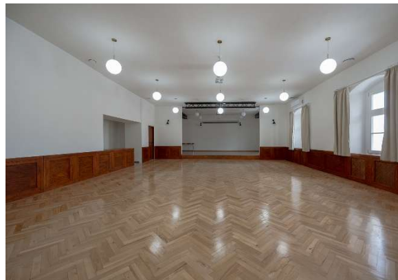
Fot. Wyremontowany budynek i sala w Lubomierskim Centrum Kultury