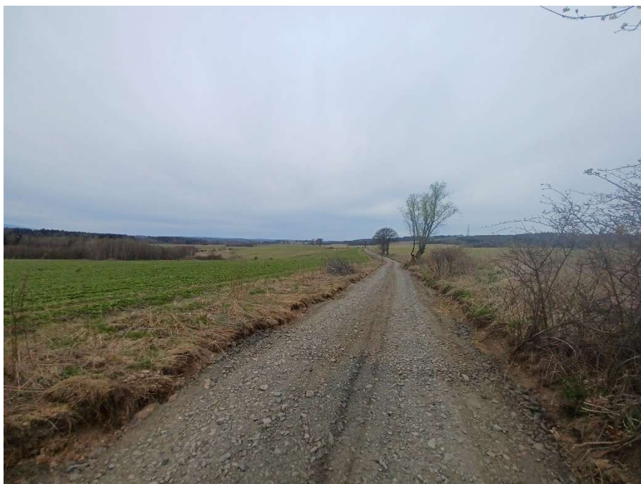
Fot. Droga relacji Wojciechów – Radomice w trakcie realizacji

19. Przebudowa drogi relacji Wojciechów - Radomice na terenie działek nr 574/2 i 574/3 obręb 0012 Wojciechów. Wartość całego zadania wyniosła 1 466 400,77 zł, a dofinansowanie z Rządowego Funduszu Rozwoju Dróg (RFRD) pokryło całość kosztów inwestycji tj. 1 466 400,77 zł. Zadanie jest w trakcie realizacji. Planowane zakończenie zgodnie z umową to wrzesień 2026.