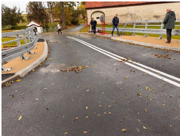
Fot. Przebudowany most w Pławnej Dolnej