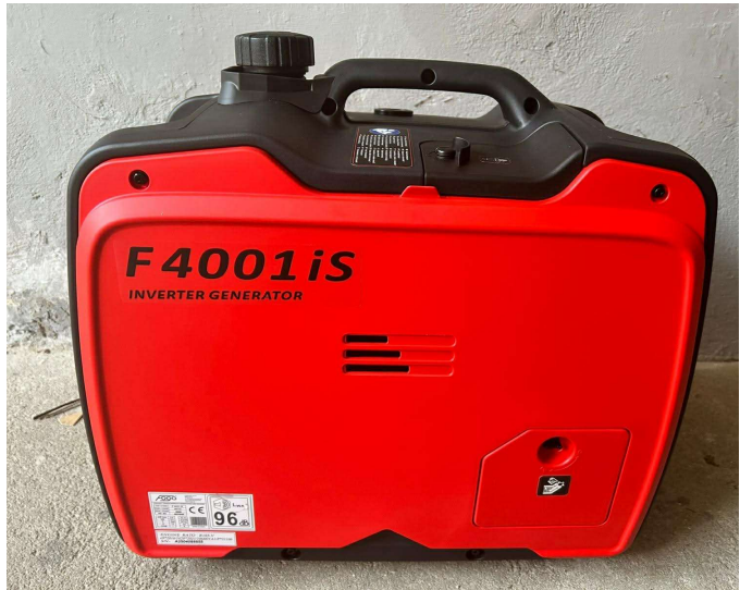
Fot. Sprzęt i wyposażenie dla jednostek Ochotniczych Straży Pożarnych

2. Ochotnicza Straż Pożarna w Miłęczicach pozyskała nowy samochód w ramach konkursu „Poprawa bezpieczeństwa w Województwie Dolnośląskim w roku 2025”, który znacząco wzmocni potencjał ratowniczy naszej gminy. Na zakup pojazdu przyznano dotację celową w wysokości 75 000 zł. OSP Miłęczice wniosła również środki własne w kwocie 20 000 zł.