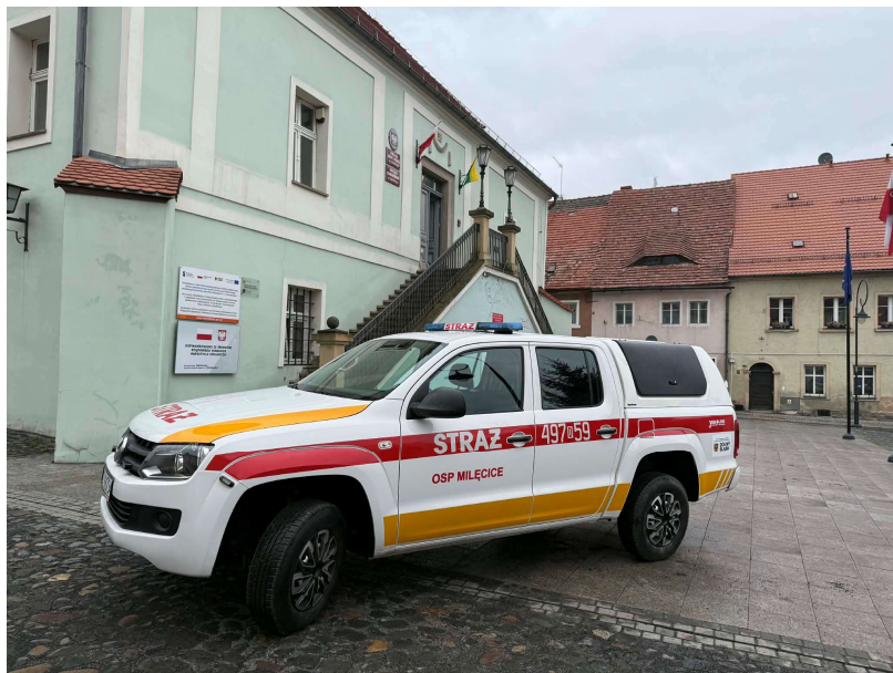
Fot. Lekki samochód rozpoznawczo-ratowniczy Volkswagen Amarok

2. Ochotnicza Straż Pożarna w Miłęczicach pozyskała nowy samochód w ramach konkursu „Poprawa bezpieczeństwa w Województwie Dolnośląskim w roku 2025”, który znacząco wzmocni potencjał ratowniczy naszej gminy. Na zakup pojazdu przyznano dotację celową w wysokości 75 000 zł. OSP Miłęczice wniosła również środki własne w kwocie 20 000 zł.