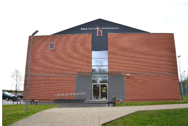
Fot. Oddana do użytkowania hala sportowo – widowiskowa w Lubomierzu