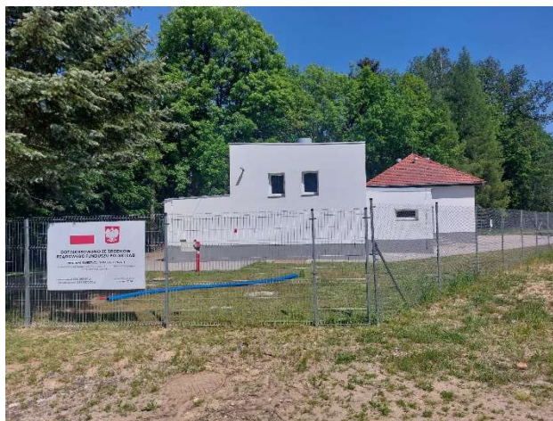
Fot. Wyremontowany budynek Stacji Uzdatniania Wody w Lubomierzu