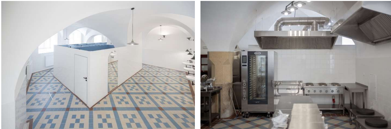
Fot. Wnętrze łazienki oraz nowa kuchnia w budynku internatu Zespołu Szkół w Lubomierzu