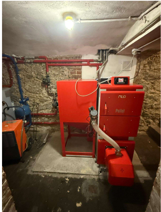
Fot. Wyremontowane drzwi wejściowe do świetlicy wiejskiej w Pasieczniku oraz pomieszczenie kotłowni