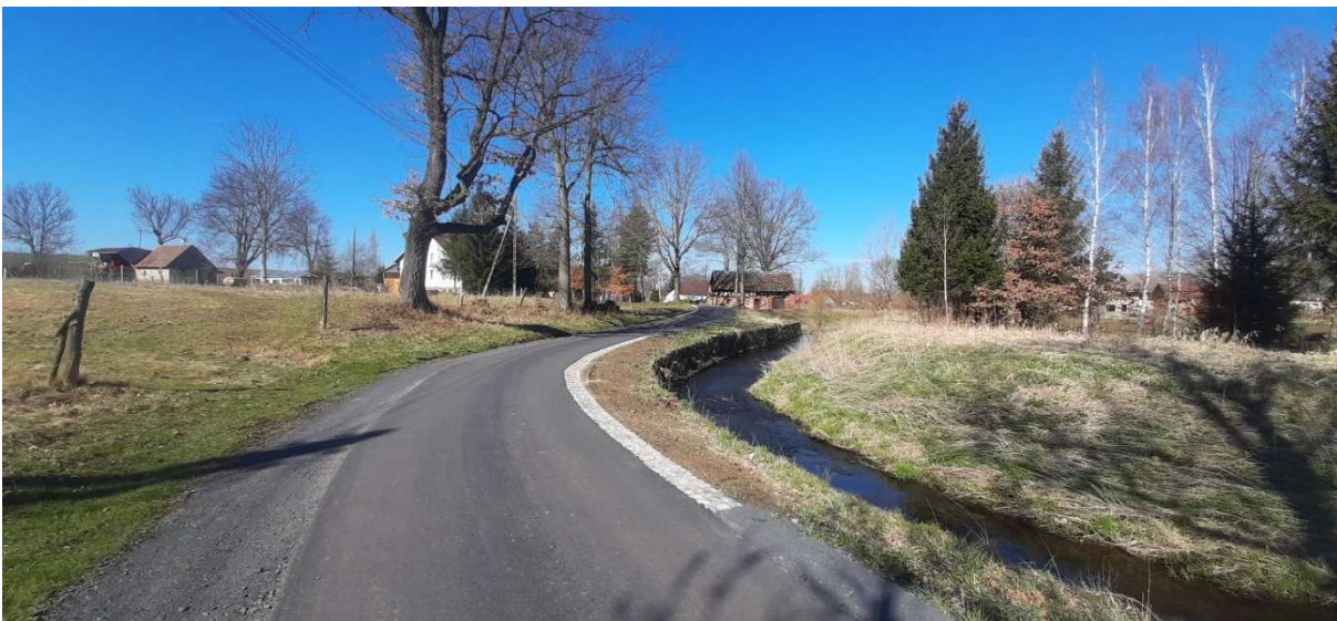
Fot. Przebudowana droga w miejscowości Oleszna Podgórska