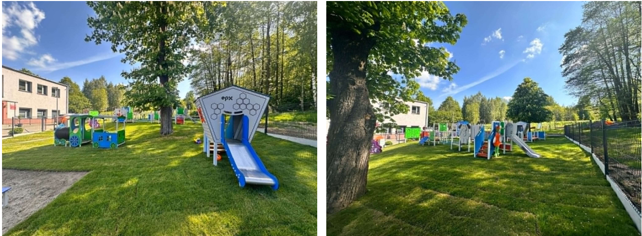
Fot. Doposażenie placu zabaw przy Żłobku Gminnym "Wojtusiowa Kraina" w Wojciechowie”

Inwestycja otrzymała dofinansowanie z programu „Aktywne Place Zabaw 2025” w kwocie 293 837,50 zł i obejmowała całą wartość zadania. Plac zabaw przy żłobku gminnym został odebrany i oddany do użytkowania.