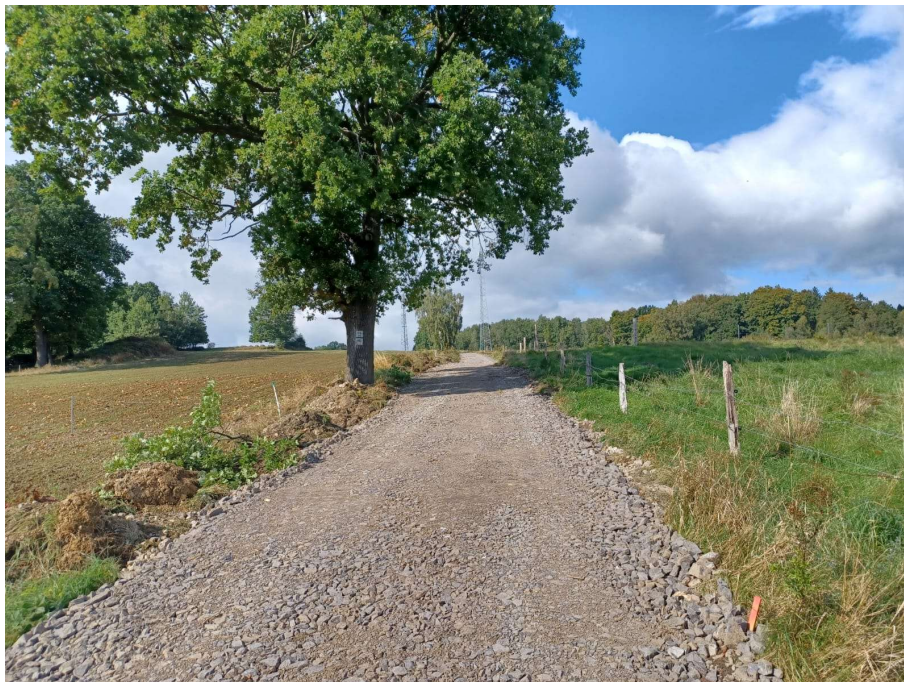
Fot. Droga gminna Janice – Chmieleń podczas przebudowy

19. Przebudowa drogi relacji Wojciechów - Radomice na terenie działek nr 574/2 i 574/3 obręb 0012 Wojciechów. Wartość całego zadania wyniosła 1 466 400,77 zł, a dofinansowanie z Rządowego Funduszu Rozwoju Dróg (RFRD) pokryło całość kosztów inwestycji tj. 1 466 400,77 zł. Zadanie jest w trakcie realizacji. Planowane zakończenie zgodnie z umową to wrzesień 2026.