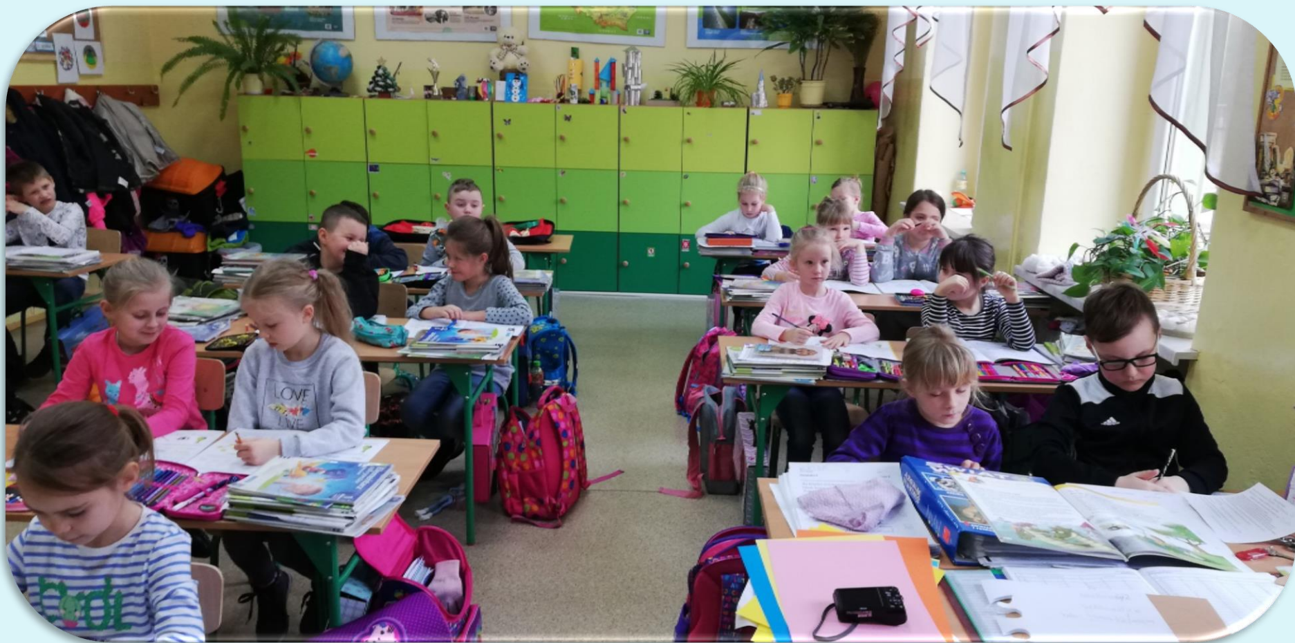
Pierwszaki podczas zajęć lekcyjnych – luty 2019.