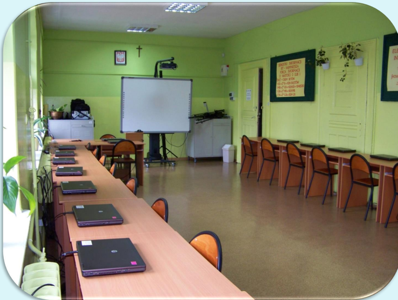
Pracownia informatyczna nr 11