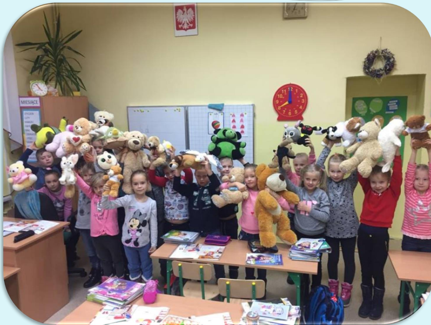
Dzień Pluszowego Misia – klasa IV