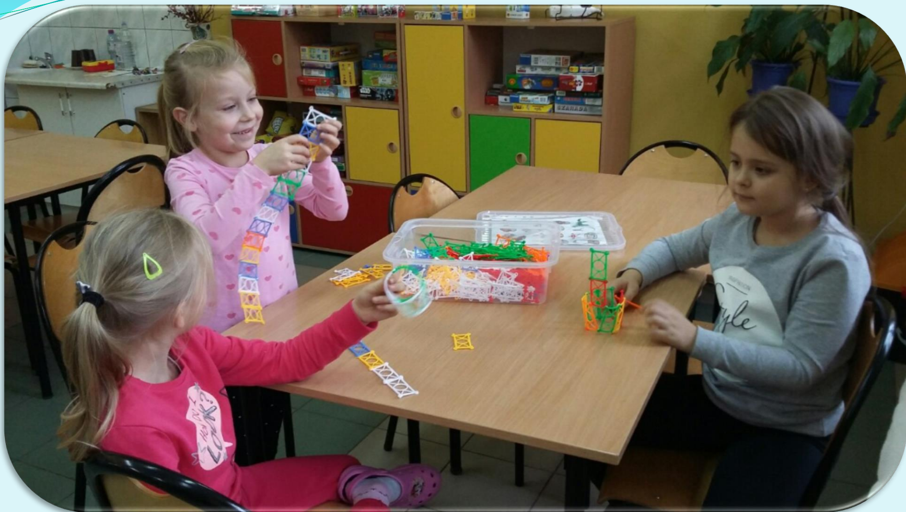
Zajęcia pierwszoklasistów w świetlicy szkolnej.