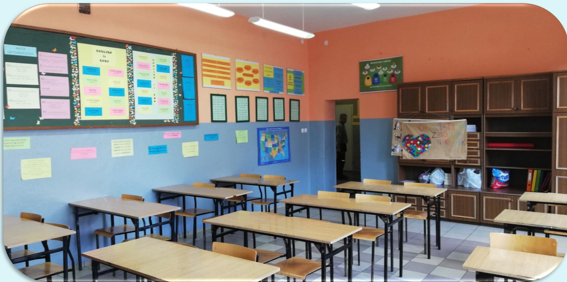
Pracownia języka angielskiego nr 15