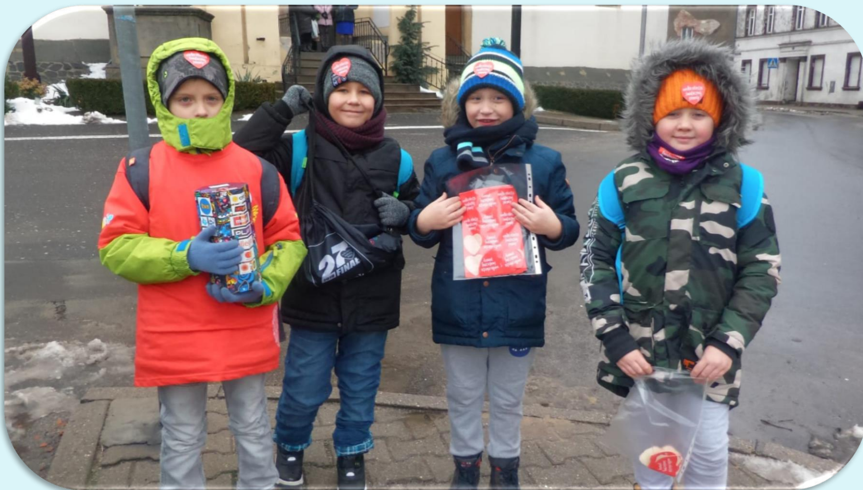
Klasa I podczas Wielkiej Orkiestry Świątecznej Pomocy.