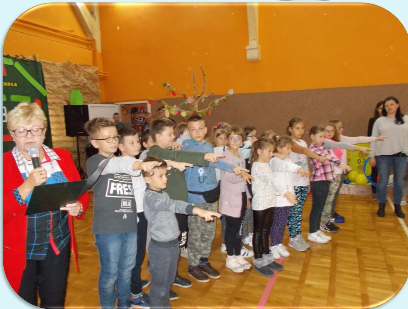
Otrzęsiny klas IV i VII