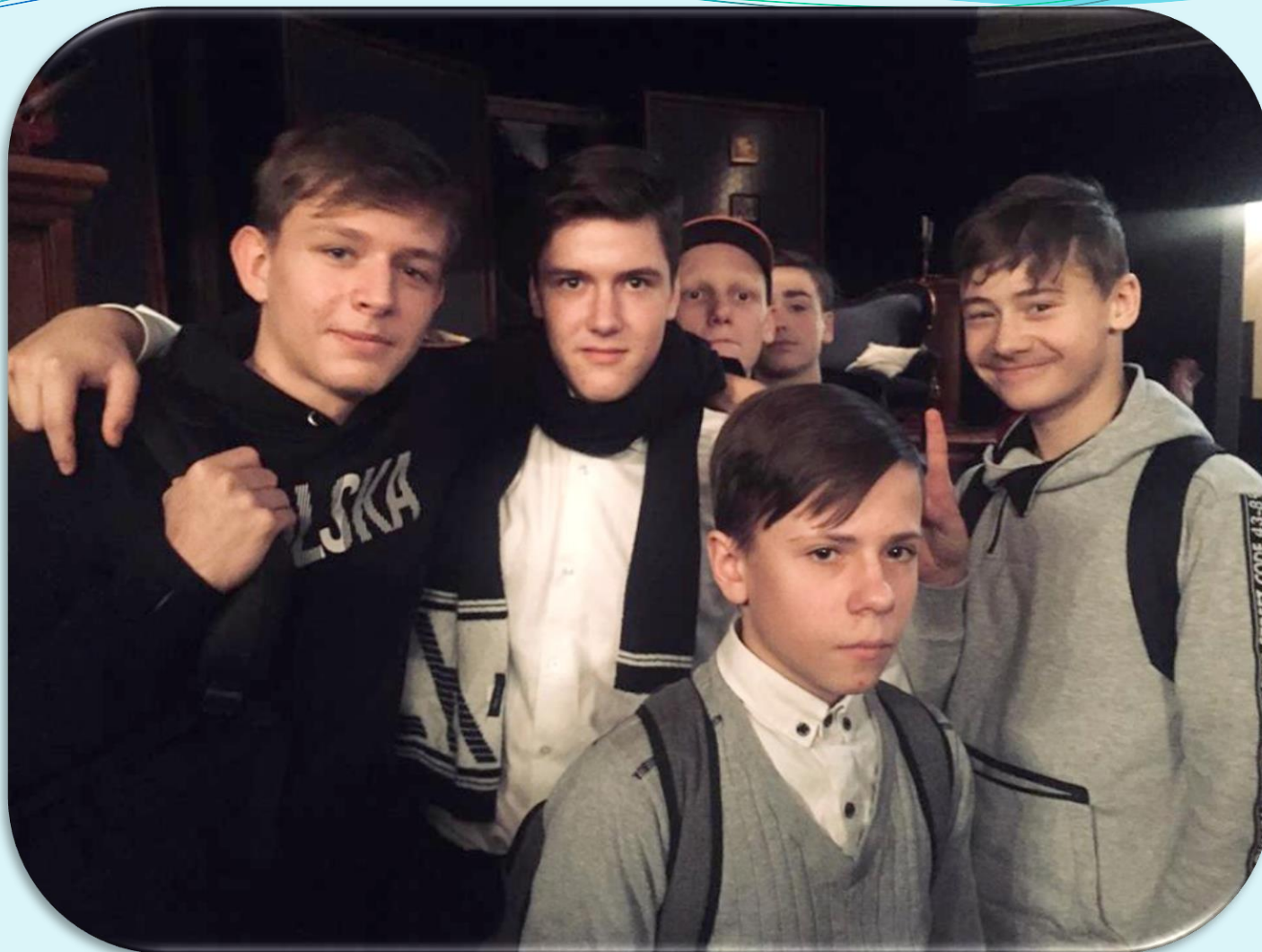
Wycieczki szkolne w roku szkolnym 2018/192019 r. Teatr Norwida w Jeleniej Górze