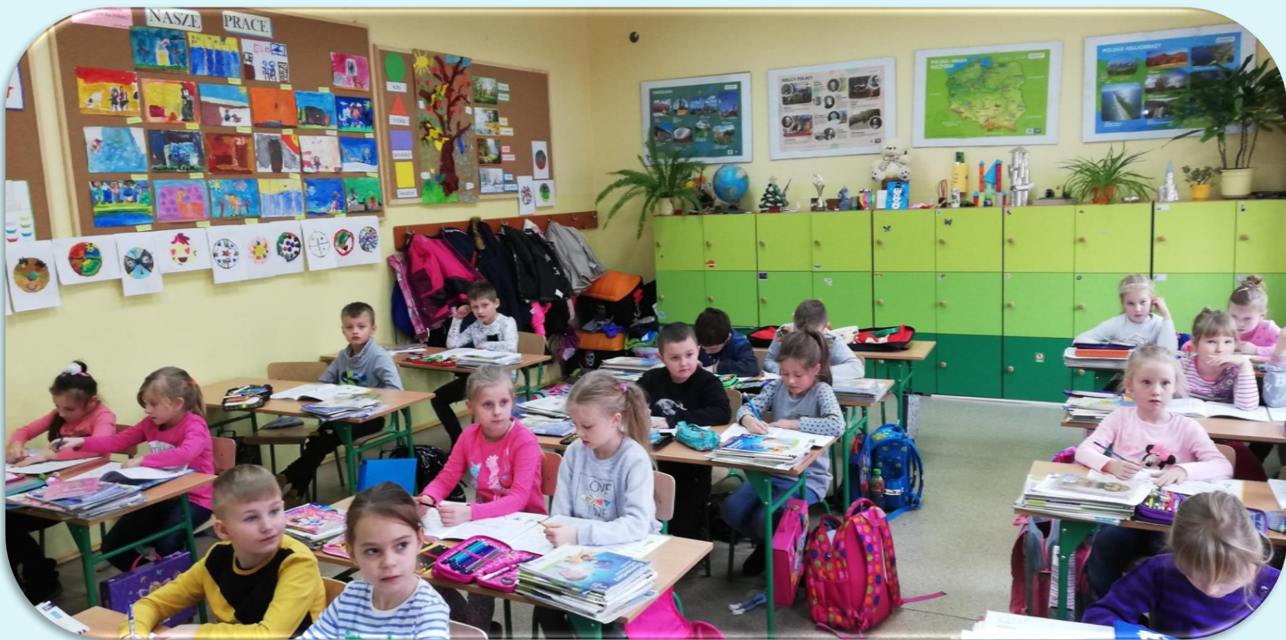
Pierwszaki podczas zajęć lekcyjnych – luty 2019.