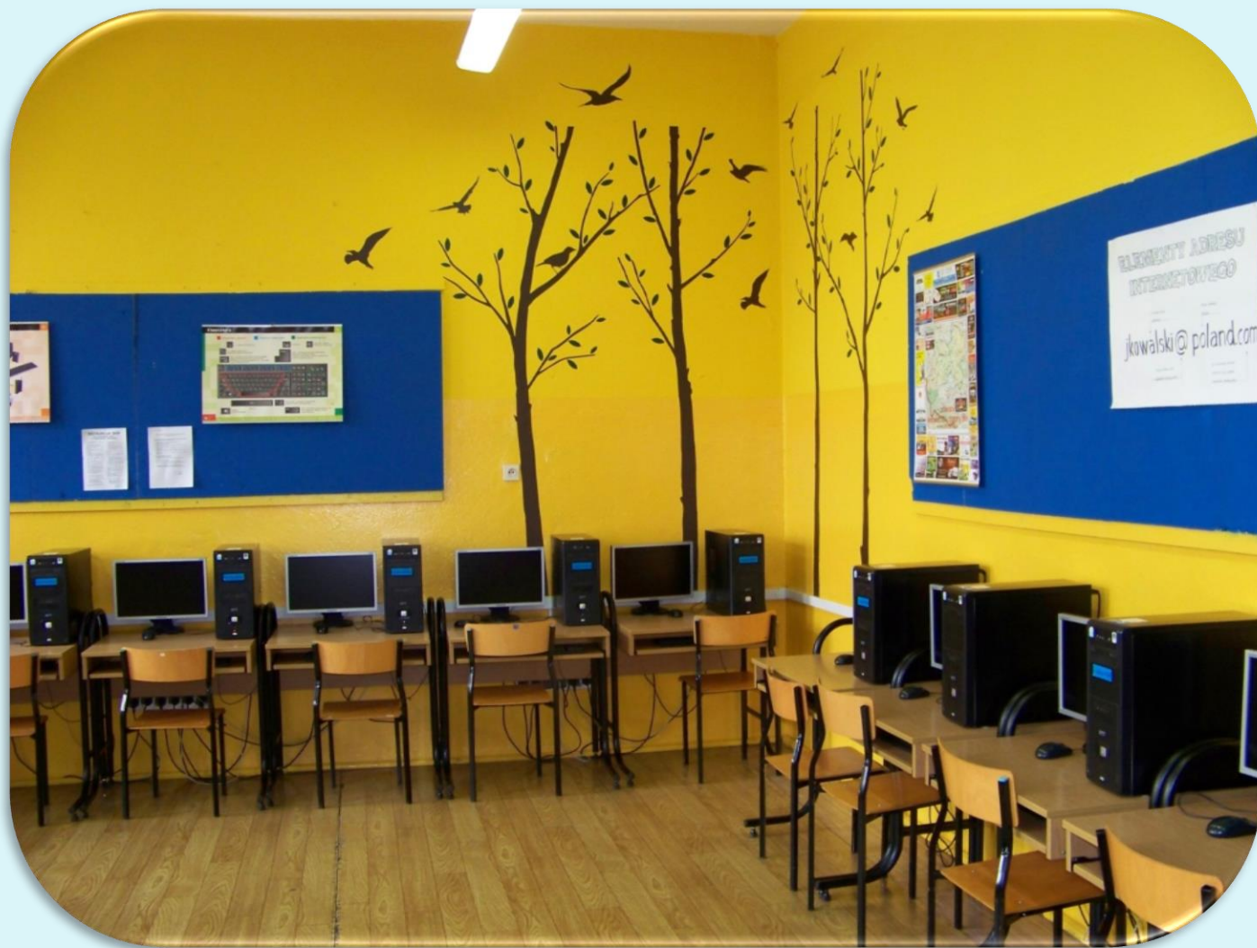
Pracownia informatyczna nr 32