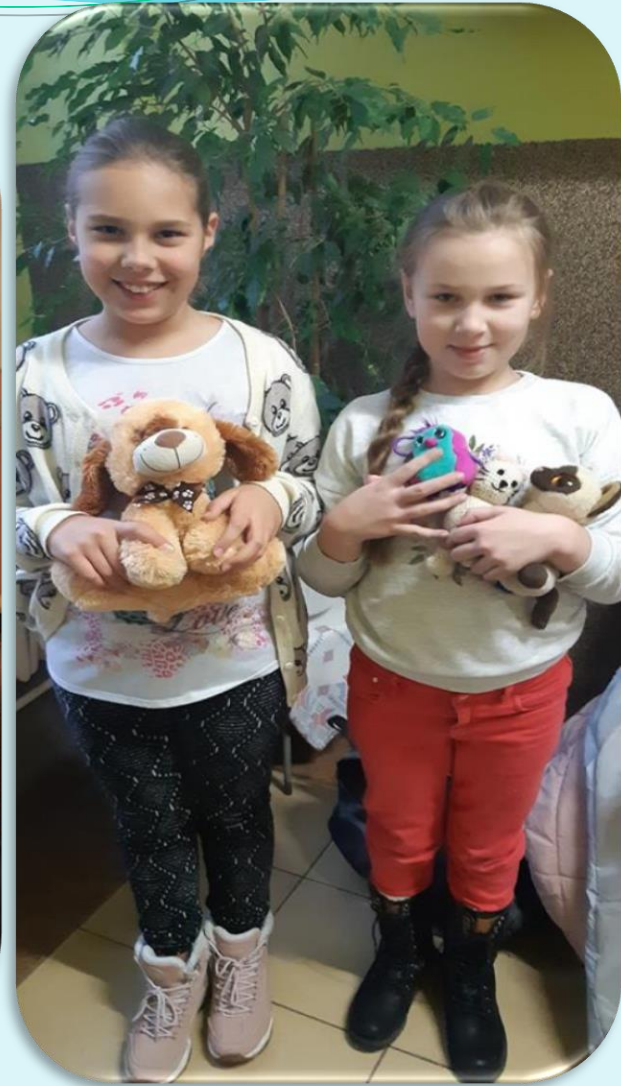
Dzień Pluszowego Misia – klasa IV