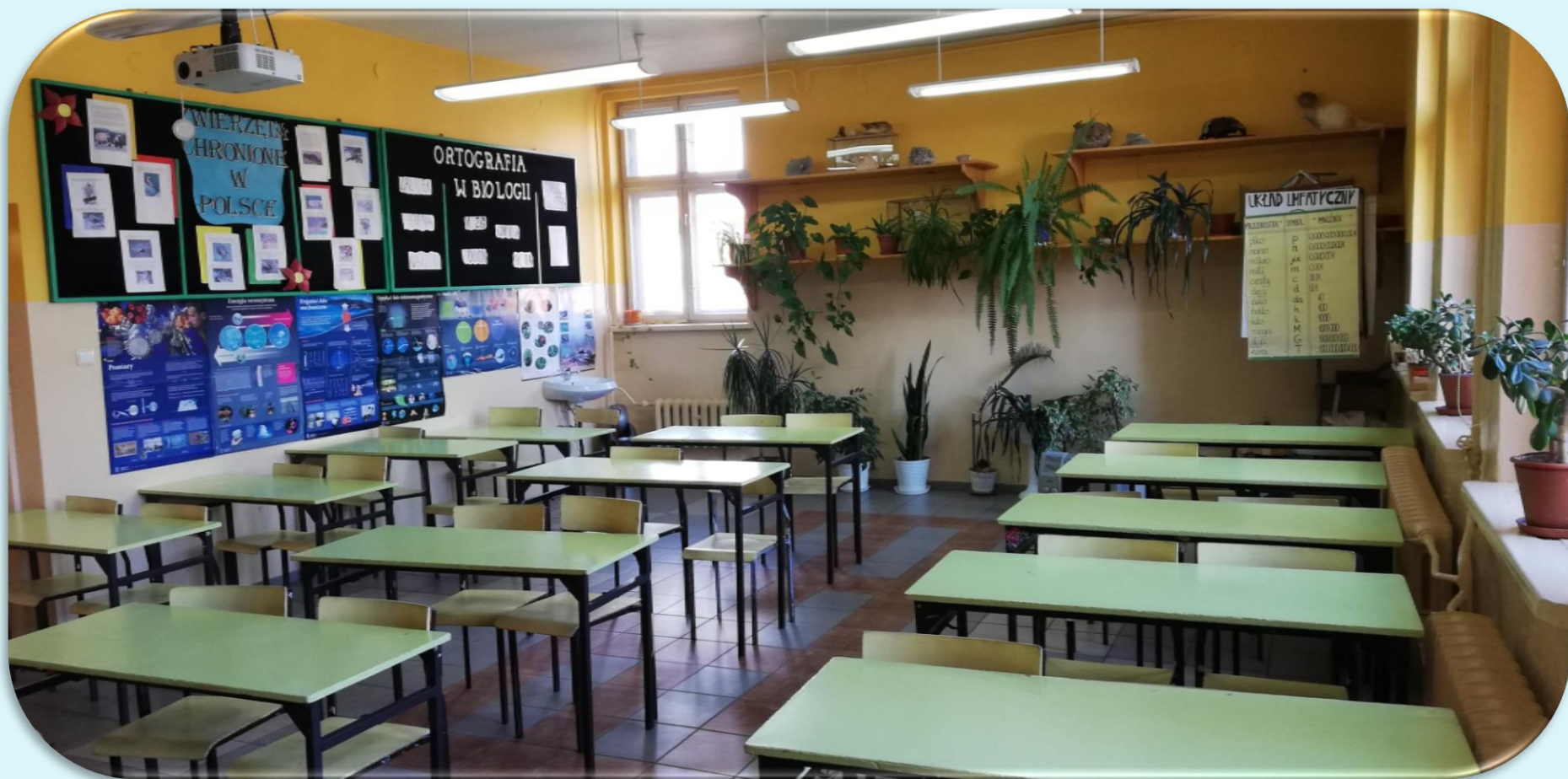
Pracownia biologiczna nr 30