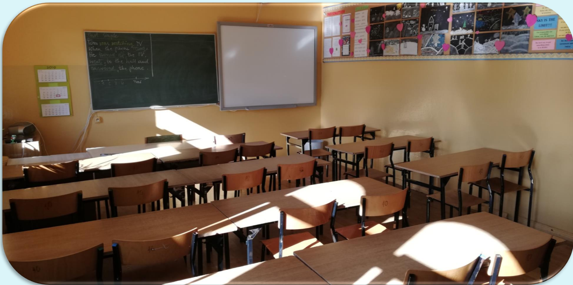
Pracownia języka angielskiego nr 10