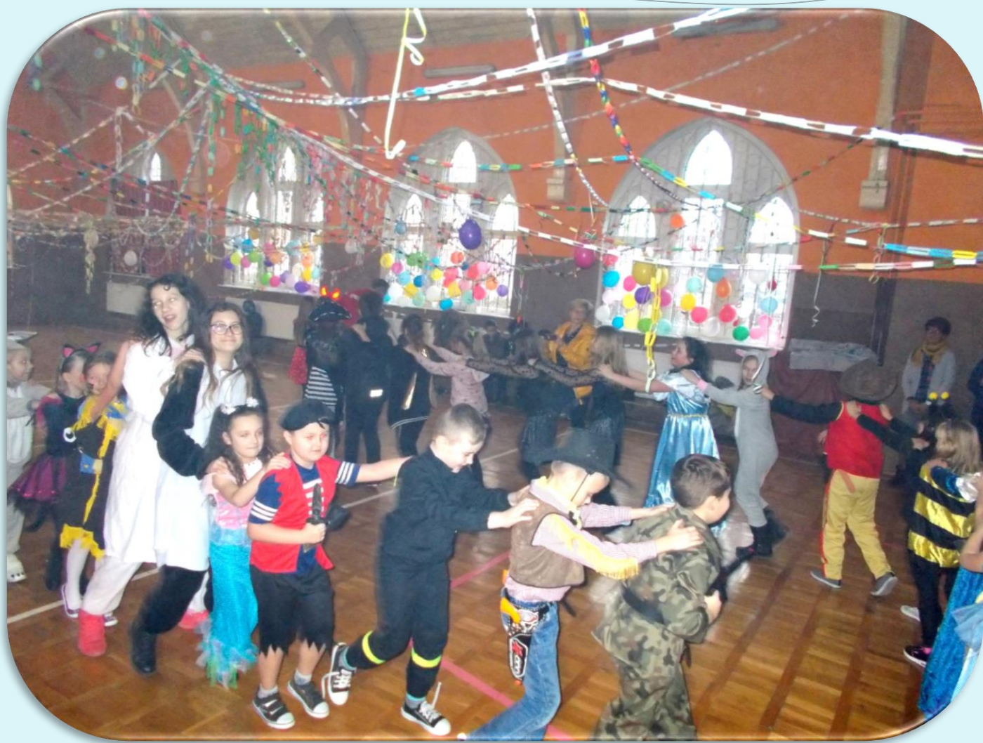
Zabawa Choinkowa 2019 r.