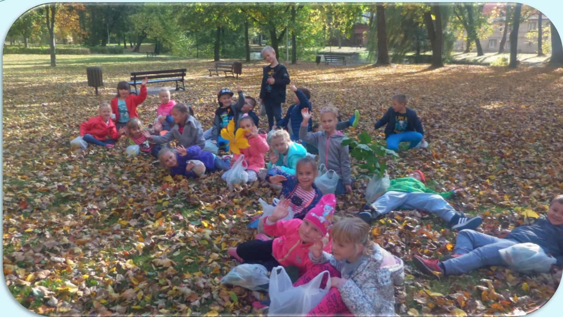
Wycieczka pierwszoklasistów do parku.