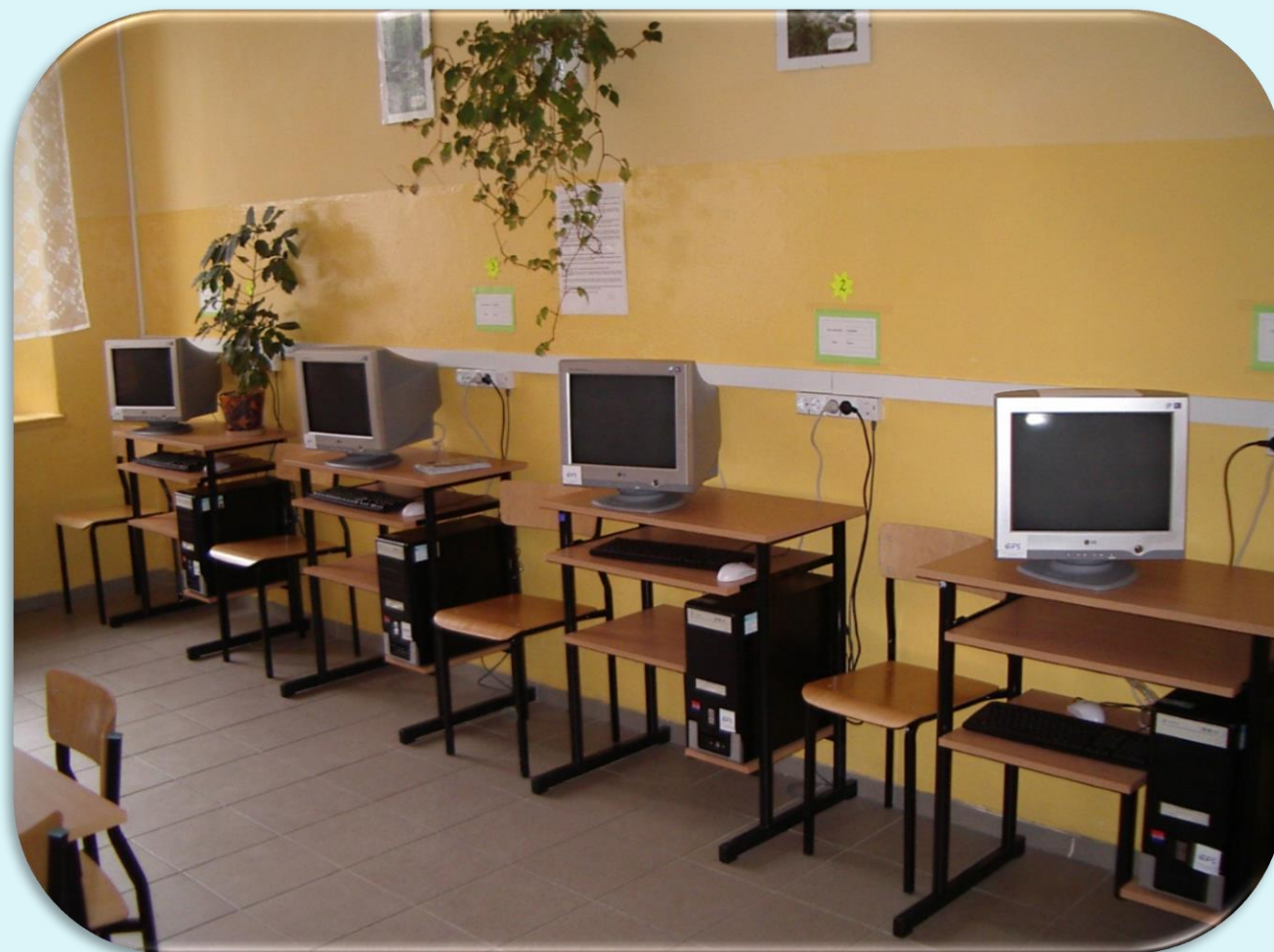
Komputery w bibliotece szkolnej.