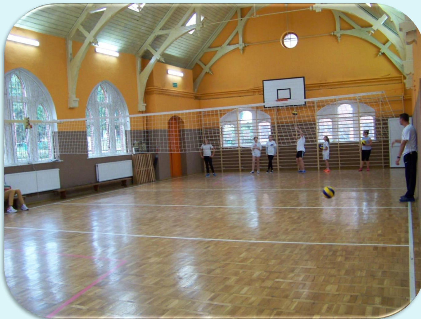
Odnowiona sala gimnastyczna.