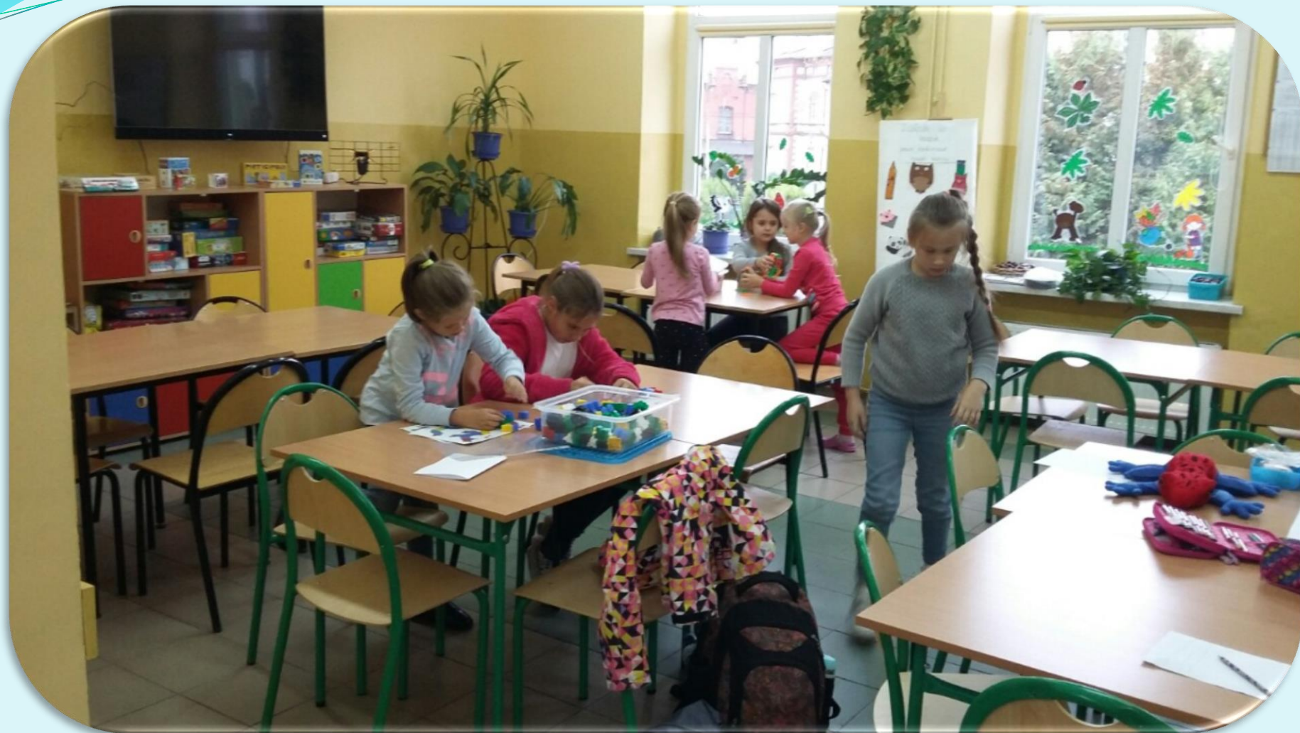
Zajęcia pierwszoklasistów w świetlicy szkolnej.