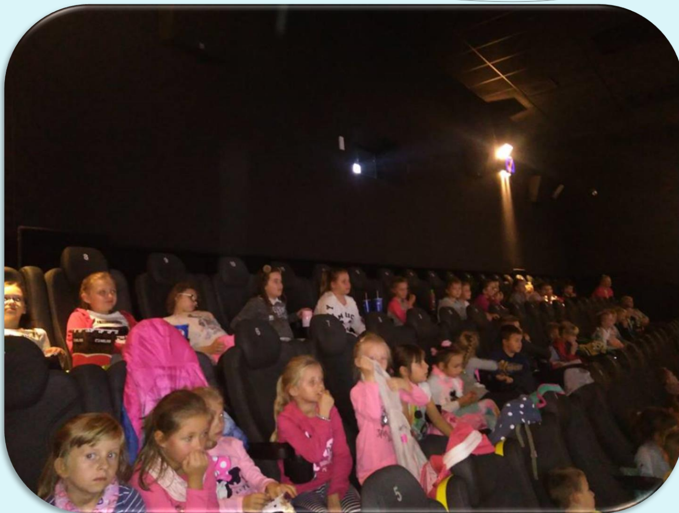
Edukacja filmowa. Wyjazd do kina w Jeleniej Górze