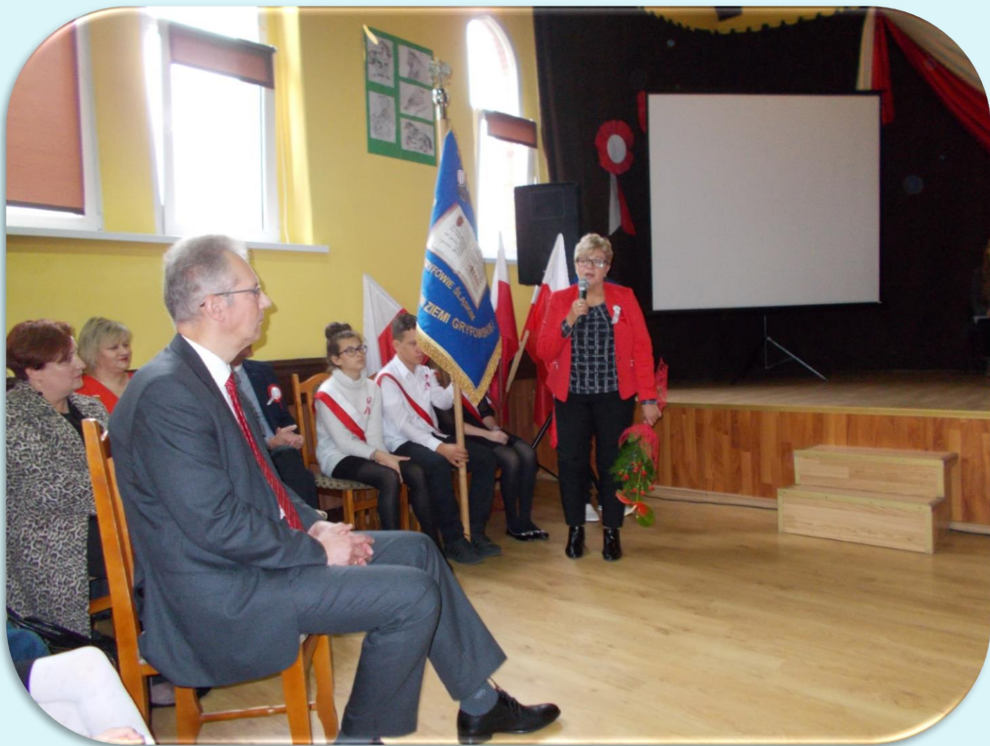
Uroczystość Narodowego Święta Niepodległości 2018 w auli szkoły.