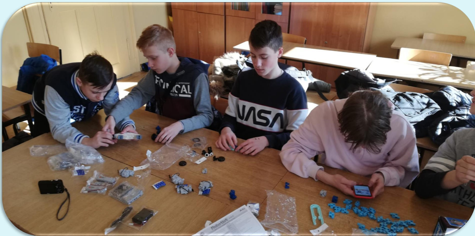
Zajęcia z robotyki w klasie VII.