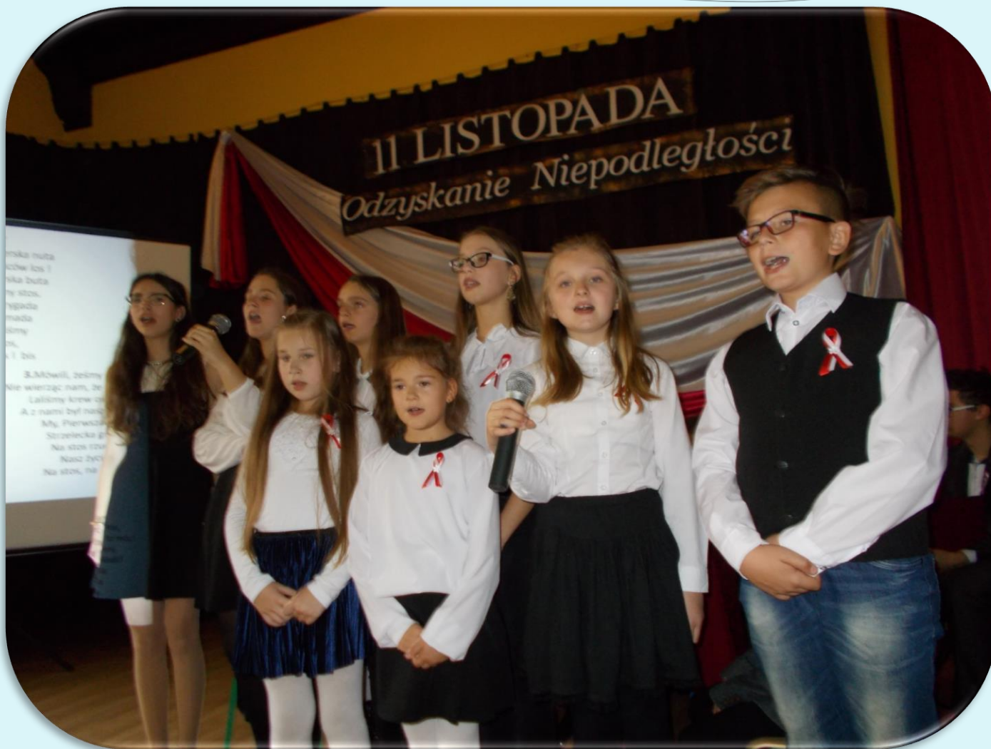
Narodowe Święto Niepodległości 11.11.2018 r.