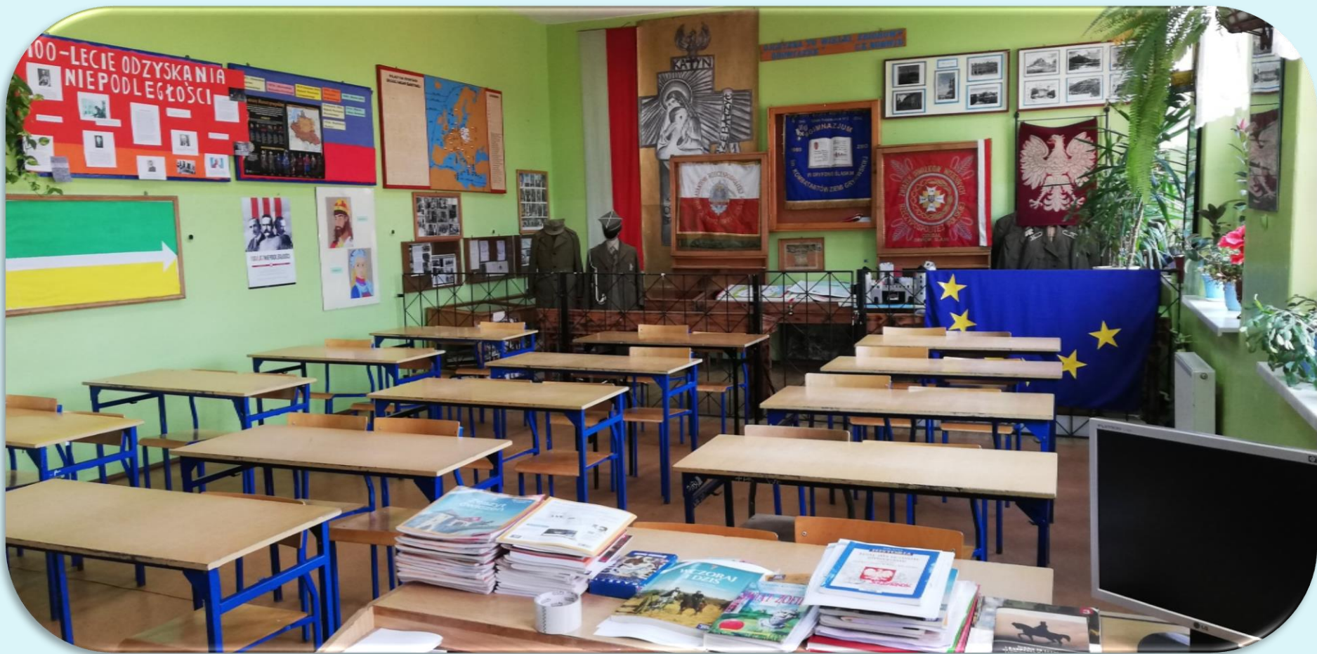
Pracownia historyczna 33