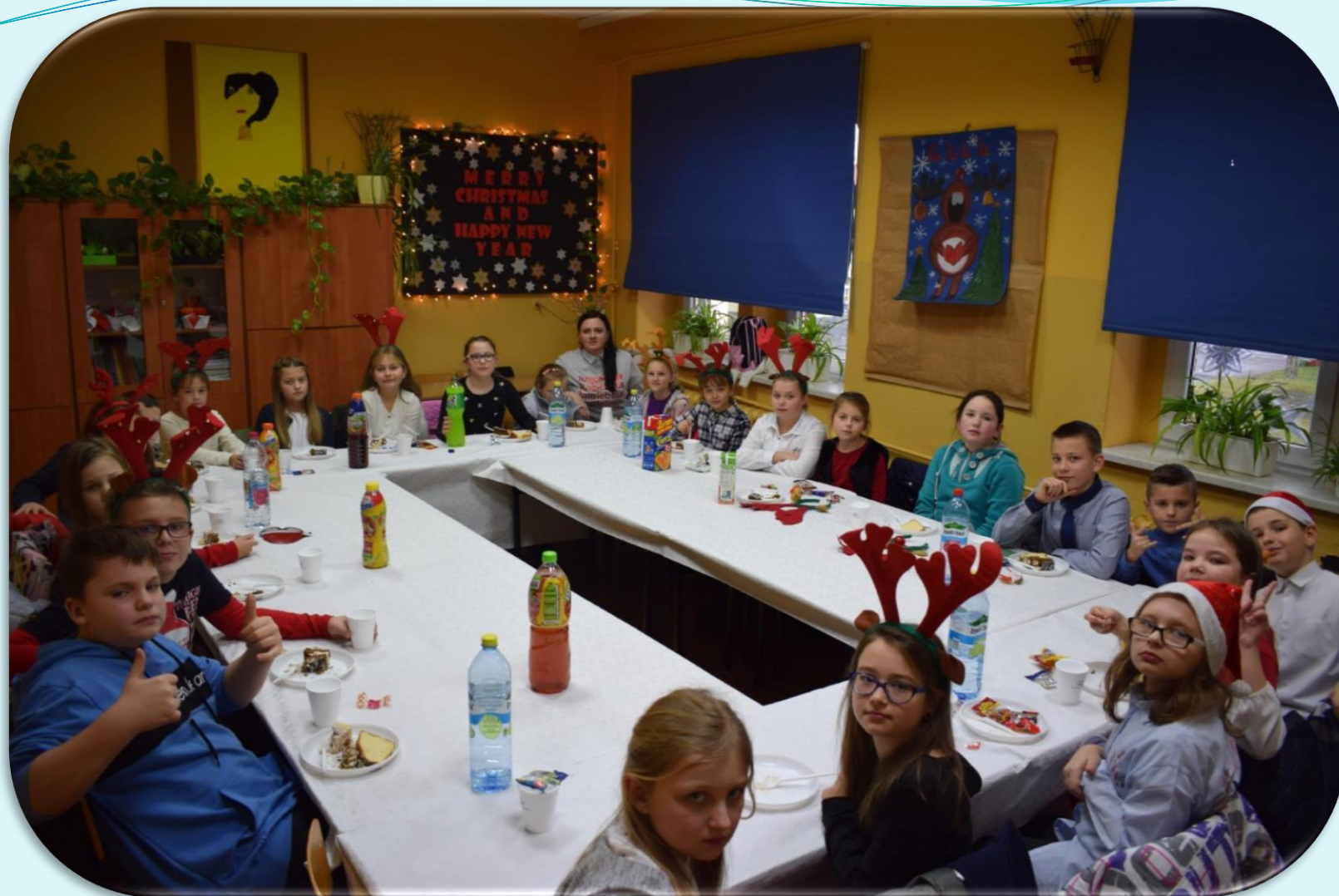
Wigilia w klasie IV – grudzień 2018