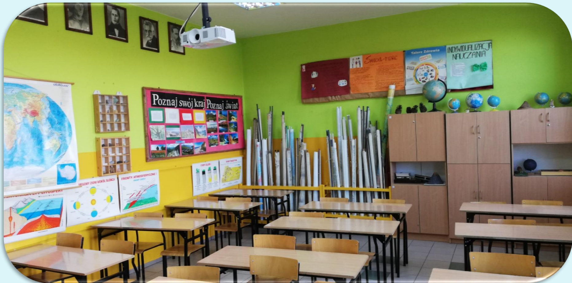
Pracownia geografii nr 1