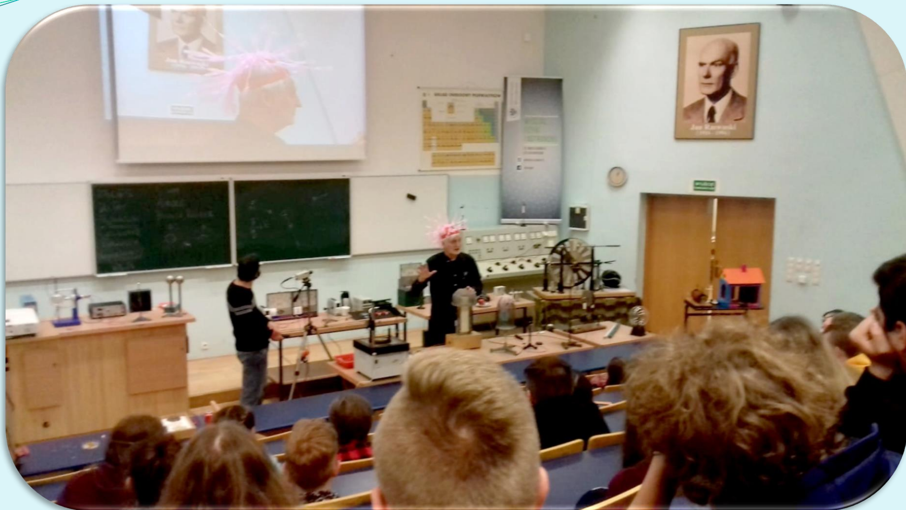
Wyjazd klasy VII z gimnazjalistami na wykłady z fizyki na Uniwersytecie Wrocławskim