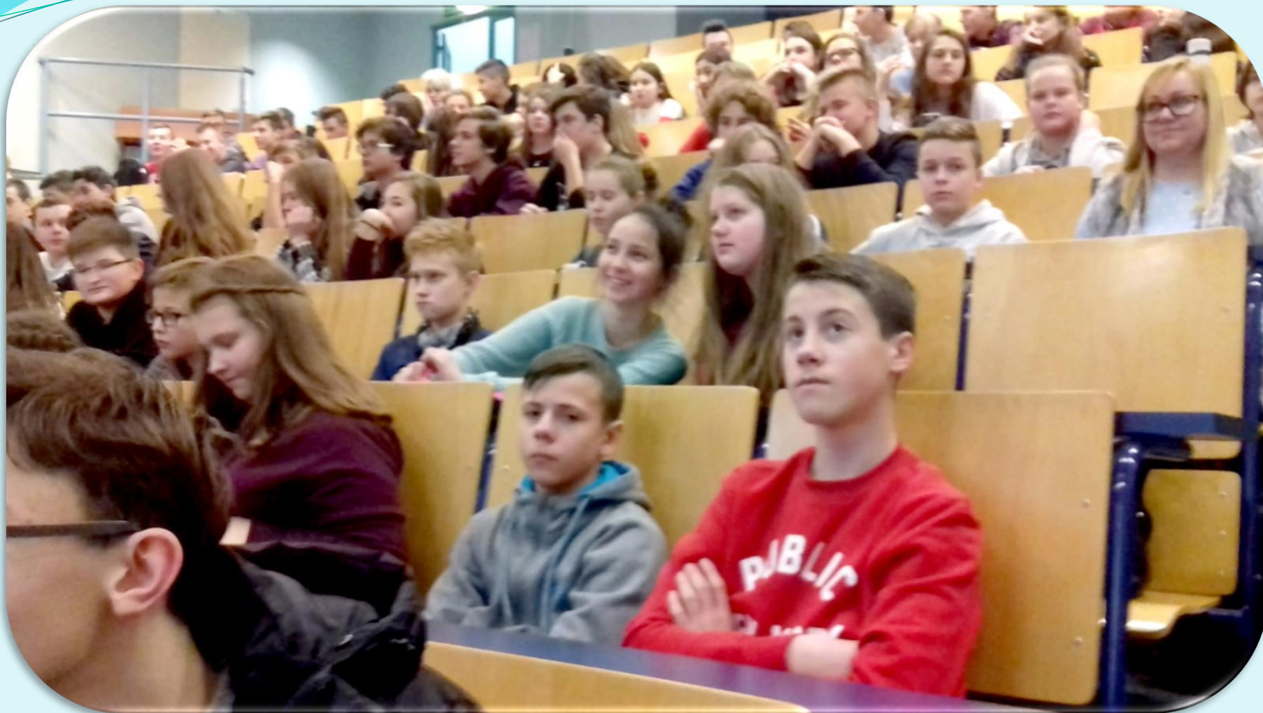
Wyjazd klasy VII z gimnazjalistami na wykłady z fizyki na Uniwersytecie Wrocławskim