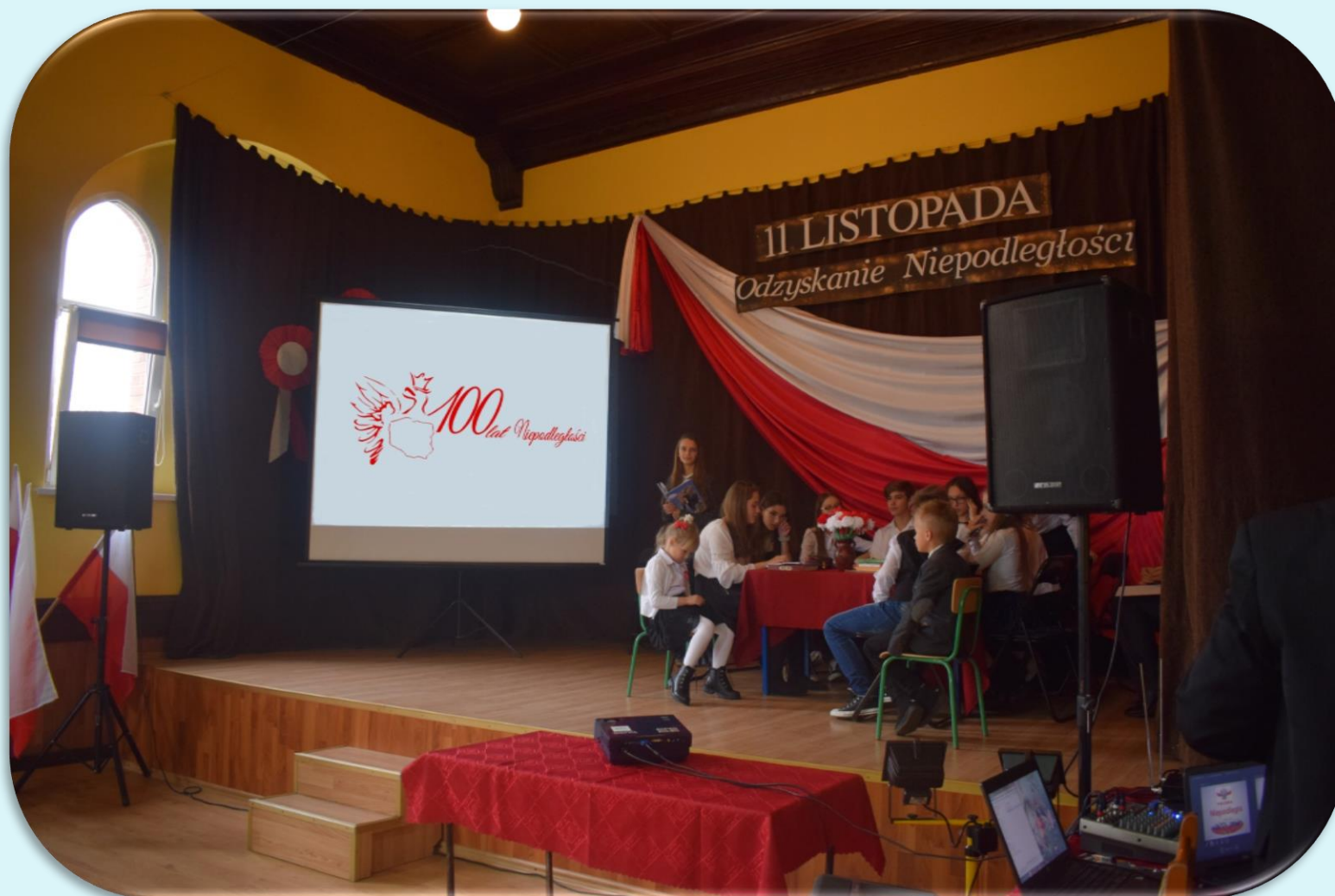
Scena z dekoracją w auli szkoły.