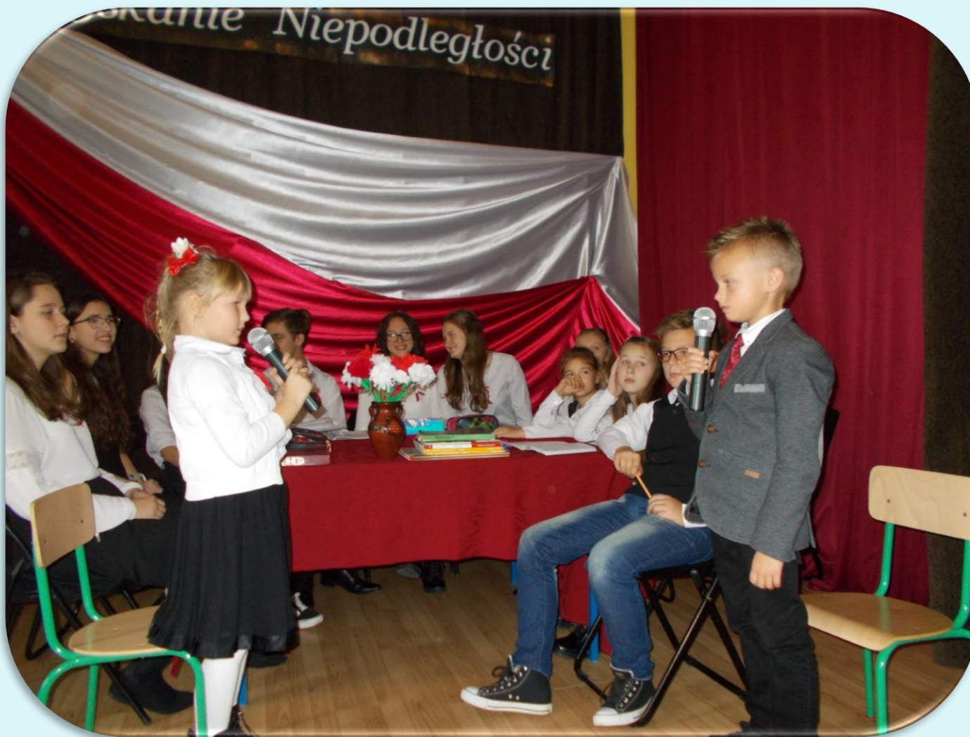
Narodowe Święto Niepodległości 11.11.2018 r.