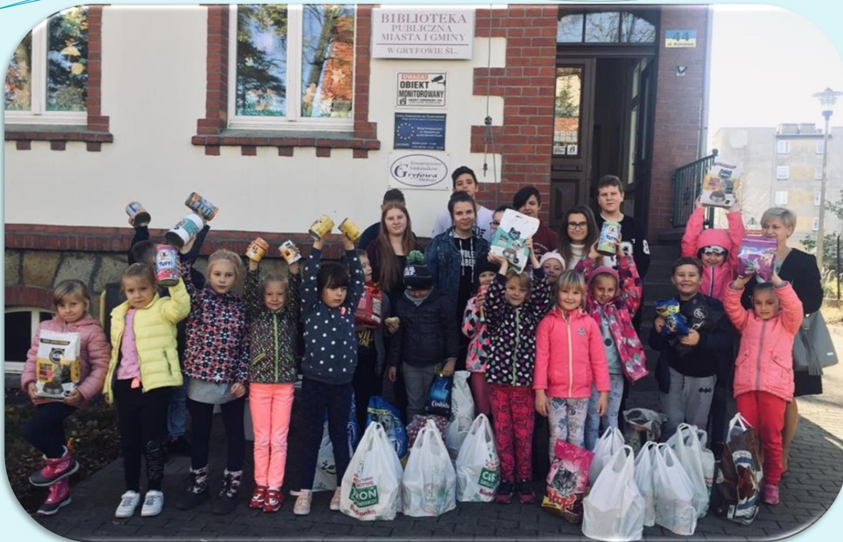
Zbieranie karmy dla zwierząt.