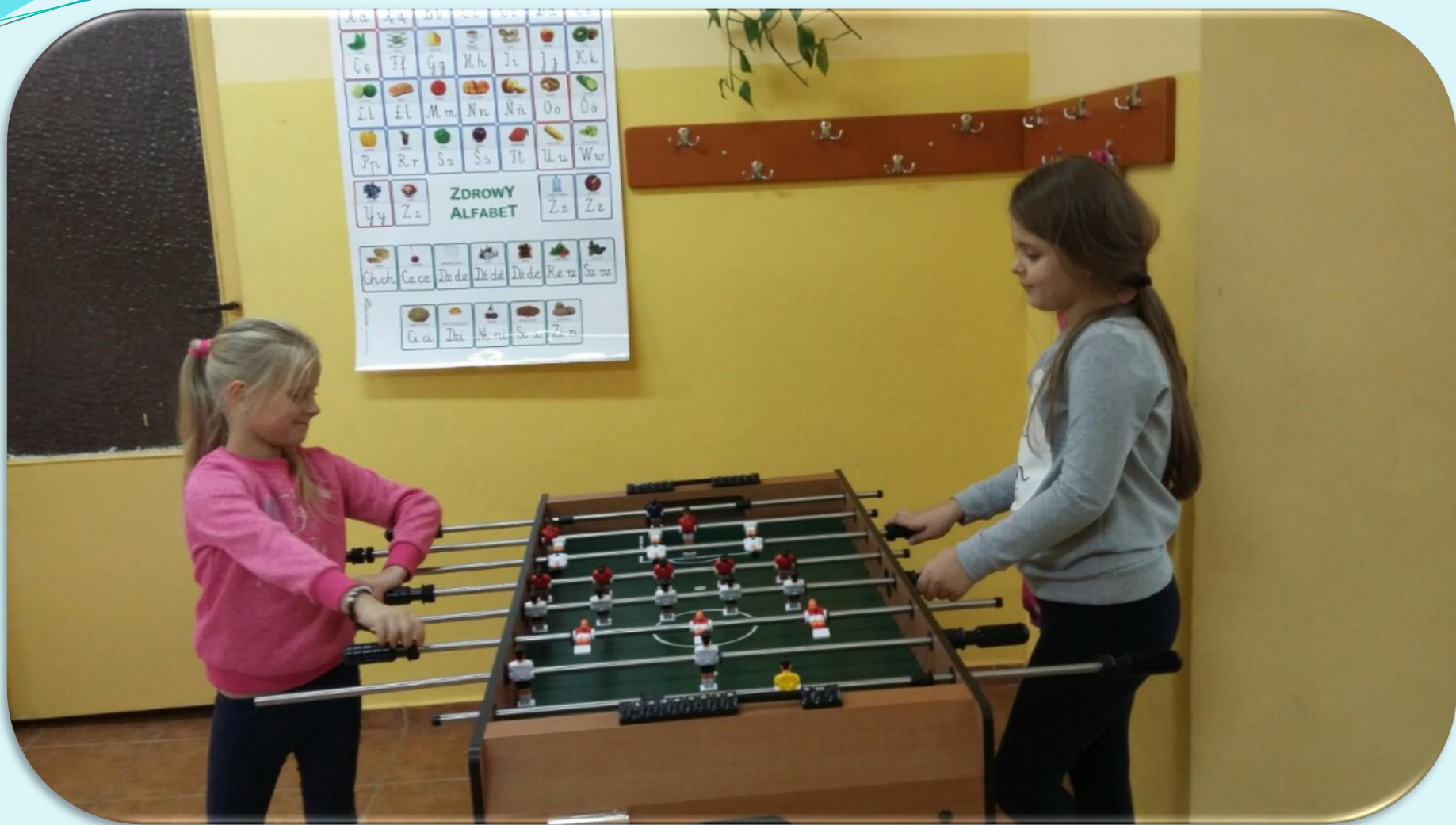
Zajęcia pierwszoklasistów w świetlicy szkolnej.