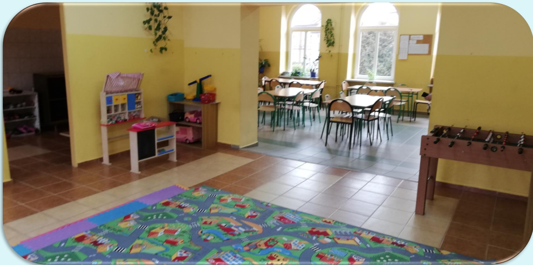
Miejsce zabaw w świetlicy szkolnej