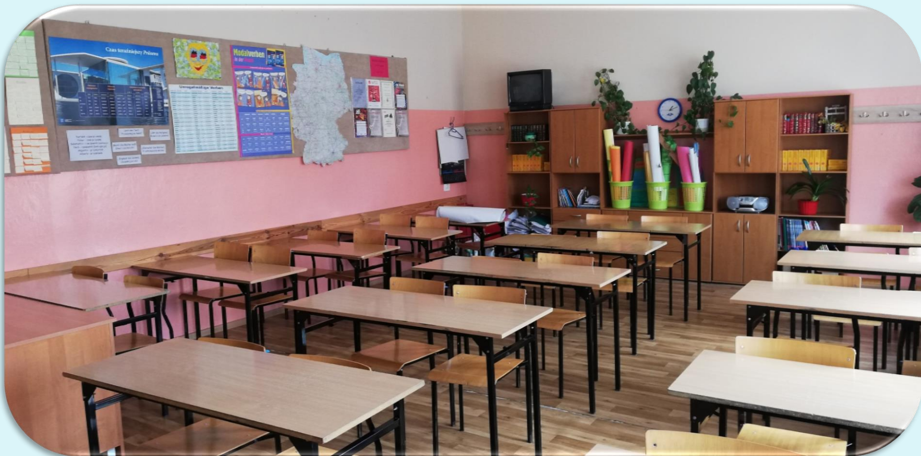
Pracownia matematyczna nr 22