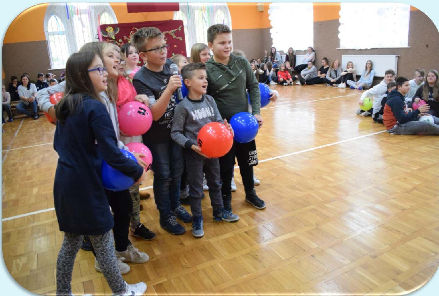
Otrzęsiny klas IV i VII