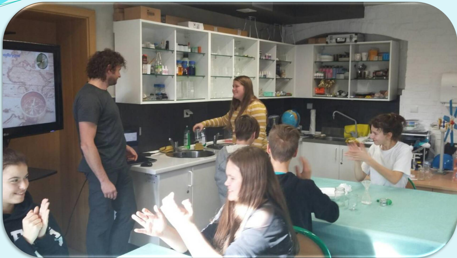
Wycieczka do Sudeckiej Zagrody Edukacyjnej w Dobkowie