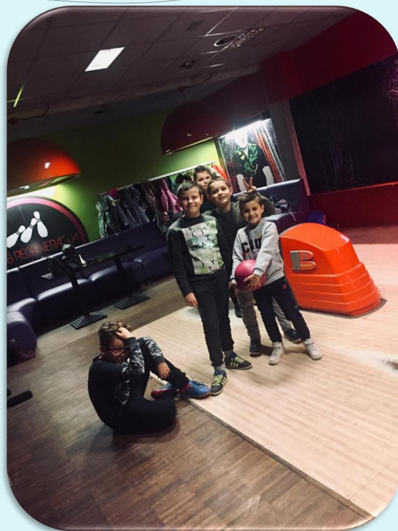
Wyjazd klasy IV na kręgle do Zgorzelca