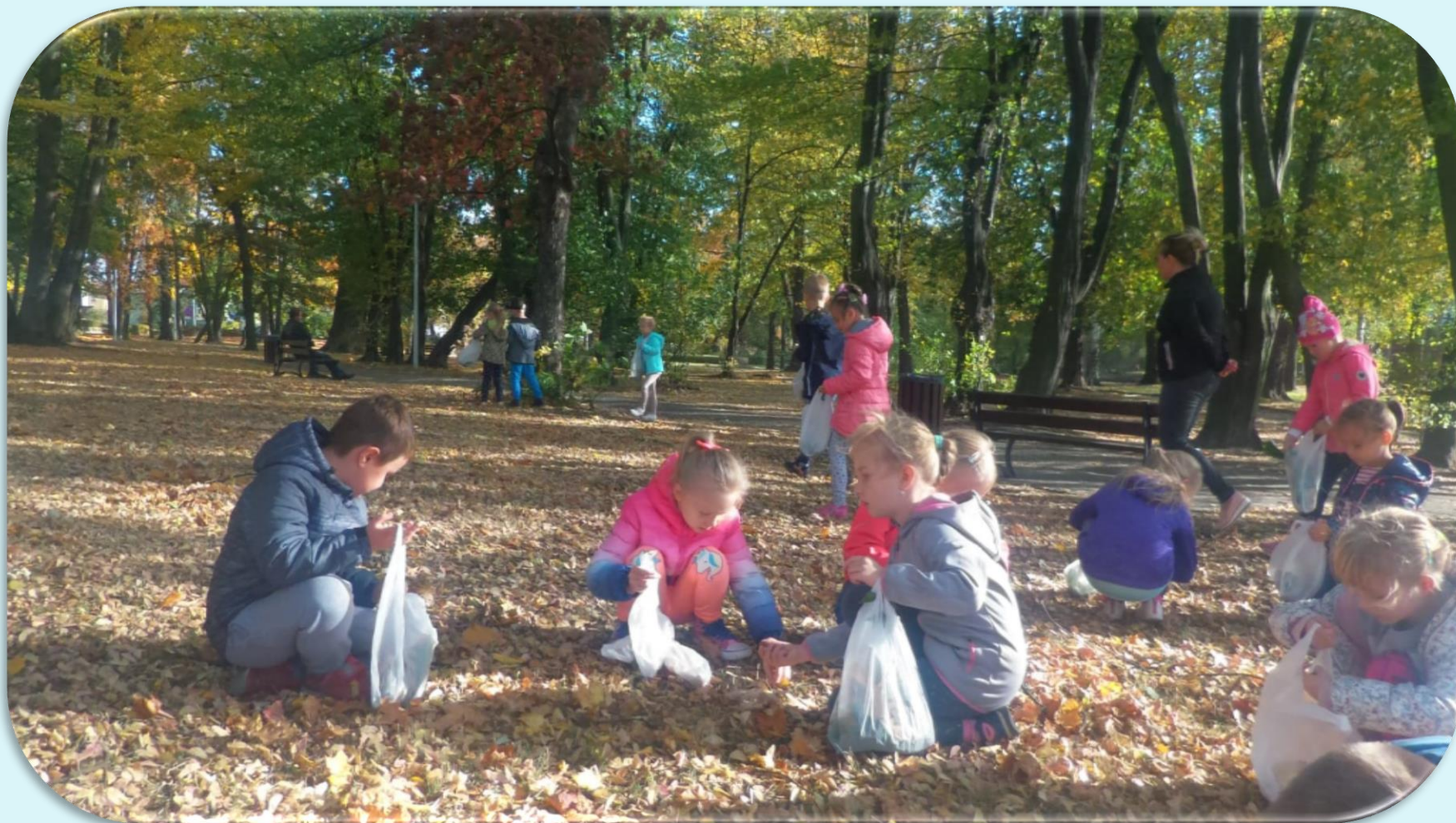
Wycieczka pierwszoklasistów do parku.