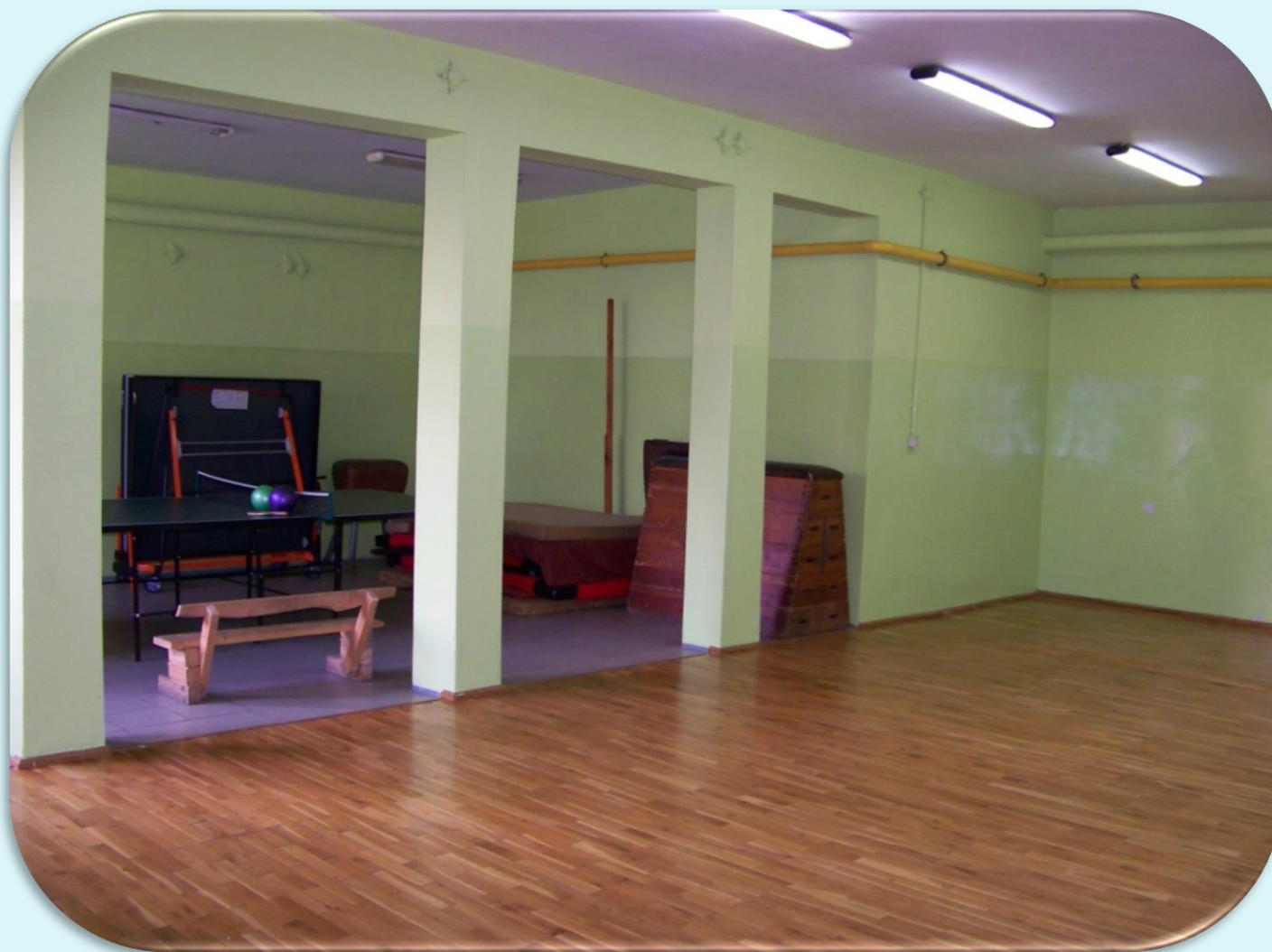
Mała sala gimnastyczna.