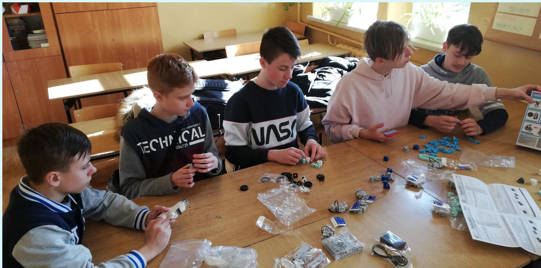
Zajęcia z robotyki w klasie VII.