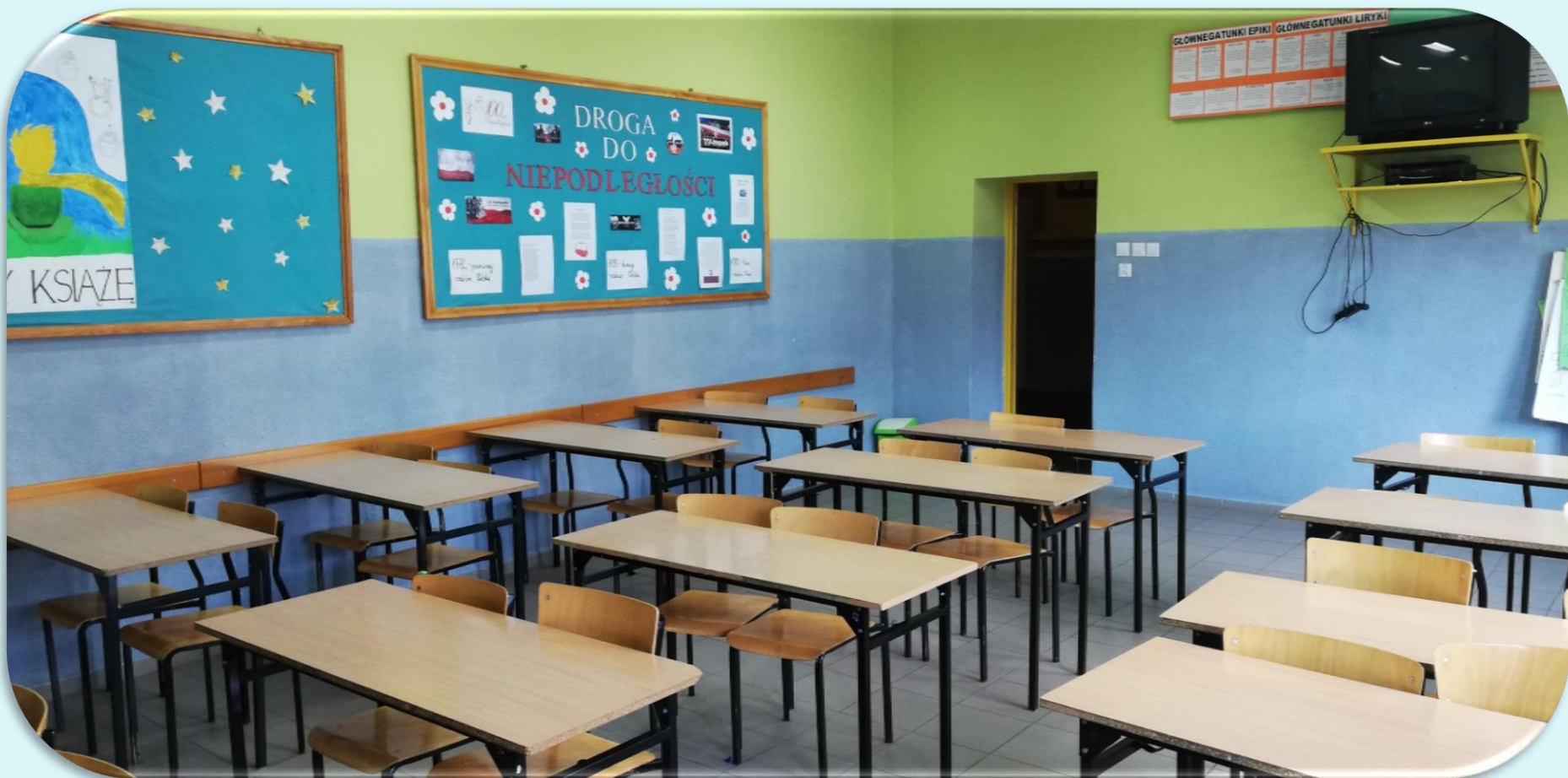
Pracownia języka polskiego nr 21