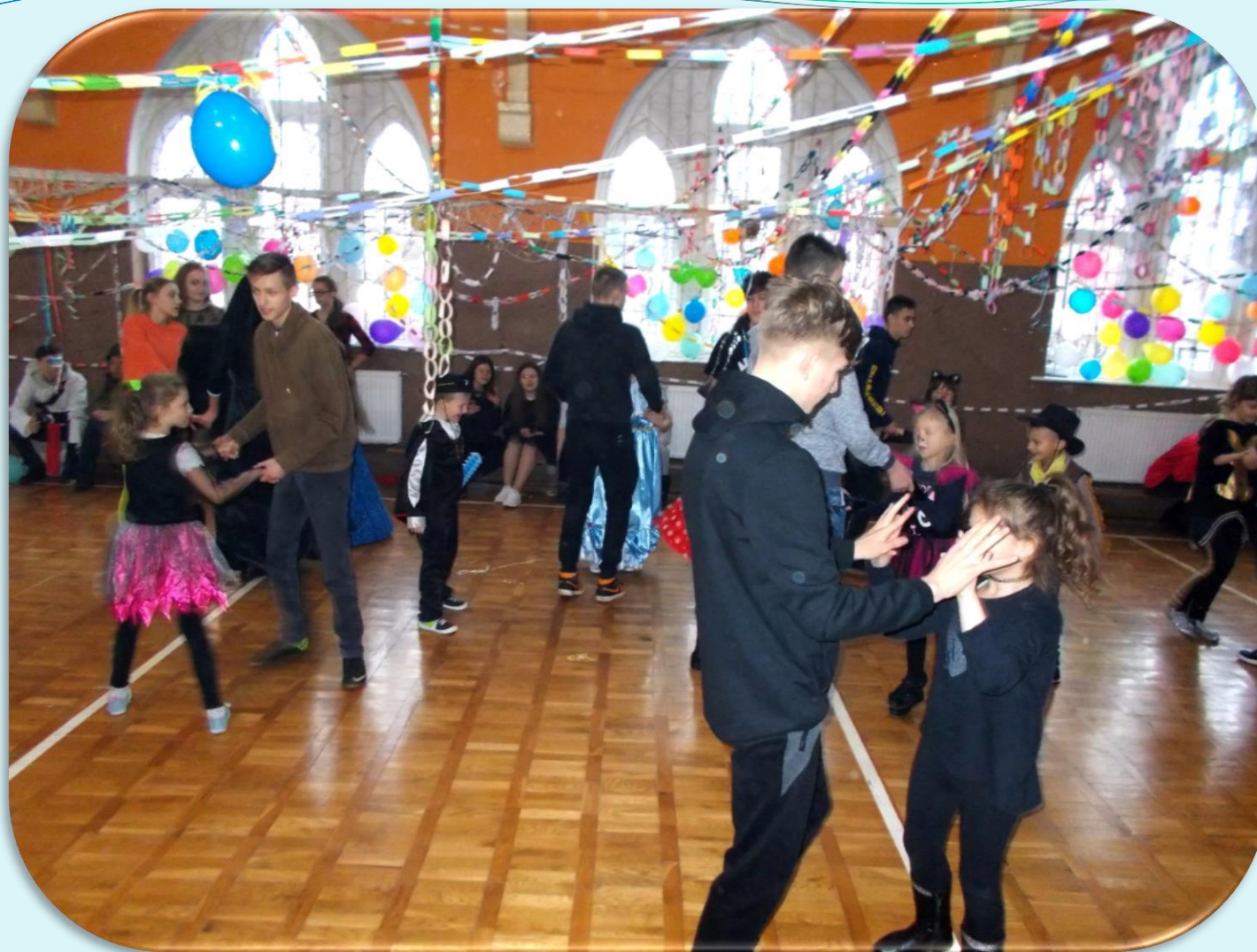
Zabawa Choinkowa 2019 r.