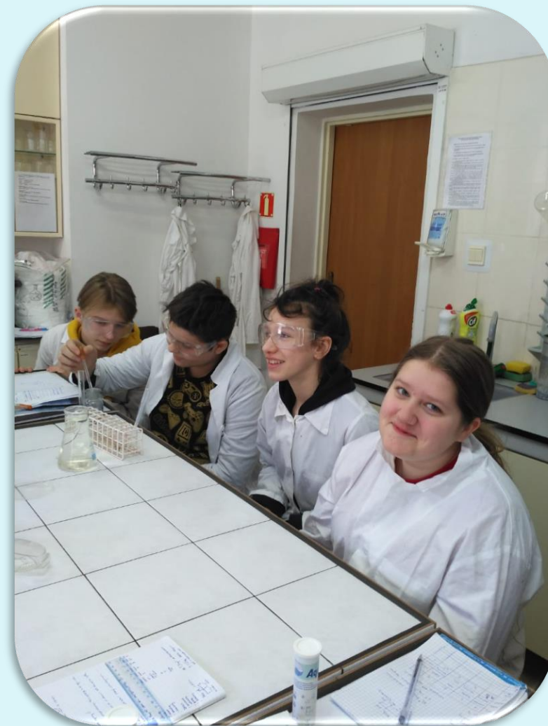
Klasa VII zajęciach chemicznych w Myśliborzu