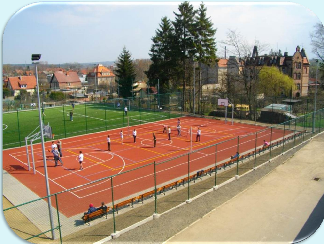
Lekcja w-f na Orliku 2012.