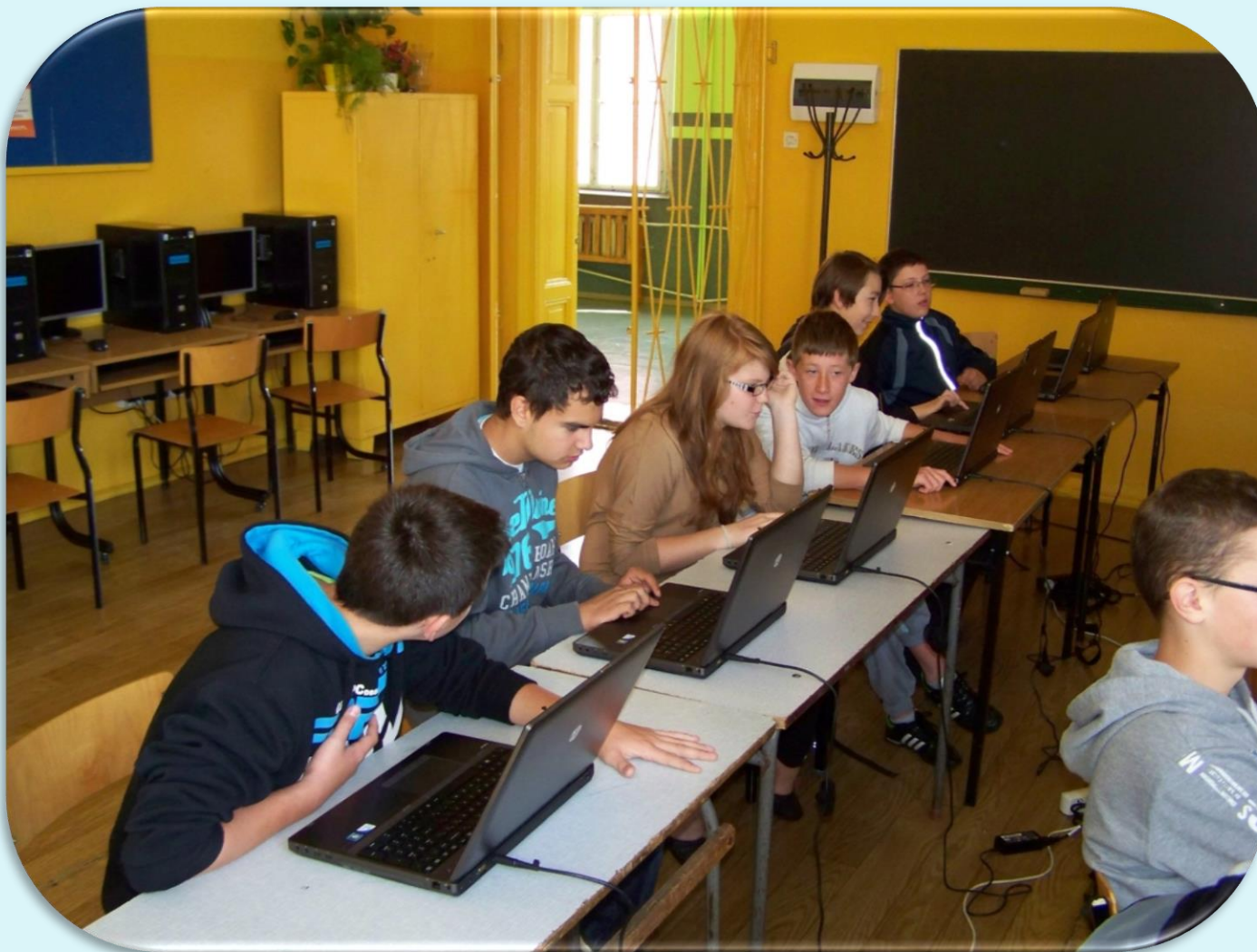
Młodzież podczas lekcji informatyki w sali 32.