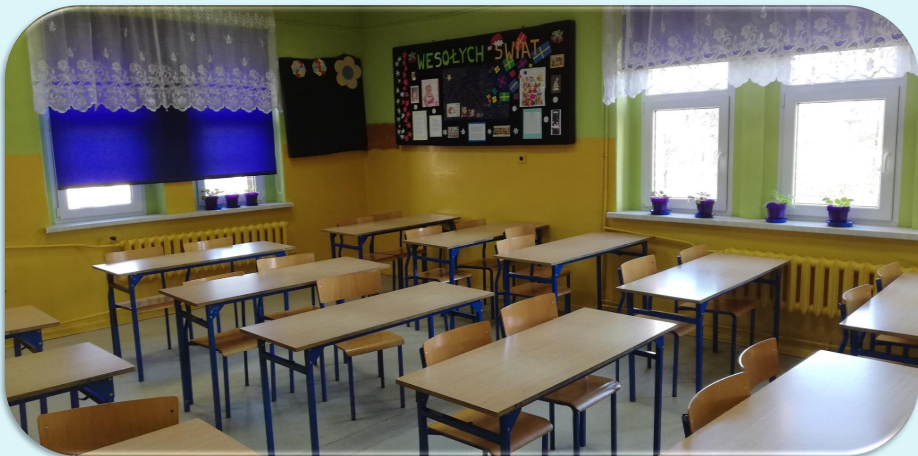
Pracownia matematyczna nr 12