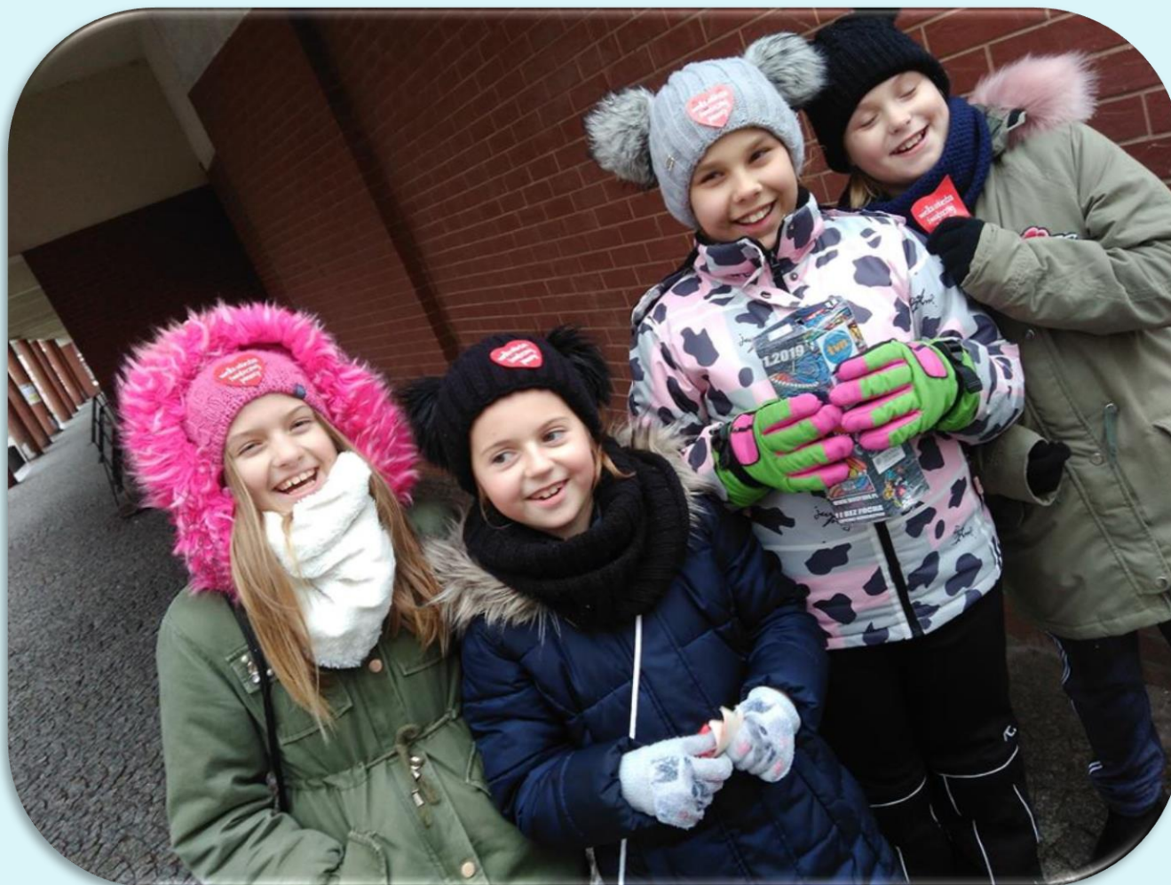
Klasa IV podczas Wielkiej Orkiestry Świątecznej Pomocy.