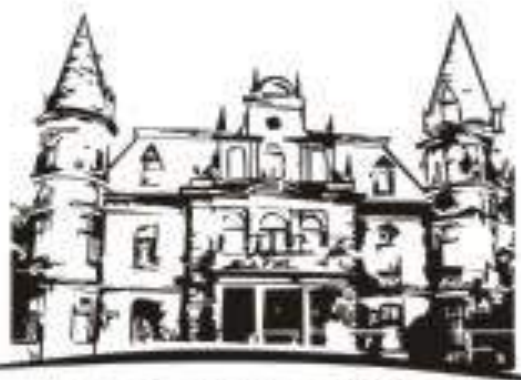
Przedszkole Publiczne w Gryfowie Śl.