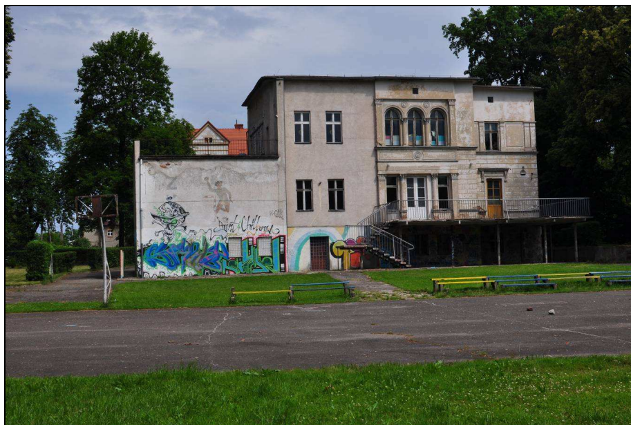
Fot. 1: Budynek Gminnego Ośrodka Kultury w Gryfowie Śląskim. Widok od strony ul. Młyńskiej