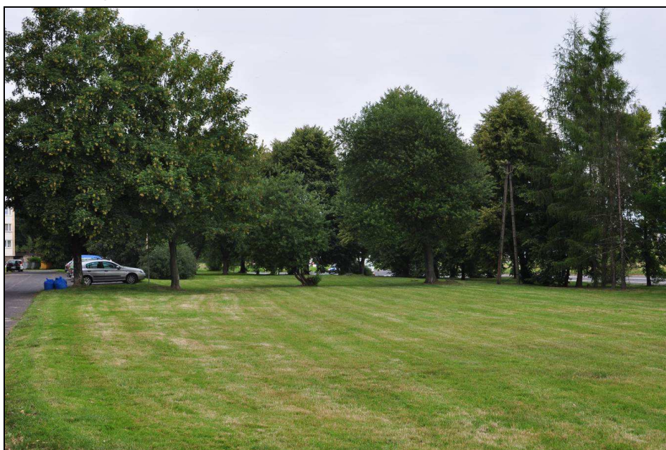
Fot.6: Pas zieleni izolacyjnej pomiędzy blokami przy ul. H. Sienkiewicza a ul. Jeleniogórską (13 VII 2016 r.).

Pomiędzy blokami znajdują się przestrzenie zieleni urządzonej ukształtowane przez trawniki, żywopłoty oraz nasadzenia niewielkich wierzb płaczących, lip szerokolistnych, jesionów, akacji, cyprysików i świerków. Większa przestrzeń takiej zieleni znajduje się między ulicą H. Sienkiewicza i Jeleniogórską, stanowiąc tutaj pas zieleni izolacyjnej. Ważnym jego elementem jest podwójny szpaler drzew rosnących wzdłuż drogi krajowej. Są to lipy szerokolistne i drobnolistne o obwodach pni do 100 cm, klony jawory, jesiony, robinie akacjowe (do 135 cm), dąb czerwony (160 cm), jarząb mączny odm. (140 cm) oraz niewielkie świerki i modrzewie. Dalej od ulicy, na skarpie rośnie grupa lip drobnolistnych, a których największa ma pień o obwodzie 160 cm. Na trawniku tym rosną także klony jawory, w tym odm. purpurowa (do 160 cm), jesiony amerykańskie (do 200 cm). Wzdłuż ulicy Akacjowej rosną akacje o obwodzie pni do 100 cm.