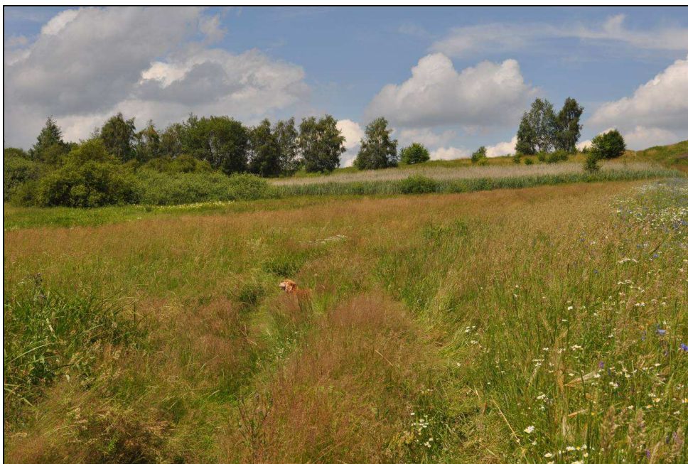
Fot.4: Charakter zbiorowisk łąkowych na obszarze 1: Osiedle Horyzont.