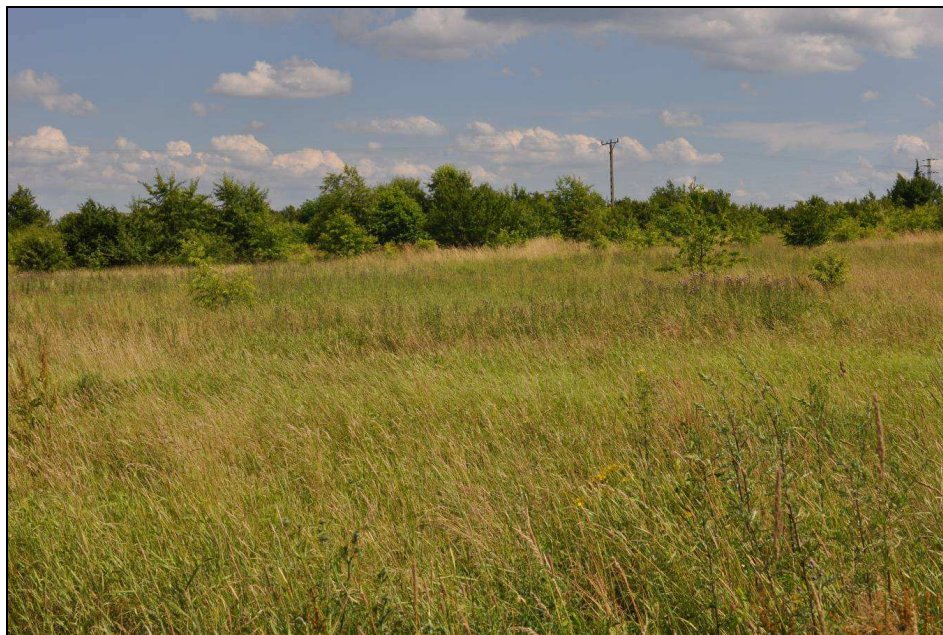
Fot.5: Zbiorowisko łąkowe w zachodniej części obszaru nr 2.

W obniżeniu terenu, w pobliżu ul. 7.Dywizji znajduje się niewielkie oczko wodne. Towarzyszą mu zbiorowiska z mozgą trzcinową Phalaris arundinacea oraz karbieniem pospolity Lycopus europaeus niezapominajka błotna Myosotis scorpioides , przytulia błotna Galium palustre , jaskier płomiennik Ranunculus flammula , rzepicha błotna Rorippa palustris . Pozostałą część oczka zarasta kropidło wodne Oenanthe aquatica oraz żabieniec babka wodna Alisma plantago-aquatica , rdest ziemnowodny Persicaria amphibia i manna fałdowana Glyceria fluitans .