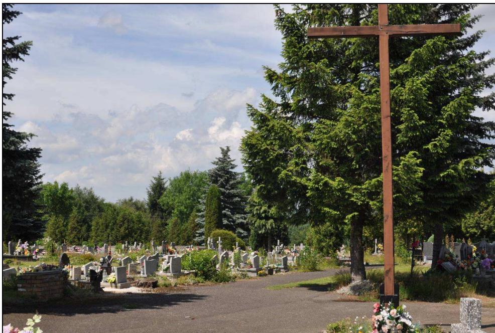
Fot.3: Cmentarz komunalny na Osiedlu Horyzont (fot. własna)

W obrębie omawianego obszaru znajduje się ogrodzony wysokim kamiennym murem cmentarz komunalny o powierzchni ok. 2,6 ha. Zieleń cmentarna nie prezentuje specjalnych wartości dendrologicznych. Rosną tutaj wyłącznie egzotyczne iglaki (żywotniki, cyprysiki, jałowce) oraz świerki pospolite i kujące (srebrzyste). Nasadzone są one wzdłuż alei prowadzących do centralnego placu z krzyżem, wzdłuż murów cmentarza oraz soltiero-wo na całej jego powierzchni. Są to niewielkie drzewa, o obwodach pni rzadko przekraczających 120 cm.