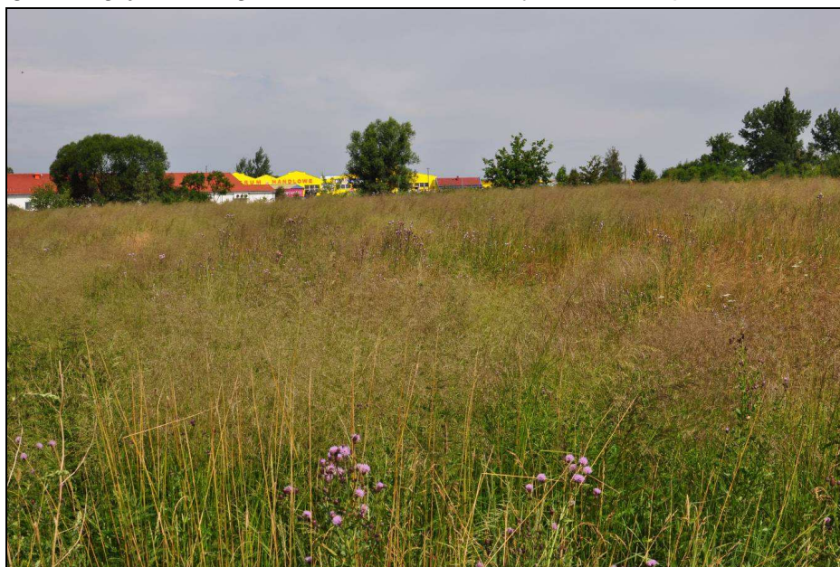
Fot.7: Charakter zbiorowiska łąkowego w południowej części obszaru nr 4 (fot własna 13 VII 2016 r.)

millefolium , przywrotniki Alchemilla sp., dziurawiec czteroboczny Hypericum perforatum , przytulia pospolita Galium mollugo , jaskier ostry Ranunculus acris , dzwonek rozpięchły Campanula patula , chaber łąkowy Centaurea jacea koniczyna łąkowa Trifolium pratense oraz trawy takie jak rajgras wyniosły Arrhenatherum elatius , kłosówka miękka Holcus mollis , śmiałek darniowy Deschampsia caespitosa mietlica pospolita Agrostis capillaris czy kupkówka pospolita Dactylis glomerata . Dalej w kierunku wschodnim pojawiają się tu niewielkie drzewa i krzewy, które stopniowo przechodzą w formę zadrzewień i zakrzaczeń. Budują go głównie głogi Crataegus sp., i czeremchy Padus zarówno zwyczajnej P. avium , jak i amerykańskiej P. serotina , niewielkie jesiony, jarzab pospolity, czereśnia ptasia, olsza czarna, lipa drobnolistna, wierzba krucha. W różnych miejscach tego wydzielenia koncentracja zieleni średniej i wysokie jest różna, od swobodnie rosnących krzewów pośród wymienionych wcześniej zbiorowisk łąkowych po zwarte ich płaty. Rozległy płat zakrzaczeń o powierzchni ok. 1,6 ha rozciąga się od ulicy Lwóweckiej pasem równoległym do ul. Sikorskiego. W runie, oprócz wymienionych wcześniej gatunków łąkowych spory udział mają rośliny nitrofilne. Teren jest zaśmiecony. Z punktu widzenia florystycznego nie przedstawia on większych wartości, jakkolwiek jest godne uwagi ze względu na dogodne siedlisko dla drobnych ssaków i ptaków.