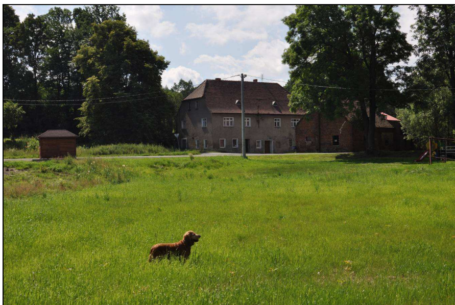
Fot. 2: Wgląd na teren w Krzewiu Wielkim

Obsługę komunikacyjną terenu opracowania zapewnia przede wszystkim droga krajowa nr 30: Zgorzelec (A4)- Lubań – Gryfów Śl. – Jelenia Góra przenosząca znaczny ruch tranzytowy od granicy polsko- czeskiej (Jakuszyce) do granicy polsko- niemieckiej (Jędrzychowice, Zgorzelec, Radomierzyce) oraz droga wojewódzka nr 364 prowadząca z Gryfowa Śl. przez Lwówek i Złotoryję do Legnicy. Bezpośrednią obsługę poszczególnych posesji zapewnia sieć dróg lokalnych, dojazdowych i wewnętrznych oraz technologicznych (rolniczych).