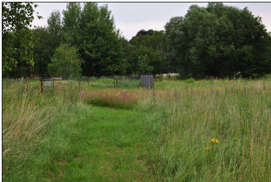
Fot 8: Ujęcie wody nad Oldzą (z 13 VII 2016 r.)

Przyległą do ulicy Jeleniogórskiej działkę nr 218 zajmuje zsynatropizowane zbiorowisko łąkowe zarastające krzewami (głównie wierzby oraz głóg i śliwa wiśniowa) oraz bylinami inwazyjnymi (głównie nawłóć olbrzymia (późna) Solidago gigantea ). Teren jest częściowo rozjeżdżony kołami samochodów, z pryzmami gruzu i ziemi. Nie prezentuje on większych wartości przyrodniczych. Podobny charakter ma działka nr 219. Przestrzeń tą urozmaicają spore płyty wierzbowki kiprzycy Chamaenerion angustifolium , przytuli pospolitej Galium mollugo oraz kępy wiązówki błotnej Filipendula ulmaria .