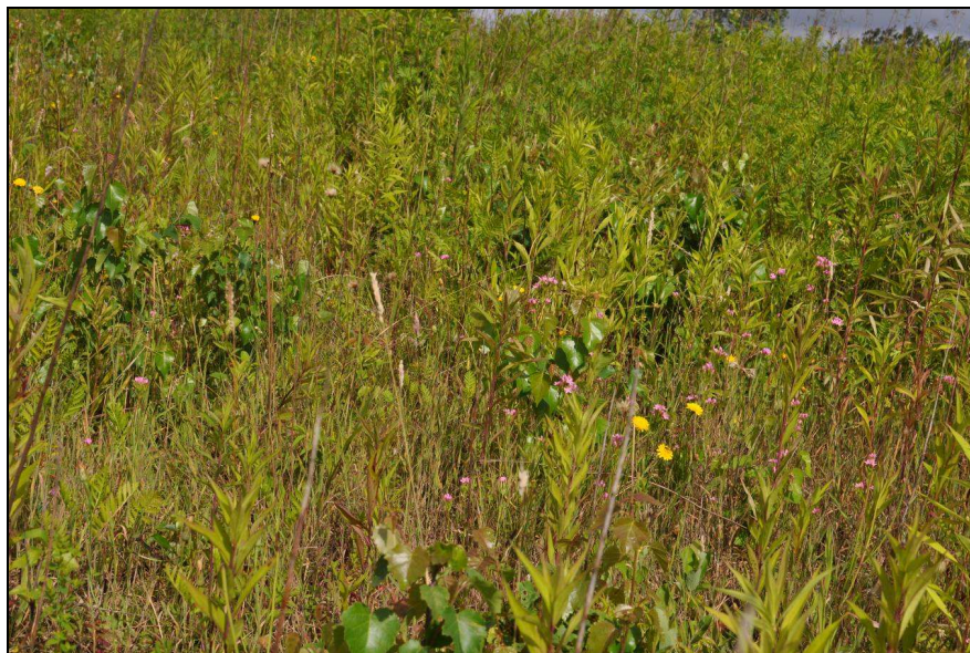
Fot.9: Charakter zbiorowiska roślinnego na obszarze 7

Wyróżnia się tutaj kępa wierzby szarej Salix cinerea w źródliku potoku, którego koryto jest aktualnie suche. W obrębie dolinki przecinającej działkę nr 816 występują niewielkie skupiska trzciny pospolitej i mozgi trzcinowatej oraz wiązówki błotnej.