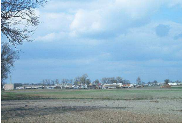
Widok od strony Gołańczy