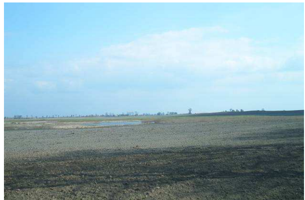
Stawy pod Potulinem