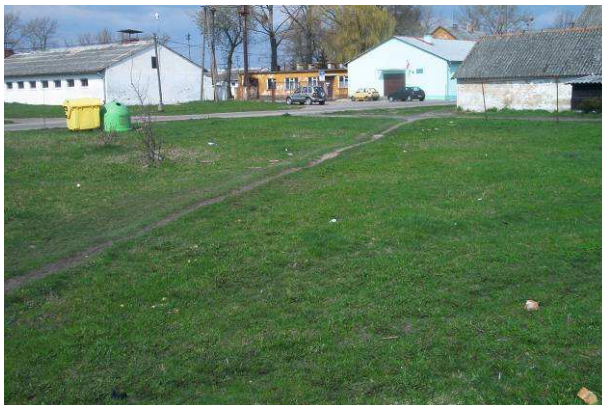
Wolne miejsce w centrum wsi