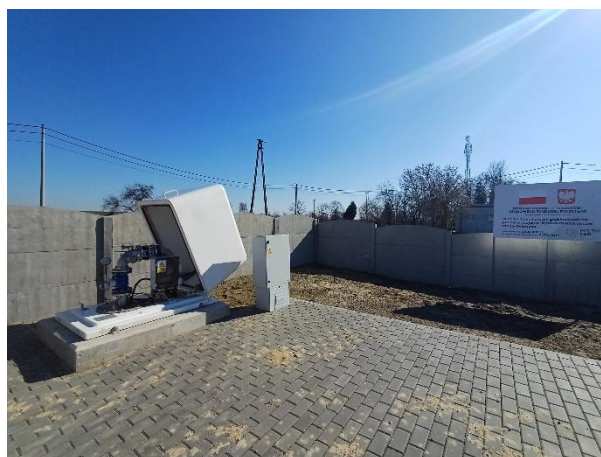
Studnia zastępcza na działce 1020/16