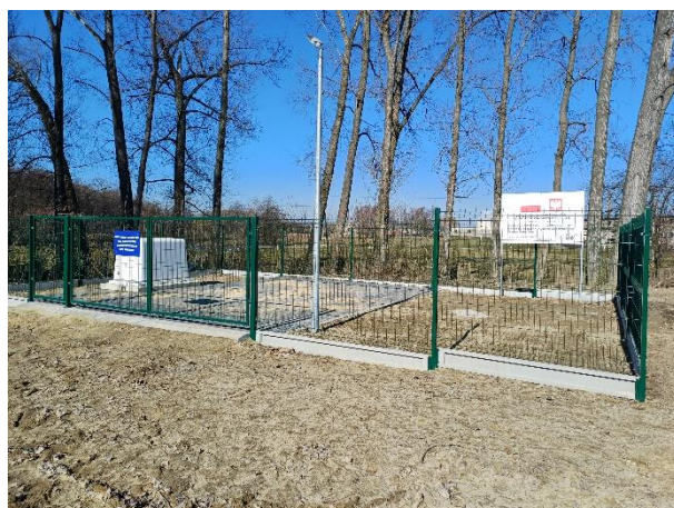
Studnia awaryjna na działce 1654/1

Całkowita wartość inwestycji 2 098 995,00 zł