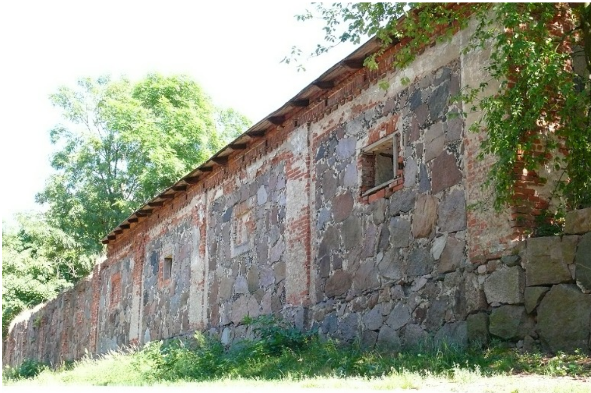
Pozostałości budynku wchodzącego w skład byłego zespołu folwarcznego

Przy dworze jest również park o pow. 1,16ha, założony w II połowie XIXw. na zboczu łagodnie opadającym ku rzece Lutynii z aleją grabową i szpalerem topolowym.