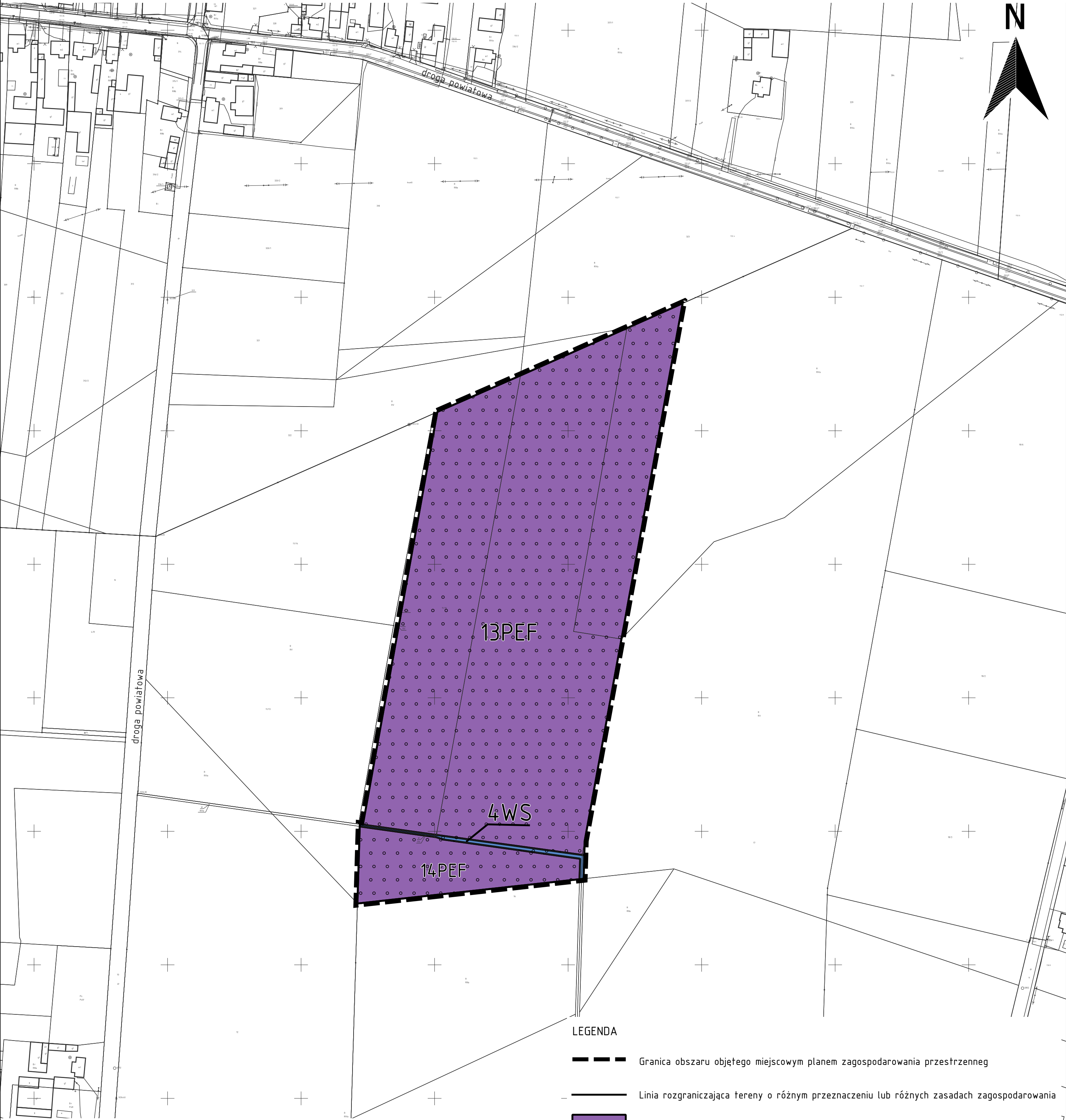
WYRYS ZE STUDIUM UWARUNKOWAŃ I KIERUNKÓW ZAGOSPDOAROWANIA PRZESTRZENNEGO GMINY DOBRZYCA