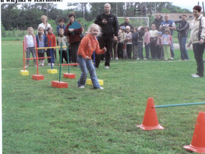
Foto. 6. Festyn wiejski w Karminie.

UKS „Lutyńka” prowadzi aktywną działalność wśród młodzieży karminskiej, zwłaszcza zachęcając do uprawiania piłkarstwa. Trenuje dzieci i młodzież, a drużyny aktywnie uczestniczą w różnego rodzaju rozgrywkach. UKS „Lutyńka” organizuje również rozgrywki w Tenisa Stołowego w okresie jesienno-zimowym wraz z cieszącym się dużą popularnością turniejem. Klub jest również współorganizatorem wielu imprez na terenie wsi, np. festynu wiejskiego.