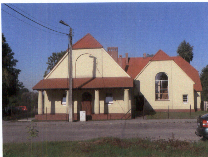
Foto. 4. Budynek Przedszkola Publicznego w Karminie.

Przedszkole karminskie mieści się w budynku po generalnym remoncie przystosowanym w całej pełni na potrzeby przedszkola, w tym dostosowane do potrzeb dzieci niepełnosprawnych. Jest to przedszkole dwuoddziałowe zdolne przyjąć 50 dzieci, obecnie uczęszcza do niego 32 dzieci. Placówka posiada własną stołówkę.