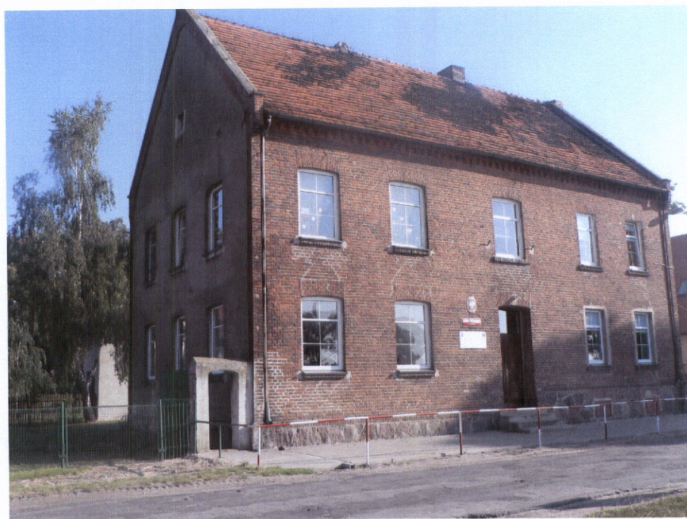
Foto. 2 Budynek Szkoły Podstawowej

Szkoła podstawowa znajdująca się w Karminie jest miejscem nauki dla ok. 60 dzieci, swym obwodem obejmuje ponadto Karmin, Karminie, Karminiek, Nowy Karmin, Gustawów oraz część folwarczną wsi Czarnuszka. Do szkoły z części wsi zorganizowany jest dowóz dzieci. Szkoła mieści się w budynku wybudowanym na cele oświatowe w końcu XIX w., ponadto korzysta z budynku przedszkola, gdzie zlokalizowana jest sala przystosowana do zajęć w-f (wraz z szatniami i zapleczem) oraz sześciostanowiskowa pracownia komputerowa ze stałym łączem internetowym. Szkoła korzysta również z kuchni i stołówki przedszkola.