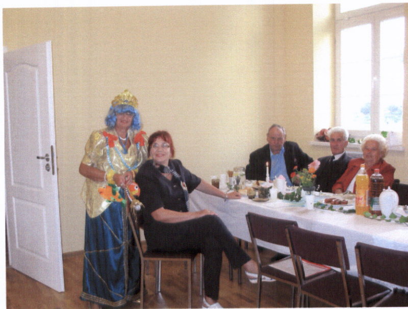
Foto. 5. Dzień seniora występ zaproszonych artystek