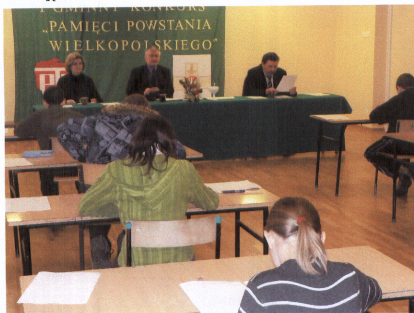
Foto. 3. Konkurs historyczny odbywający się w Szkole Podstawowej w Karminie – na co dzień sala przystosowana do zajęć w-f.