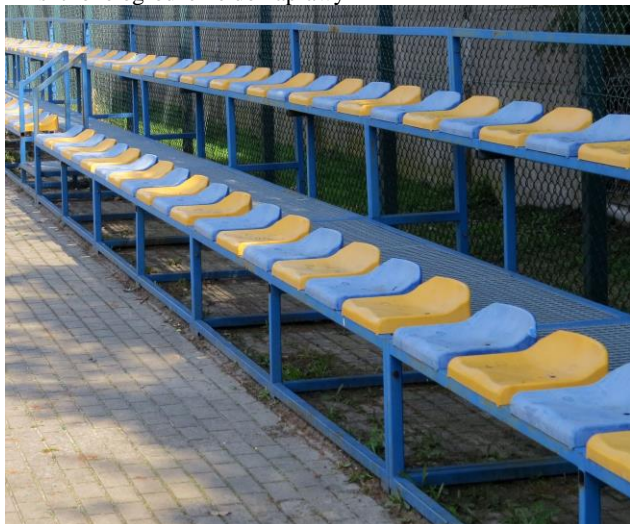
Trybuny do malowania