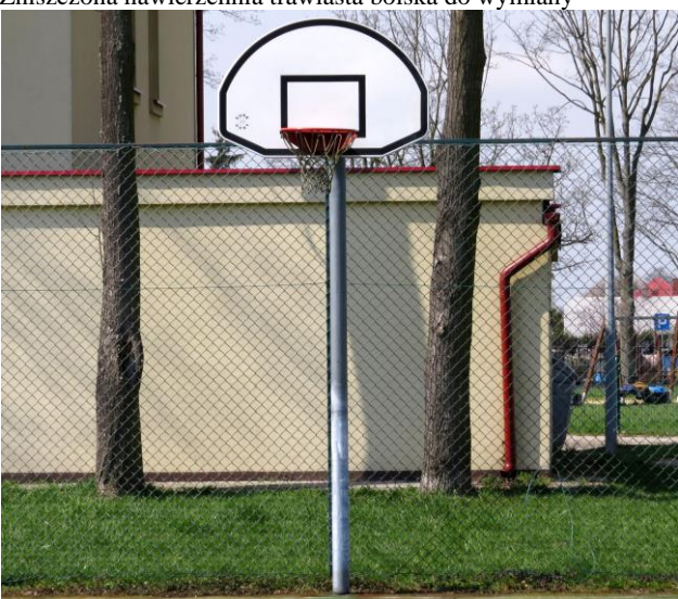
stojak do koszykówki z tablicą do wymiany