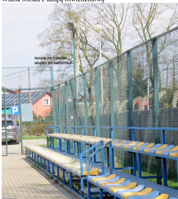
Trybuny z chodnikiem i lampą oświetleniową