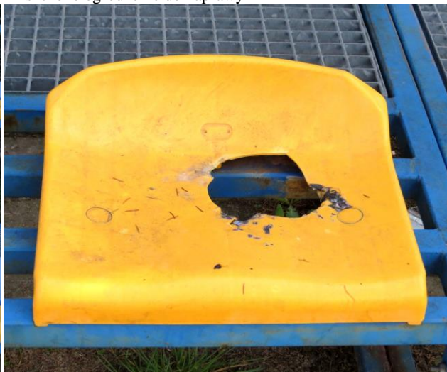
Uszkodzone siedzisko do wymiany