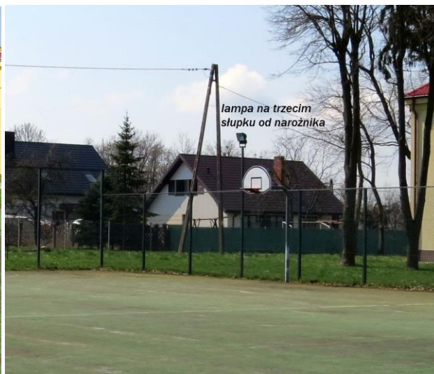
Widok boiska z lampą