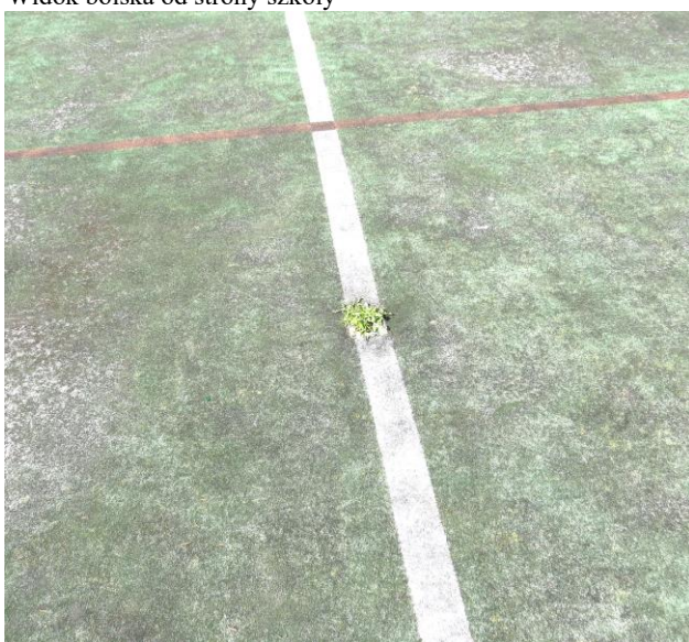
Zniszczona nawierzchnia trawiasta boiska do wymiany