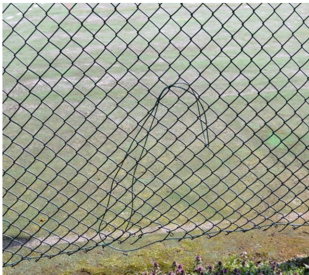
Zniszczone ogrodzenie do naprawy