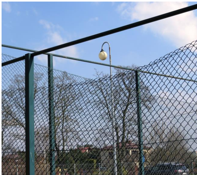
Zniszczone ogrodzenie do naprawy