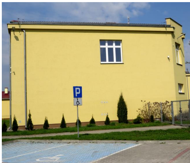
Kamera z lewej strony budynku szkoły do wymiany