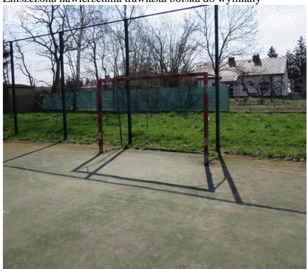
Bramka do wymiany