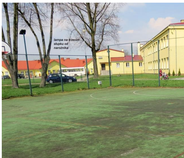
Widok boiska z lampą oświetleniową