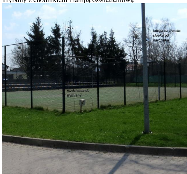
Widok rozdzielni na ogrodzeniu do wymiany