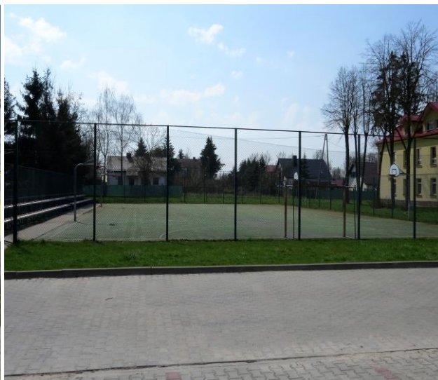
Widok boiska od strony szkoły