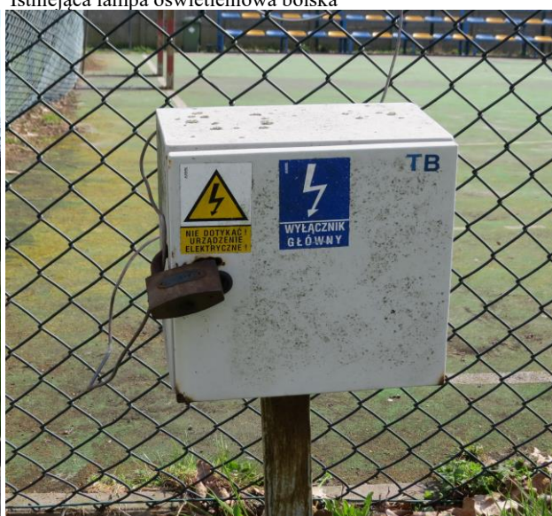
Rozstrzelniona rozdzielnia do wymiany