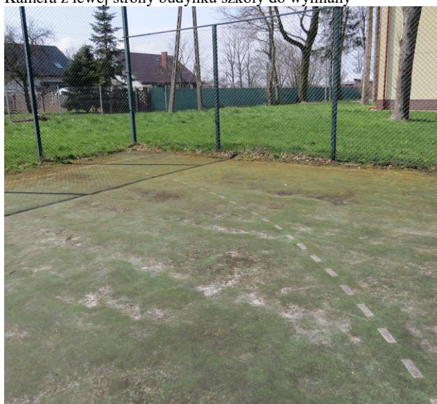
Zniszczona nawierzchnia trawiasta boiska do wymiany