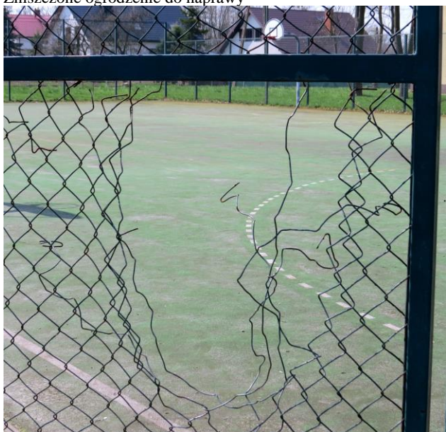
Zniszczone ogrodzenie do naprawy